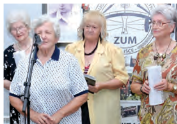
Pjesnici su promovirali i afirmirali poetski izričaj

ječilo nevrjeme. Ipak su ljubitelji pisane riječi mogli uživati, a Večer poezije pod zvijezdama još je jednom pokazala kako je važno promovirati i afirmirati poetski izričaj, što su prigodnim riječima potvrdile i predstavnice suorganizatora, voditeljica belišćanskog Odsjeka za predškolski odgoj, osnovno školstvo, kulturu i tehničku