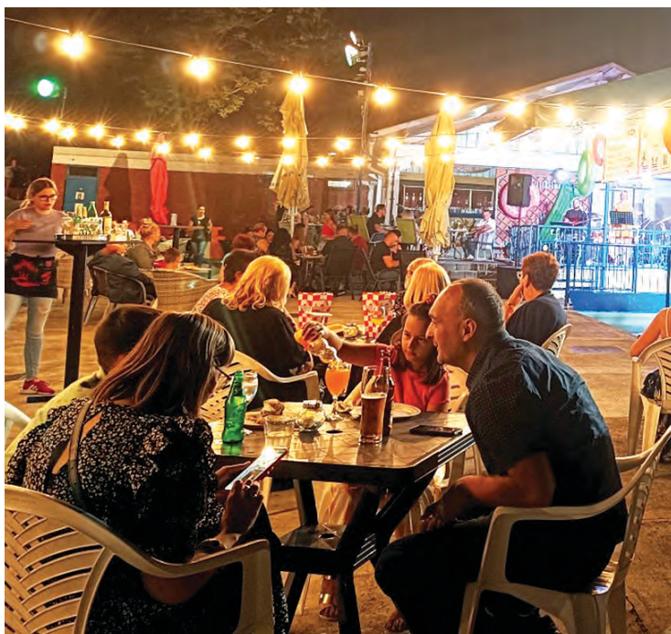
Posjetitelji su se mogli rashladiti uz sladoled i piće

Turistička zajednica i Grad Belišće i ove godine organiziraju natjecanje u kuhanju fiš paprikaša 25. kolovoza