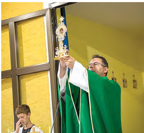
Prvog dana trodnevnicе vjernicima su bile izložene moći bl. Alojzija Stepinca