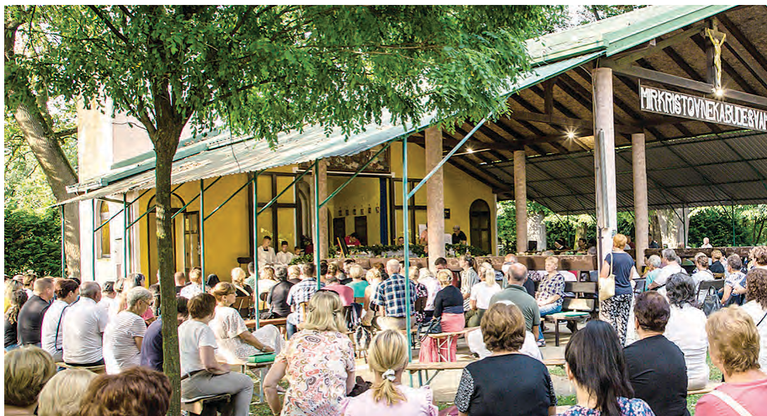
I ove godine Svetište u Bistrincima pohodile su tisuće vjernika