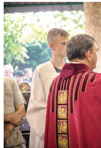
Uz čudotvornu sliku svete Ane