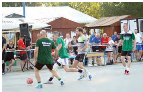
Turnir bizovačkih ulica u nogometu