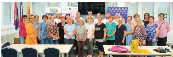
Završna konferencija projekta Zaželi – faza III u Belišću