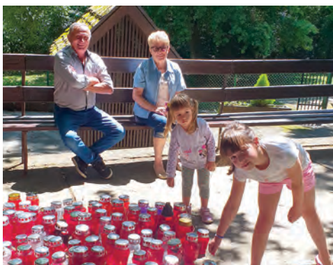
Svetoj Ani posebno se utječu djedovi i bake, roditelji, djeca, majke...