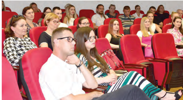
Na konferenciji su prezentirani brojni benefiti ovog projekta

u vrtiću, jer i tada naše stručno osoblje brine o djeci te priprema razne zanimljive radionice i aktivnosti. Svake subote vrtić radi od 9.30 do 16 sati, u matičnom i područnom vrtiću u Gat, dok u područnim u Petrijevcima i Bizovcu radi od 9 do 15 sati. Ukupna vrijednost projekta je: 479.727,30 eura (100 %). Nepo-