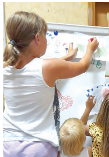
Djeca u projektu "Govorimo hrvatski!"