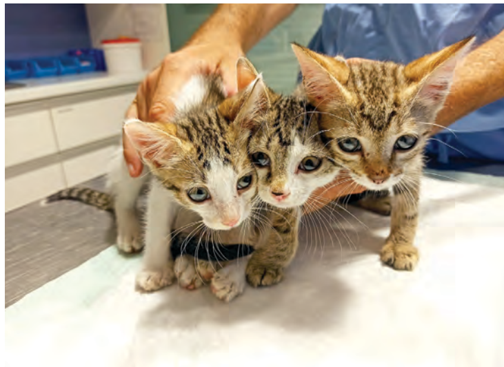
Udruga želi Belišće učiniti sretnim mjestom za mačke i pse