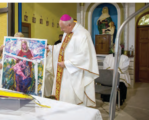
upu je poklonjena slika svete Ane