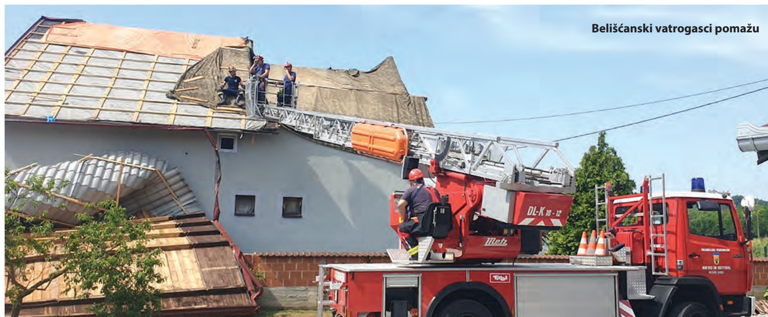
Belišćanski vatrogasci pomažu

Belišćanski vatrogasci s autoljestvama na izvanrednoj dislokaciji