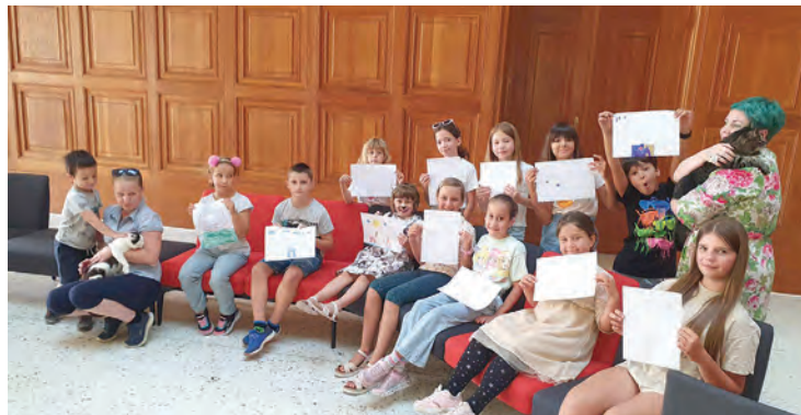
Sudionici radionice Mačak pismonoša