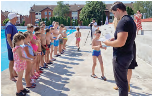
Čestitke i diplome novim plivačima