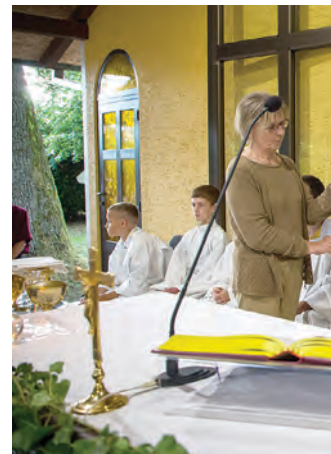
U znak zahvala i sjećanja bisku