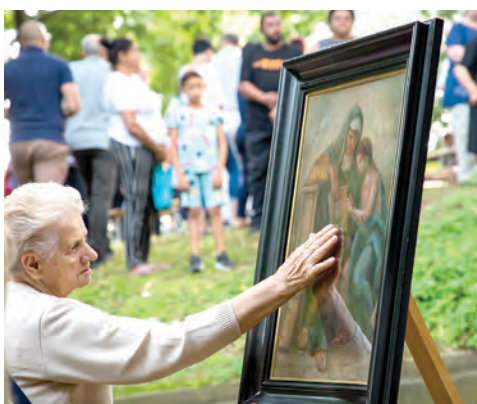
Sveta Ana neiscrpan je izvor utjehe