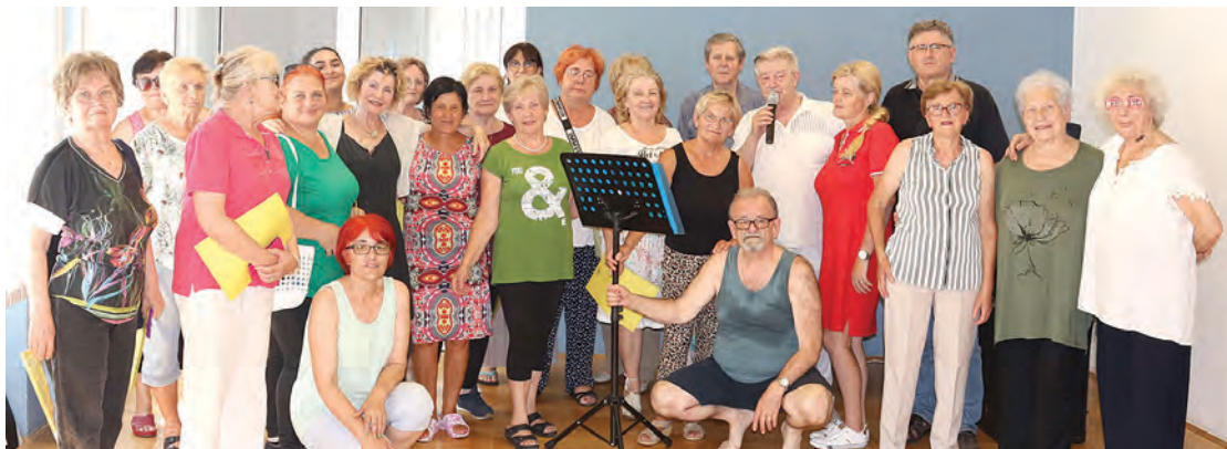
Na koloniji u Belom Manastiru