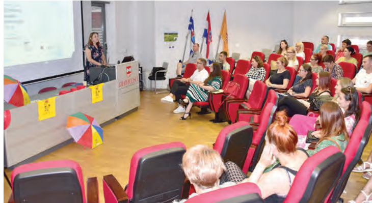
Završna konferencija projekta "Maslačak – prijatelj djece 2"

- Redovan program u Belišću i Gatu počinje u 6.30 a završava u 16.30 sati i tada počinje produženi boravak sve do 21.30 sati. U područnim vrtićima Bizovac i Petrijevi redovan program počinje u 6, a završava u 16 sati i tada se nastavlja produženi boravak sve do 21 sat. Omogućili smo roditeljima da i subotom mogu ostaviti dijete