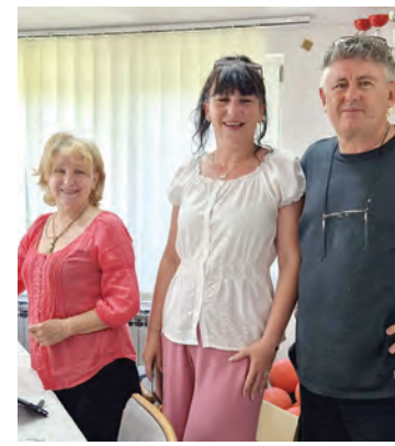
Slikalo se u spomen na Karčija