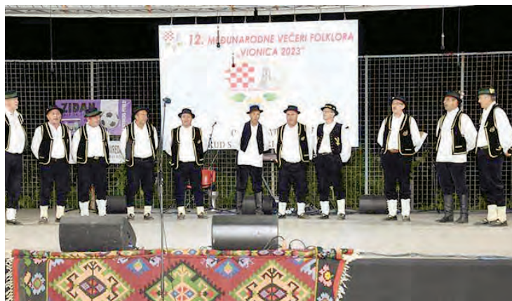
Bocanjevački pajdaši na nastupu u Vionici

Svoj posjet Vionici, koja pripada Općini Čitluk i Župi Medugorje, Pajdaši su iskoristili te posjetili nekoliko znamenitosti. Pri dolasku posjetili su Muzej Bitka za ranjenike na Neretvi u Jablanici da bi potom svratili do Mostara te posjetili njegov stari dio grada te mostarski most. U subotu su odjeveni u tradicionalno šokačko ruvo sudjelovali na svetoj misi na vanjskom oltaru u crkvi sv. Jakova u Medugorju, a nedjeljno dopodne posjetili su i Brdo Ukazanja Blažene Djevice Marije u Bijakovcima, gdje su zajednički uputili molitve Gospi. Međunarodna večer u Vionici završena je u nedjelju kada su nastupila društva iz Madarske, Makedonije, Srbije, Crne Gore, Hrvatske i Bosne i Hercegovine, a domaćini su tom prilikom predstavili i svoje dvije nove pjesme „Nigdje nije kao doma“ i „Ej Brotnjo moje“.