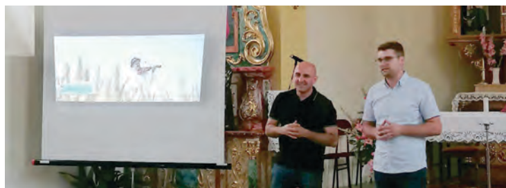
Premijerna izvedba pjesme i videospota „Sa žitom zrijemo“

Bocanjevački pajdaši na međunarodnom gostovanju