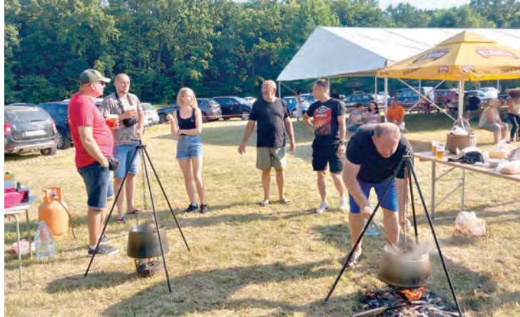
U Tiborjancima je kuhalo četrdesetak ekipa

Vrijedni organizatori koji su svoju ulogu odradili doista vrhunski, za sve su natjecatelje pripremili po tri kilograma mesa, porcije, kruh i stol pod velikim šatorom pivovare, a kuhari su, pak, svatko po svojoj recepturi, pripremali jelo u koje su dodavali sol, papriku, luk, vino i razne druge čarobne sastojke po kojima je svaki od čo-