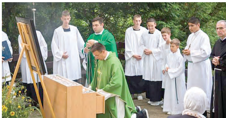
Slika svete Ane prenosila se do poklonca