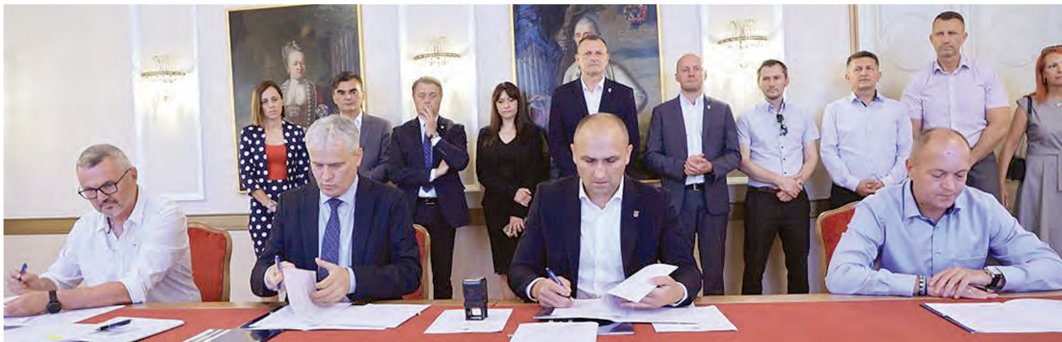
Potpisivanje ugovora o proširenju i dogradnji Sustava navodnjavanja Gat