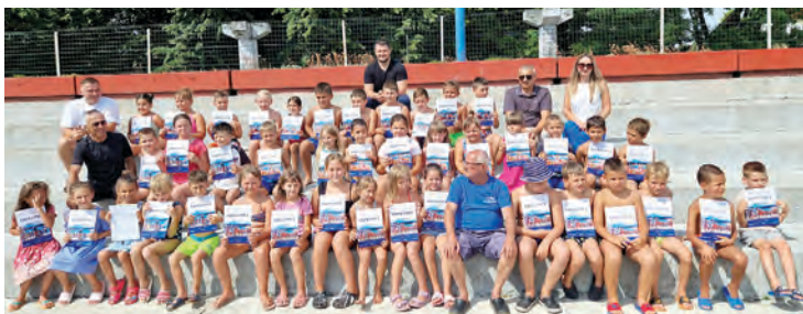
Novih 45 plivača obučanih na belišćanskom bazenu

Kao i prethodnih godina, škola plivanja besplatna je za polaznike