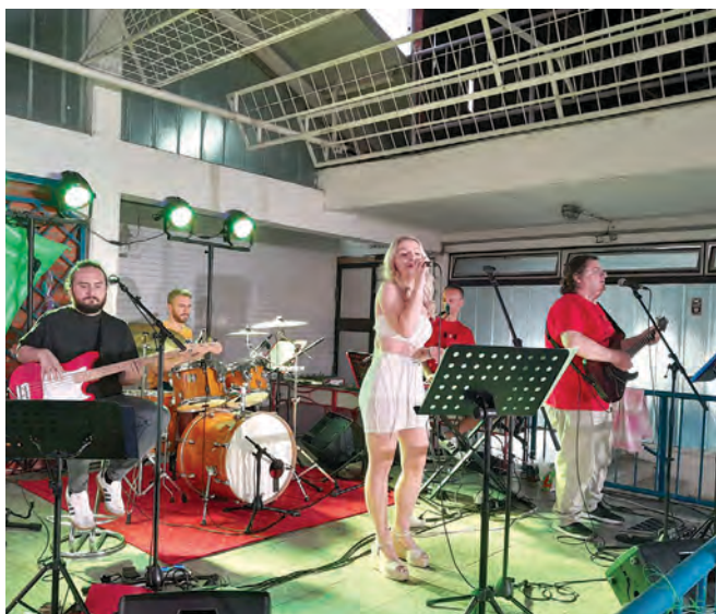
Goste je uveseljavao Zabavni orkestar AK Belišće