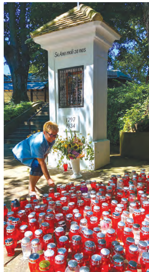
Vjernici su danima palili svijeće i molili ispred poklonca svete Ane

Za sve vjernike koji su dolazili u svetište svakodnevno je bio osiguran prijevoz autobusom do svetišta na svaku svetu misu, a tijekom sva četiri dana vjernici su imali priliku i za svetu ispovijed.