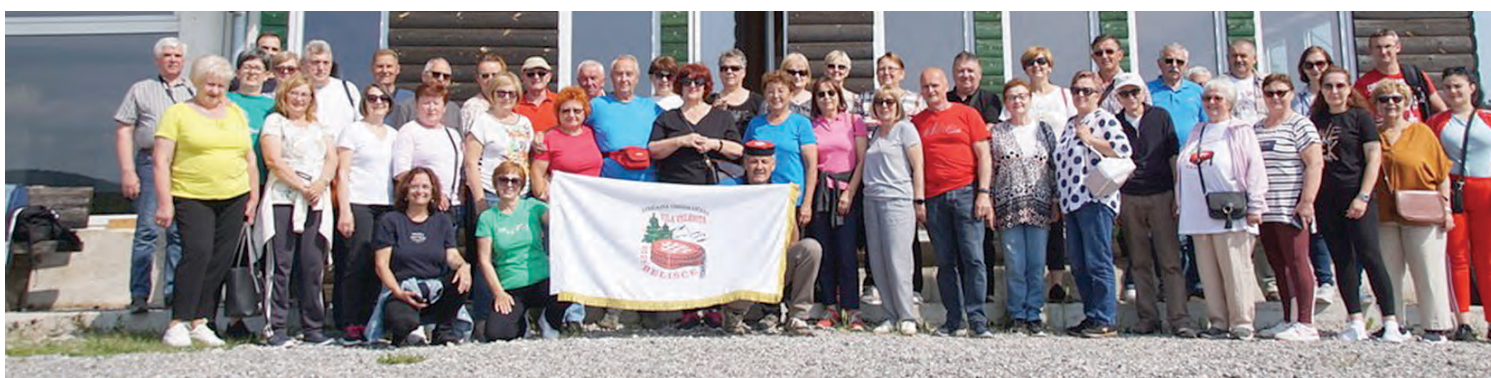
U posjetu ličkom zavičaju

Udruga Ličana Vila Velebita obilježila 20 godina djelovanja