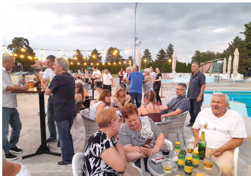
Okupljeni su uživali u toploj ljetnoj večeri