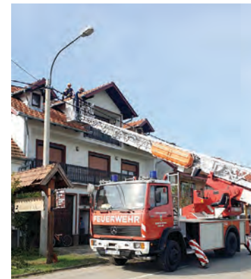
Sanirali su se oštećeni stambeni i drugi objekti

upućen na pogodeno područje Pleternice s dva vatrogasca i auto ljestvama. Izvanredna vatrogasna dislokacija iz Osječko-baranjske županije, uključila je JVP-ove Grada Osijeka i Beli Manastir te DVD Đakovo i VZ Baranja, a upućena je i u Vukovarsko-srijemsku županiju na područje Županje i Iloka s ukupno 34 vatrogasca i 8 vatrogasnih vozila. Svaka vatrogasna intervencija je specifična za sebe, tako da u njoj sudjeluju samo osposobljeni, propisano opremljeni i taktički uvježbani za obavlja-