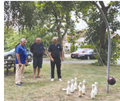
Natjecanje i druženje branitelja

Svečano obilježen Dan pobjede i Dan domovinske zahvalnosti te Dan hrvatskih branitelja