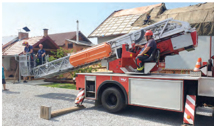
Autoljestve pokazale su se posebno korisnima u ovakvim situacijama

N a temelju zapovijedi Glavnog vatrogasnog zapovjednika, pripadnici DVD-a Belišće i Osječko-baranjske županije 20. srpnja 2023. godine upućeni su na područja Vukovarsko-srijemske i Požeško-slavonske županije kao ispomoć u otklanjanju posljedica nevremena koje je poharalo ovo područje 19. srpnja 2023. godine. Vatrogasci koji su upućeni u ispomoć radili su na uklanjanju stabala, granja, crijepova s kolnika te na sanaciji krovovišta i dimnjaka. Temeljem zapovijedi upućene su tri vatrogasne auto ljestve i jedna zglobna platforma, tri kombi vozila, jedno zapovjedno vozilo i ukupno 36 vatrogasaca iz Vatrogasne zajednice Osječko-baranjske županije. U dislokaciji su sudjelovali: JVP Grada Osijeka, JVP B. Manastir, VZ Baranja, DVD Belišće, DVD Đakovo i PVZO Đakovštine. Vatrogasci su toga dana zabilježili dan ispunjen velikim brojem intervencija. Prema podacima Državnog vatrogasnog operativnog centra, bila je zabilježena 2.961 vatrogasna intervencija u kojoj je sudjelovalo 8.652 va-