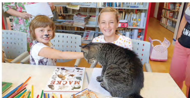
Djeca su uživala u igri s mačkom