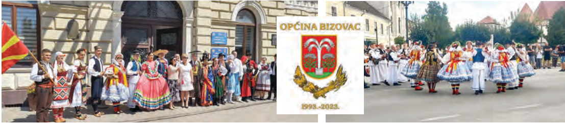
Nastupi Bizovčana oduševljavali su posjetitelje