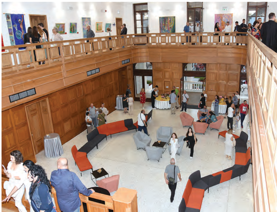
Obilazak obnovljenog Paleja u kojem je postavljena izložba