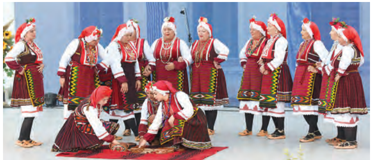
Puno pozornosti izazvao je i nastup gostiju iz Sjeverne Makedonije

zatim tradicijski tanac po paški uz sviranje na mihu (mišnjicu), do pjesme i plesova županijskog kraja, kao i kolo, pjesme i napjevi Bukovice i Ravnih kotara te bilogorske pjesme i plesove. U nastavku smotre predstavljen je radoviški svadbeni običaj, u kojem se posebno isticao specifični originalni kostim star 90 godina, dok su se članovi KUD-a "Sve-