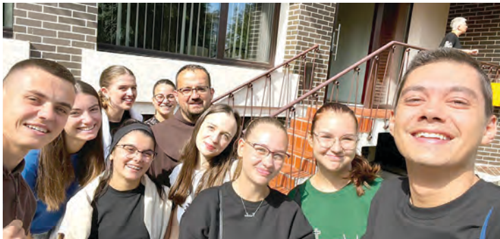
Framaši u Čakovcu