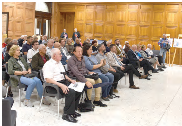
Sudionici ovogodišnjeg Mjeseca židovske kulture okupili su se u obnovljenom Paleju