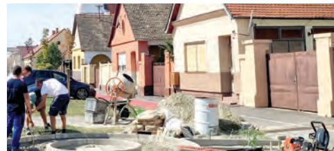
Počela je izgradnja spomen obilježja

Općina Bizovac odaje počast žrtvama raketiranja Bizovca 7. studenog 1991. godine