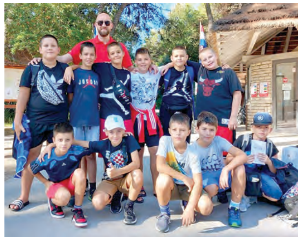
Mali košarkaši istinski su uživali na moru