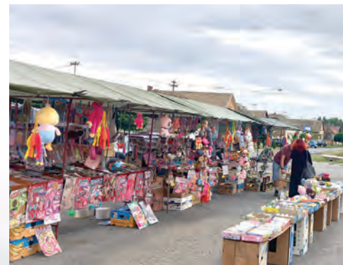
Svoj crkveni god mještani Tiborjanaca proslavili su na Matejevo

Posljednja ovogodišnja proslava crkvenog goda u gradu Belišću i prigradskim naseljima bila je ona vinogradačka. Stanovnici Vinogradaca proslavili su svoju nebesku zaštitnicu Blaženu Djevicu Mariju od Krunice u nedjelju, 1. listopada u filijalnoj crkvi Blažene Djevice Marije od Krunice, gdje je u 11 sati održano svečano euharistijsko slavlje. Osim sudjelovanja na misi, mještani Vinogradaca dan su proveli u ugodnom druženju s obitelji, prijateljima i gostima iz drugih krajeva i mjesta koji ih redovito posjećuju na ovaj poseban, svečarski dan u godini, a koje oni uvijek srdačno dočekaju časte-