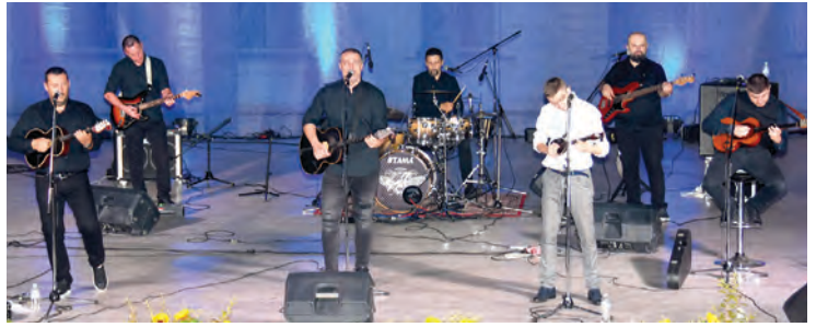
Tamburaški sastav Džentlmeni pobrinuo se za dobru zabavu