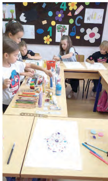
Radionica izrade hamse u Vinogradcima

Hamsa je simbol, popularna hamajlija za magičnu zaštitu od zavidnog oka. Riječ hamsa (hameš) znači „pet“ i predstavlja broj prstiju na ruci. Drugo ime za hamsu po Arapima je ruka Fatime, Muhamedove kćeri, a po Židovima ruka Miriam, sestre Arona i Mojsija. Ovaj se simbol koristi na nakitu, raznim ogrlicama, naušnicama, ulaznim vratima, automobilima, privjescima za ključeve, magnetima i sl. Često se na oblik hamse pišu molitve i objese na zid. Neki izvori smatraju da pet prstiju predstavlja pet knjiga Tore, ali i pet knjiga iz islamske vjere. Posljednjih godina mnogi aktivisti za mir na Srednjem istoku nose hamsu kao simbol sličnosti korijena i tradicije između židovske i islamske vjere, nadajući se njome riješiti sukobe.