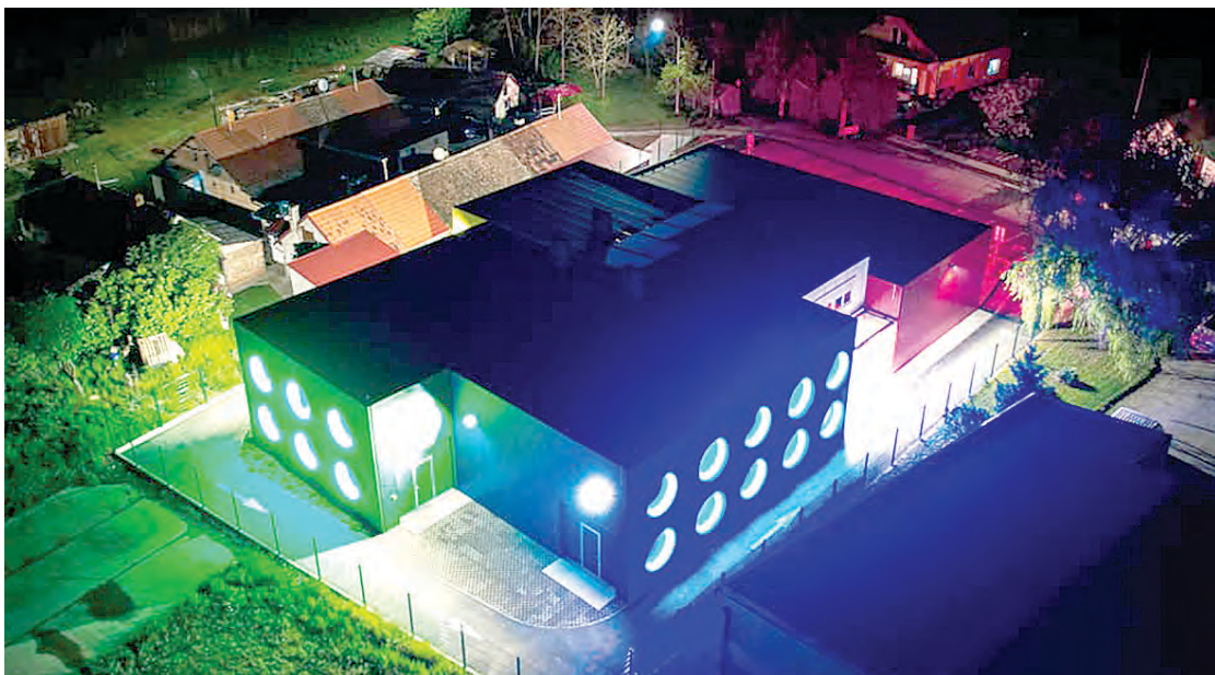
Novi Polet prostire se na površini većoj od 700 četvornih metara

U Programu virtualne inkubacije dobrodošli su poduzetnici početnici i poduzetnici u kasnijoj fazi rasta i razvoja koji nemaju potrebu za fizičkim prostorom u belišćanskom Poletu, te fizičke osobe koje namjeravaju osnovati poslovni subjekt, a koje su dužne u roku od 30 dana od dana registracije poslovnog subjekta dostaviti PI Polet presliku obrtnice ako je ponuditelj obrtnik ili presliku rješenja o upisu u sudski registar za pravne osobe. Ugovor o korištenju programa virtualne inkubacije potpisuje se na razdoblje od pet godina uz mogućnost produženja do ukupno deset godina.