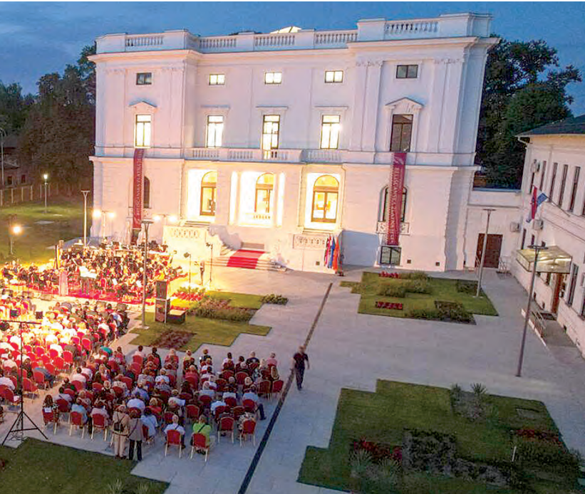
događanje Belišćanske zlatne jeseni