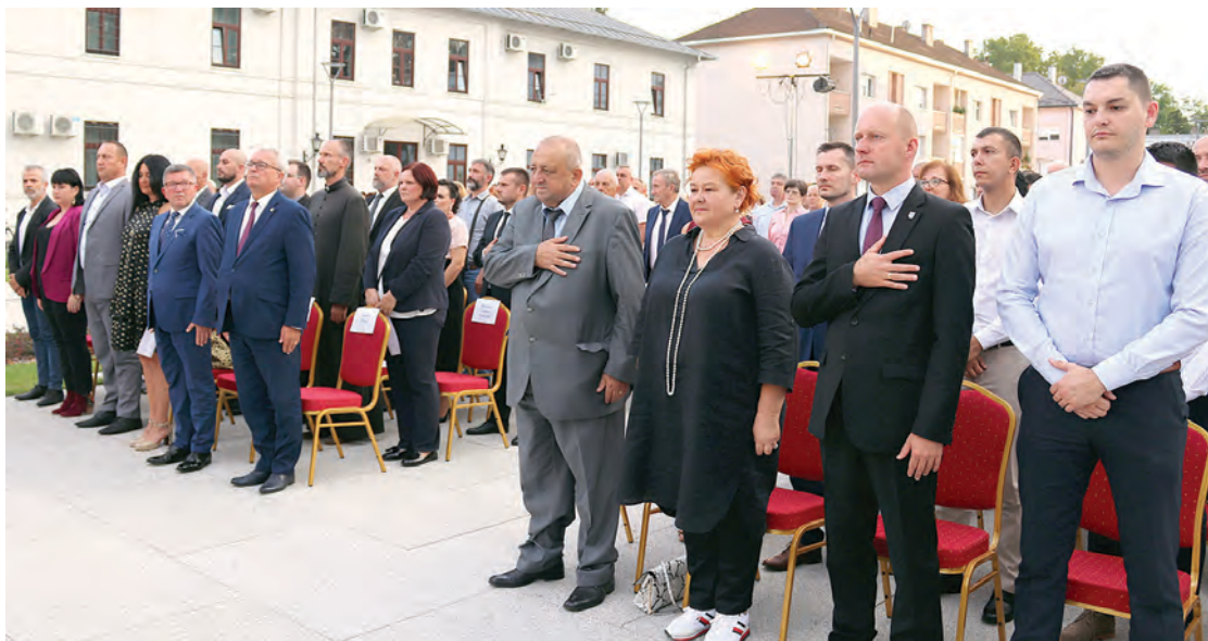
Na poziv Belišćana, gosti su stigli iz Mađarske, Crne Gore, Bosne i Hercegovine te Sjeverne Makedonije