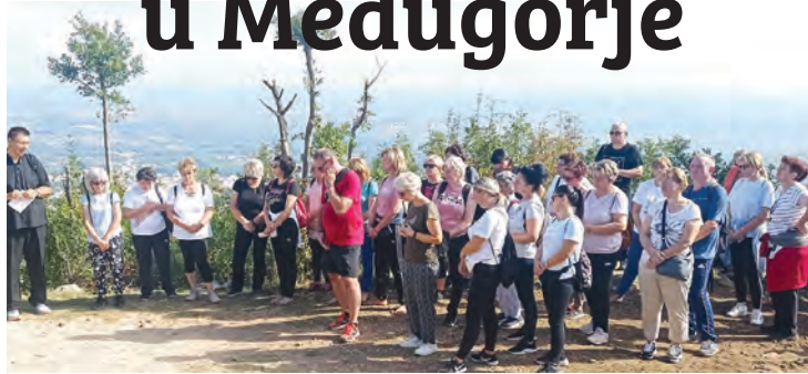
Vjernici iz Beliša na hodočašću u Međugorje

činka belišćanski su hodočasnici sudjelovali u večernjem programu te euharistijskom klanjanju. - Prema Brdu ukazanja, ili Podbrdu, krenuli smo pješice u nedjelju u 7 sati. Dok smo se uspinjali, molili smo slavna otajstva krunice, a molitvu je i tog jutra predvodio fra Marko. Došavši na predviđeno mjesto, ostali smo neko vrijeme u osobnoj molitvi. Boravak u Međugorju završen je sudjelovanjem na euharistijskom slavlju. Okrijepljeni duhovnom i tjelesnom hranom zaputili smo se našim domovima zahvalni dragom Bogu, našoj Nebeskoj Majci te našem župniku, fra Marku Neretljaku za sve darove, iskustva i nova prijateljstva - napisala je Lucija na kraju svog izvještaja o hodočašću Kraljici Mira u Međugorje.