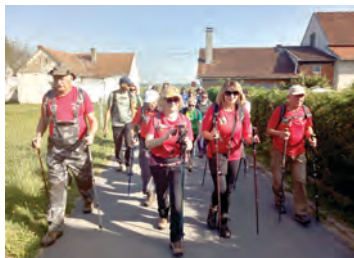
Planinari su imali izletima bogat rujna

vac Skandala, kontrolnu točku Hrvatske planinarske obilaznice. Ovaj izlet belišćanski planinari iskoristili su i za posjet Principovcu, Iloku i Ovčari.