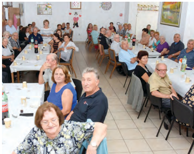
Veliki broj građana sudjelovao je na proslavi

- Ovo je lijepa tradicija kojom iskazujemo poštovanje prema onima koji su radom pridonosili kako svojim obiteljima tako i razvoju našega grada prije nas. Na-