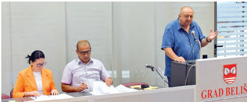
Gradski vijećnici usvojili su izvješća za prvih šest mjeseci