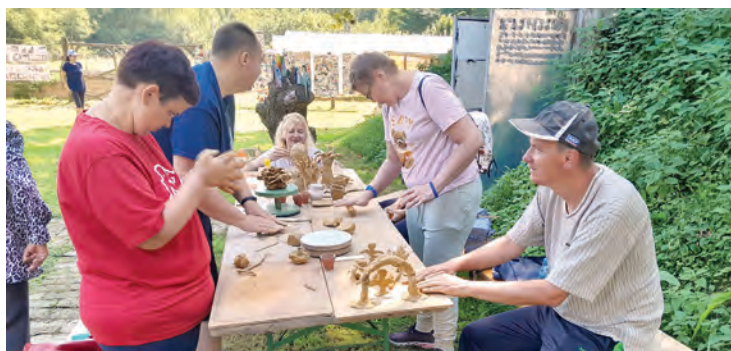
Dan je upotpunilo pregršt zanimljivih radionica

je i dodjela diploma polaznicima koji su kroz projekt VirtuOS uspješno prošli osposobljavanje za pomoćnog priprematelja jednostavnih jela i slastica. Tijekom oba dana posjetitelji i sudionici mogli su pronaći osveženje i