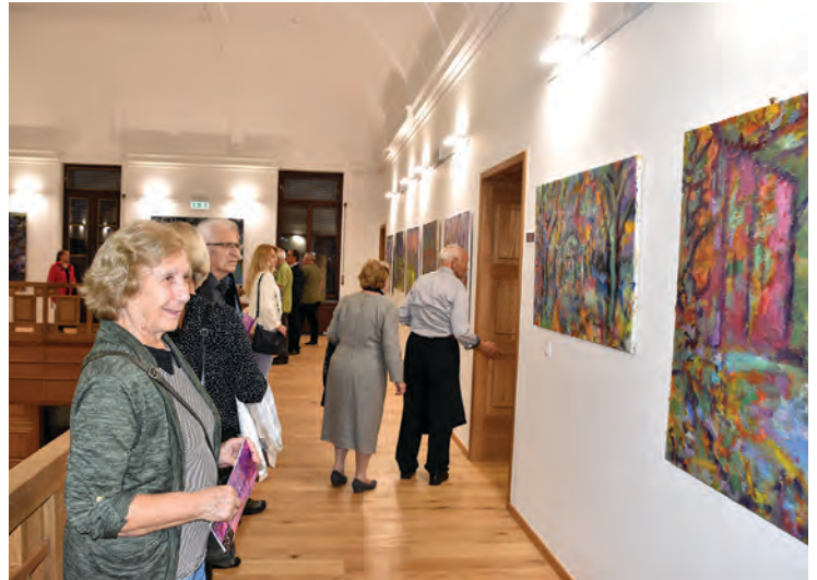
Posjetitelji su uživali u djelima Tonija Franovića