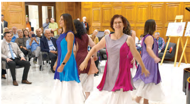
Nastup plesne skupine Haverim Shell Israel