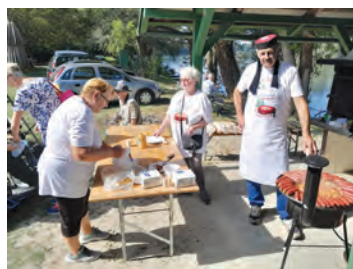
Za posjetitelje su bili pripremljeni lički specijaliteti