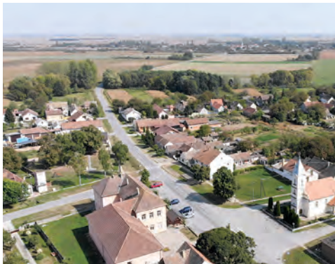
U Habjanovcima se prodaje sedam atraktivnih parcela

Na sjednici održanoj 14. rujna 2023. Općinsko vijeće općine Bizovac donijelo je odluku o prodaji sedam građevinskih parcela na atraktivnoj lokaciji u Habjanovcima, u Kolodvorskoj ulici. Na temelju procjemenog elaborata vrijednosti koji je utvrdio stručni procjenitelj zemljište veličine od 649 četvornih metara prodavat će se preko natječaja po početnoj cijeni od 1664 eura. Građevinsko zemljište opremljeno je potrebnom infrastrukturom, plinskom mrežom, vodovodom i pristupnom cestom. Sve detaljnije informacije zainteresirani mogu dobiti u Općini Bizovac svakog radnog dana osobno ili preko telefona 675 301.