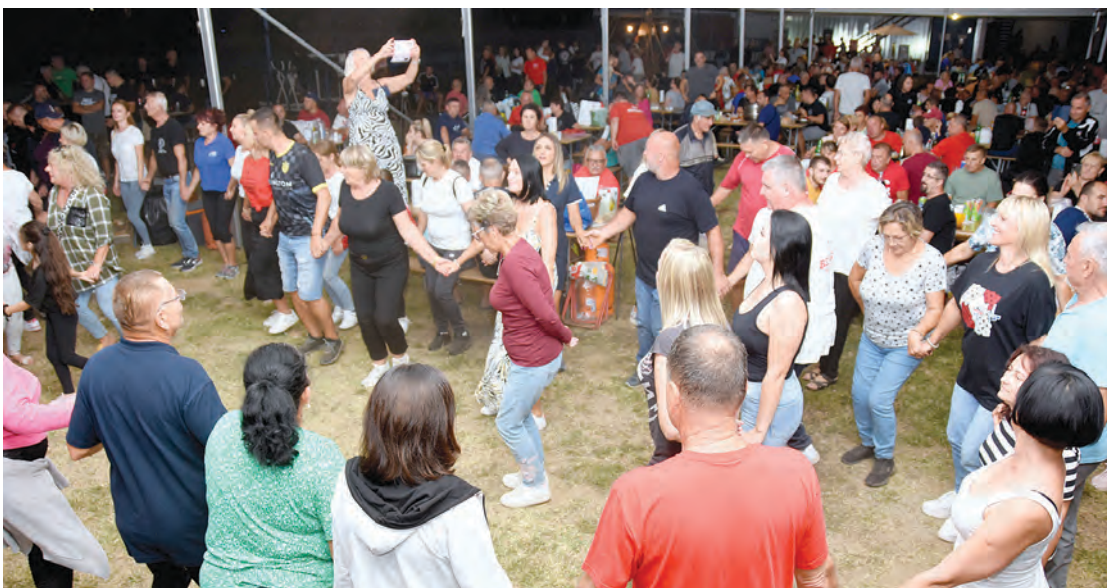
Večer je završila pjesmom i plesom

U susret pravoj kalendarskoj jeseni, Državnim natjecanjem u kuhanju čobanca započela je i ovogodišnja Belišćanska zlatna jesen, naša međunarodna gradska manifestacija koja iz godine u godinu čuva i njeguje tradiciju te kulturno nasljeđe Grada Belišće i upotpunjuje našu turističku ponudu.