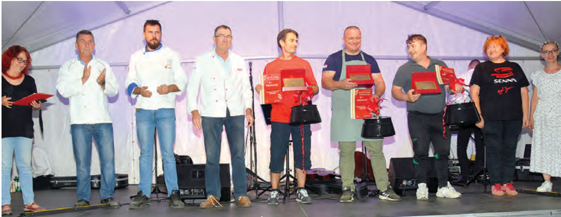
Pobjednici Državnog natjecanja proslavili su uspjeh