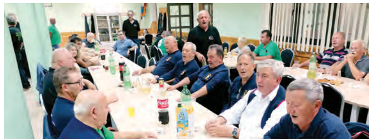
Druženje pjevačkih skupina u Bocanjevima