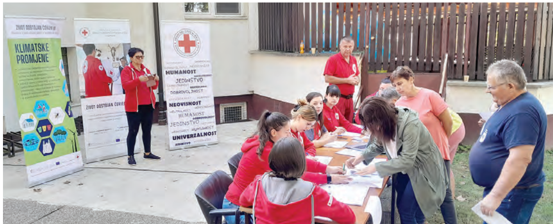
Pakete je dobilo oko 150 kućanstava u Belišću i stotinjak u Bistrincima

- U Belišću je predviđena podjela paketa za otprilike 150 kućanstava, a u sklopu podjele u Bistrincima bilo je predviđeno paketa za stotinjak kućanstava. Dijele se paketi higijene i paketi posuda. Dakle, svako kućanstvo dobije paket posuda, a paketi higijene dijele se po članu obitelji, tako da dijele dječje pakete, muške i ženske koji se sadržajno razlikuju. Vrijednost paketa je oko 60 eura, a posuda 50 eura - sažela je djelatnica valpovačkog Crvenog križa, Sanela Zečević.