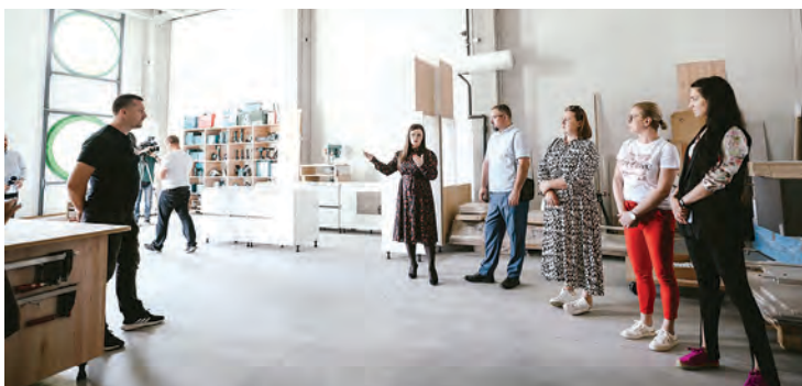
Uz fizičke, PI Polet već ima i virtualne stanare