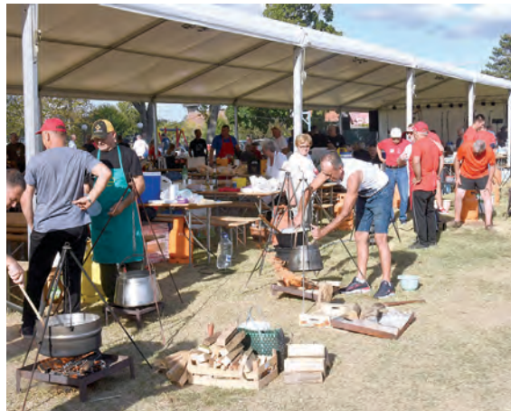
Umijeće kuhanja odmjeravalo je 55 natjecatelja