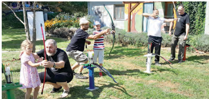
Učilo se gađanje lukom i strijelom

Osim prigodnog domjenka, prvi dan šumskog festivala obilježio je nastup Fire spinner u izvedbi Ene i Patricije, a zainteresirani sudionici svoje su znanje mogli odmjeriti i u šumskom pub kvizu koji je organizirala ekipa "KGH u ČŽŠ", dok su se za odličnu glazbenu podlogu pobrinuli lokalni glazbenici Mefa i Fran. Sutrašnji dan obilježila