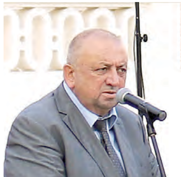
O velikom danu i događaju za Belišće govorio je gradonačelnik Dinko Burić

odobrenja sufinanciranja iz EU fondova do njegova završetka.