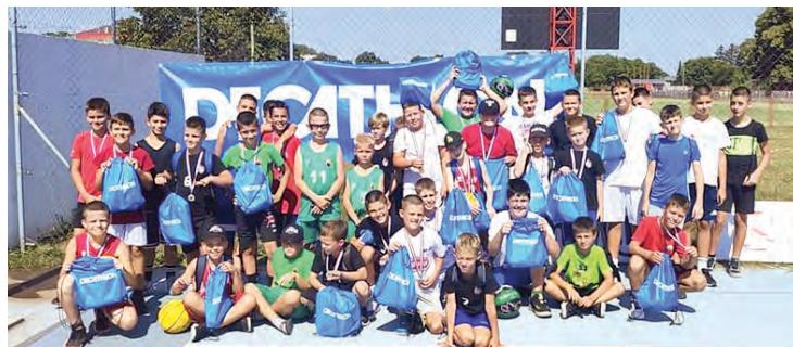
Pobjednici 3x3 turnira za mlade kategorije

Nakon zanimljivih i neizvjesnih basketballa, u kojima je bilo čak produžetaka i koševa u posljednjim sekundama, dobili smo pobjednike i sljedeće plasmane: u