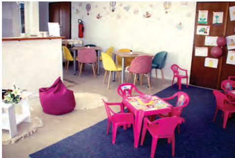
Novi prostor obiluje edukativnim i zabavnim rekvizitima