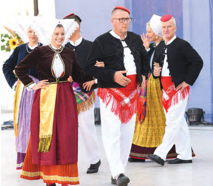
Atraktivan nastup KUD-a Družina s otoka Paga