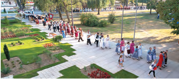
Mimohod folklorša središtem Belišće