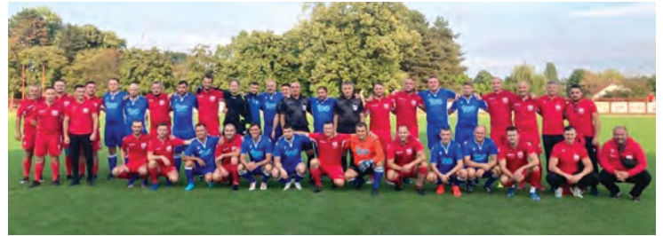
Memorijalnu utakmicu igrali su veterani NK Belišća i NK Jedinstva iz Donjeg Miholjca