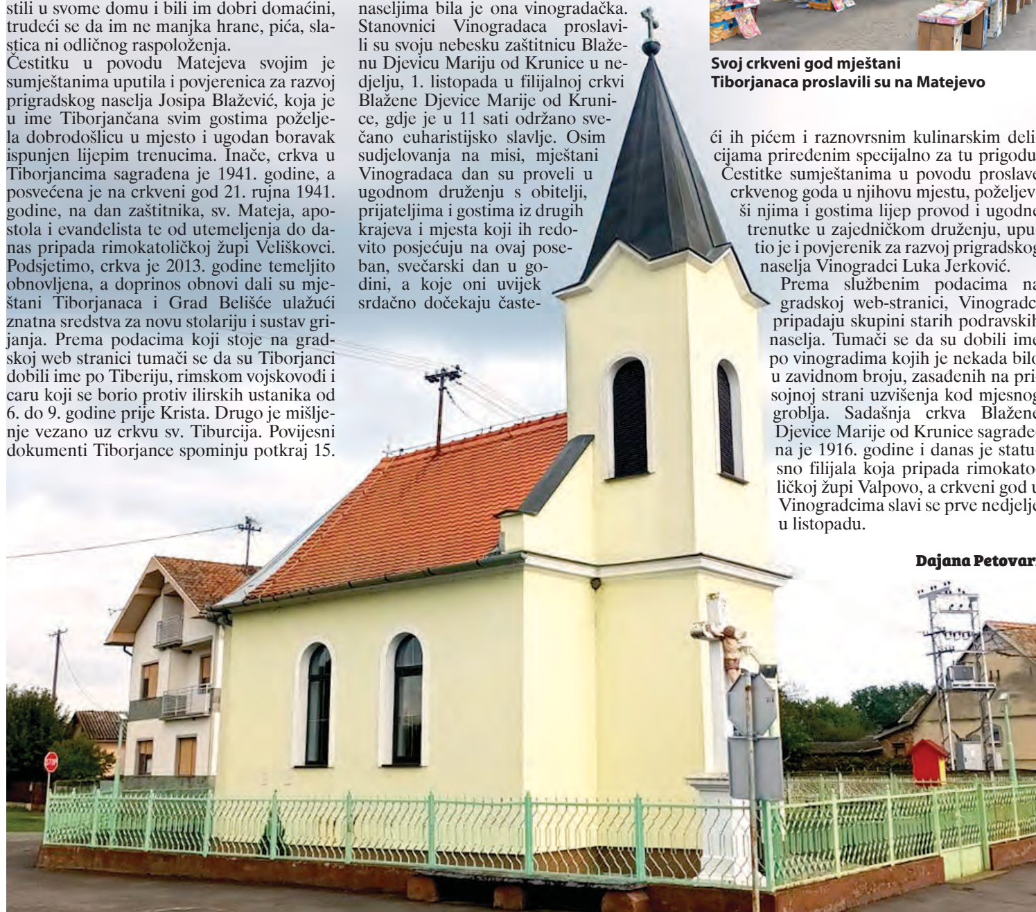
Crkva u Vinogradcima posvećena je Blaženoj Djevici Mariji od Krunice