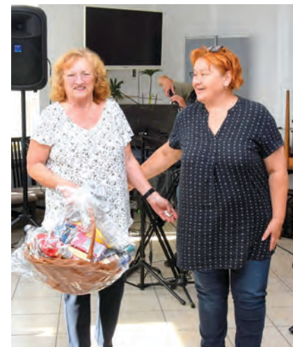
Iz Grada Belišća Matici umirovljenika stigao je i prigodan poklon