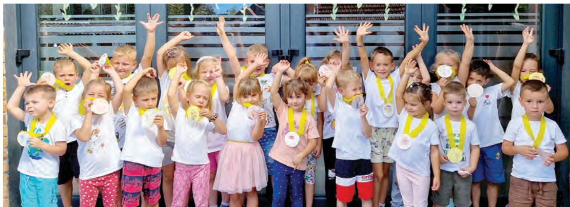
Djeca u Maslačku uživala su u nadmetanjima Olimpijskog dana

H rvatski olimpijski dan, koji se 10. rujna obilježava u spomen na datum utemeljenja Hrvatskog olimpijskog odbora, u Dječjem vrtiću Maslačak Belišće obilježen je u ponedjeljak, 11. rujna. Ovom manifestacijom promiče se olimpijski pokret, a male i velike građane potiče se na bavljenje sportskim aktivnostima. Ujedno se promiču olimpijska načela izvrsnosti u svakom području, razumijevanje, mir i solidarnost među ljudima kao sastavnice olimpijskog djelovanja. Odgojiteljice su s tim u skladu organizirale nekoliko sportskih aktivnosti u kojima su sudjelovala djeca iz sedam vrtićkih i jedne jasličke skupine (Leptirići, Bombončići, Zvezdice, Mravići, Krijesnice, Cicibani, Žabice iz Po-