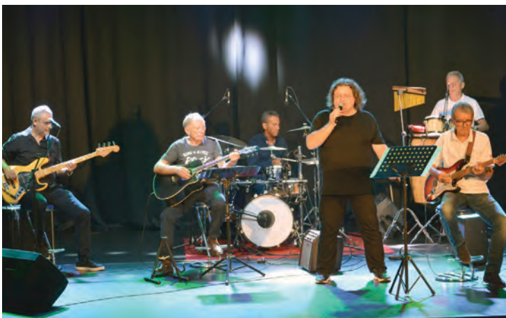
Dijamantni koncert VIS-a Talasi