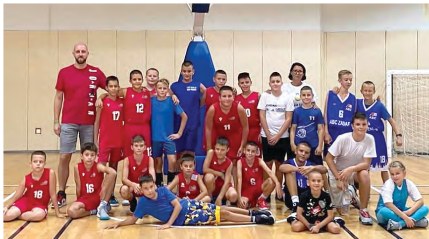
Belišćanski košarkaši stekli su i nova iskustva