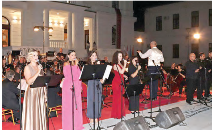
Koncert HNK Osijek s opernim solistima