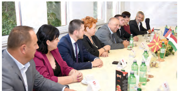
Gradonačelnik Dinko Burić sa suradnicima u gradskoj upravi priredio je svečani prijam