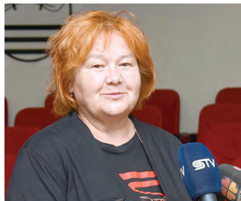
Zamjenica gradonačelnika Ljerka Vučković