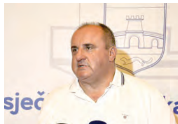
Svečanost potpisivanja ugovora u Županiji

Sredstva koje Županija dodjeljuje za kapitalna ulaganja u sportu ove su godine povećana u povodu Europske regije sporta, a bit će povećana i iduće godine, i to prije svega za izgradnju sportske infrastrukture. Na natječaj su se mogle javiti jedinice lokalne samouprave i klubovi kojima je odobreno ukupno 400.000 eura. Ovo je, naravno, samo jedna u nizu potpora koje čini Osječko-baranjska županija da bi poboljšali sportsku infrastrukturu, unaprijedili kadar u klubovima i promovirali da je OBŽ iduće godine Europska regija sporta. Važni su brojni projekti koje želimo raditi da bi se djeca mogla