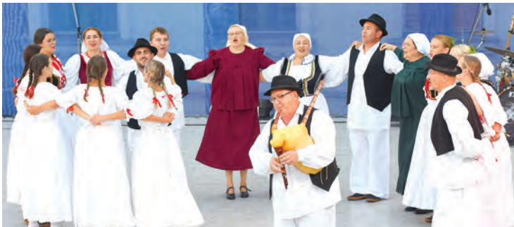
Ples Folklornog ansambla iz Garešnice