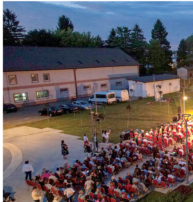
Otvorenje obnovljenog Paleja i trga bilo je središnje

Z a grad Belišće i njegove građane subota 16. rujna i manifestacija "Belišćanska zlatna jesen" ove su godine imale poseban, svečarski karakter s obzirom na to da je toga dana na prigodnoj svečanosti otvorena obnovljena Palača Gutmann - registrirano i zaštićeno kulturno dobro i simbol grada Belišća. Zajedno s Palačom otvorenje je priredeno i za obnovljene pristupne površine uključujući i središnji gradski trg Ante Starčevića, koji je dobio nove, moderne vizure.