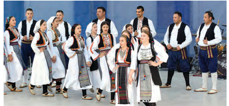
KUD Vionica iz BiH već godinama prijateljuje s Belišćem i Bocanjcima

Trodnevni program 11. Belišćanske zlatne jeseni završen je večernjim koncertom Džentlmena, na čijem su repertoaru bile raznovrsne pjesme, od tamburaških, preko popularnih te onih koje su pri srcu sudionicima ove ružanske manifestacije, a koji dolaze iz nama susjednih zemalja. O tome da su Džentlmeni napravili dobar "štimmung" govore i fotografije na kojima se vidi da su svojom glazbom publiku digli na noge, a prostor između pozornice i tribine bio je premali za sve one koji su se uhvatili u kolo.