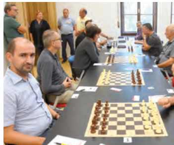
Palača Gutmann pokazala se kao izvrstan prostor za šahovske turnire