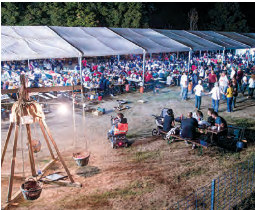
Kulinarski događaj okupio je veliki broj ljubitelja dobre hrane