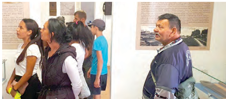
Posjet zaposlenika javnih radova belišćanskom Muzeju

Belišćanski muzej atraktivan je turistima, ali i samim Belišćanima