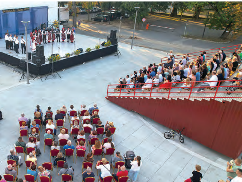
Okupljena publika uživala je u zanimljivim izvedbama