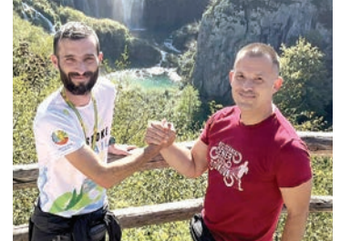
Sklapanje sporazuma između udruga AK Plitvice i SRK Baraber

Sami start i cilj utrke bio je na promeni "Peter Pazmany", a ruta kretanja se protezala kroz prekrasne dijelove Budime i Pešte kao što su Budimski dvorac, Andraševa avenija, Trg heroja, i to sve uz čarobnu obalu rijeke Dunav. Za ugodnu atmosferu tijekom cijele staze pobrinuli su se razni navijači, orkestri i bendovi, volonteri, a okrepa kao i sama organizacija maratona bili su na visokoj razini, poručuju maratonci iz SRK Baraber ne zaboravljajući izraziti zahvalu organizatorima utrke BSI Sport Kft kao i glavnom pokrovitelju ovog velikog sportskog događaja gradonačelniku Budimpešte, Grguru Božiću.