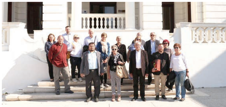
Delegacija kulturnih i gospodarskih predstavnika Velike Kanjiže posjetila je i obnovljeni Palej