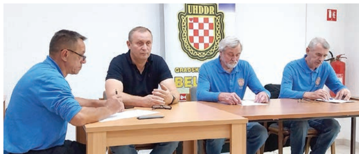
Godišnja skupština UHDDR-a Grada Belišća