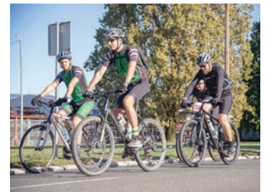
Iz Belišća je utrku vozilo oko 25 biciklista

Put ih je preko Radničke ulice i Ulice kralja Tomislava odveo prema mostu 107. brigade i Baranji, gdje su nastavili biciklizati prema Baranjskom Petrovom Selu i spomeniku palim borcima. Tamo su se nakon okrjepa spojili s rutom koja je krenula iz Belog Manastira, pa su nastavili zajedničku vožnju dalje prema Jagodnjaku, Novom Čemincu, Uglje-