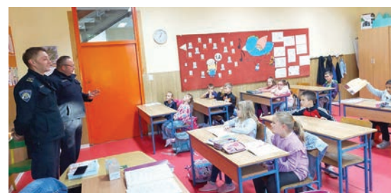
I policija je sudjelovala u programu