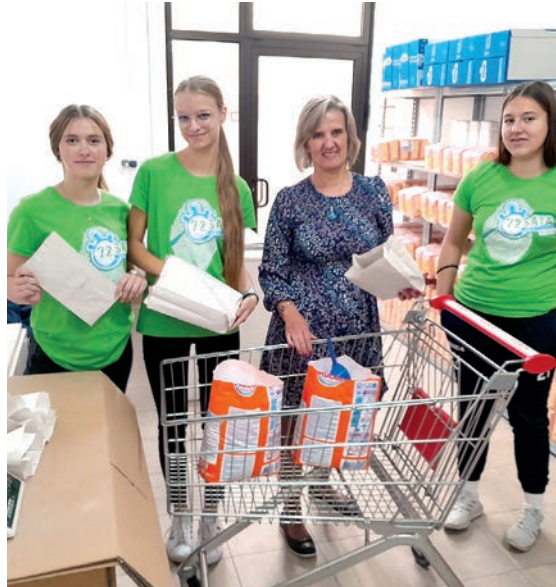
Veliki doprinos mladi su dali i u socijalnoj samoposluzi

Projekt je službeno započeo u četvrtak, 12. listopada, večernjom svetom misom u 18 sati koju je u belišćanskoj župnoj crkvi predslavio fra Mirko Mišković. Nakon mise i klanjanja sudionici su podijeljeni u timove te su dobili zaduženja. U sklopu projekta mlade volonterke i volonteri dali su doprinos potrebitima, društvu i lokalnoj zajednici sudjelujući u brojnim aktivnostima radnog i socijalnog karaktera koje su se provodile u Dječjem vrtiću Maslačak, Inkluzivnoj kući Zvono i stambenoj zajednici, Domu za stare i nemoćne Treća dob, Gradskoj knjižnici i čitaonici Belišće, socijalnoj samoposluzi i Udruzi PUKS. Tako su volonterke u vrtiću boravile u skupinama, pomagale odgojiteljicama u planiranim aktivnostima, igrale se s djecom te su uredile i očistile njihov atrij. U udruzi PUKS pomogle su urediti informarij koji je udruga dobila na korištenje tako što su ga očistile, obojile i pripremile za korištenje, a sudjelovale su i u oblježavanju Svjetskog dana mentalnog zdravlja. Ekipe volontera u Zvonu pograbljala je lišće, okopala travu uz ogradu te se u stambenoj zajednici družila s korisnicima Udruge dok se ekipa volontera u Trećoj