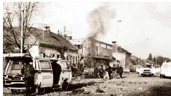
Bio je to najkrvaviji dan u povijesti ovog mjesta