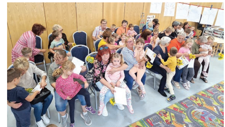
U Gatu su djeca ugostila svoje bake

Djeca i odgojiteljice u Područnom vrtiću u Gatu također su se uključili u aktivnosti Dječjeg tjedna. Tako su, primjerice, u povodu Međunarodnog dana starijih osoba u vrtiću ugostili svoje bake, kojima su izveli prigodan program i darivali ih poklonima koje su izradila uz pomoć odgojiteljica. Gatski mališani ugostili su i prvašice iz Veliškovaca, pa su u druženju i igri saznali kako je to ići u školu.