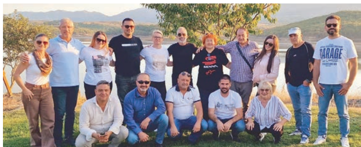
Delegacija Grada Belišća u Makedoniji

- Ove godine dragi prijatelji iz Radoviša organizirali su za svoje goste, gradove prijatelje iz Turske i Hrvatske, posjet predivnim mjestima, čime su nas nastojali približiti svojoj kulturi, tradiciji i turističkoj ponudi, pa smo tako posjetili ženski redovnički samostan iz 11. stoljeća i grkokatolič-