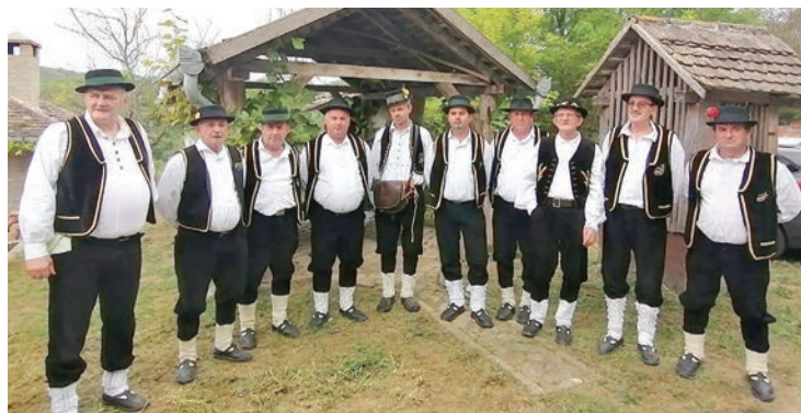
Bocanjevački pajdaši nastupili su u Zadubravljju

stalni prijedlog programa i jedan u partnerstvu za jedno područje financiranja. Rok za podnošenje prijave je do subote, 18. studenoga. Prijave se dostavljaju isključivo na propisanim obrascima, koji su zajedno s uputama za prijavitelje dostupni na mrežnim stranicama Grada Belišća. Prijava se podnosi u elektroničkom obliku sa svom traženom dokumentacijom i skeniranim obrascima, u PDF formatu, na adresu elektroničke pošte: kultura@belisce.hr s nazivom e-maila „Javni poziv za predlaganje javnih potreba u kulturi grada Belišća za 2024. godinu – naziv prijavitelja ili preporučeno poštom u zatvorenoj omotnici, s navedenim nazivom i adresom prijavitelja, na adresu Grada Belišća, Vijenac dr. Franje Tuđmana 1, 31551 Belišće, uz napomenu na omotnici: „NE OTVARATI – „Javni poziv za predlaganje Javnih potreba u kulturi grada Belišća za 2024. godinu“.