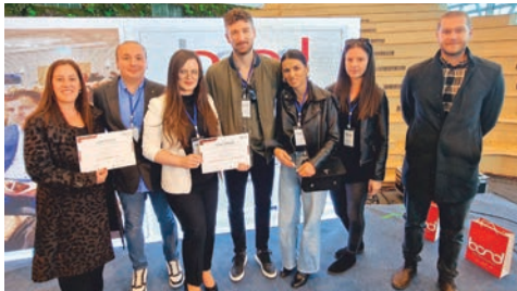
Svečanost dodjele certifikata na završnoj konferenciji

Postoji pet razina certifikata, koji se obnavljaju jednom godišnje prema jasno definiranim kriterijima, a cijeli proces nadgleda i provodi HAMAG-BICRO.