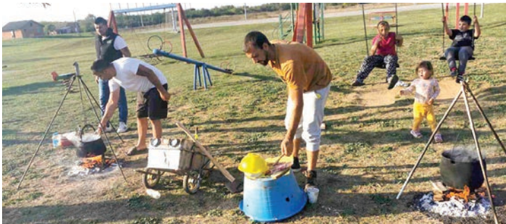
Na Čobanijadi su sudjelovala 23 majstora kotlića