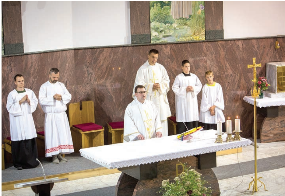
Za blagdan svetog Franje vjernici su se pripremali trodnevnicom