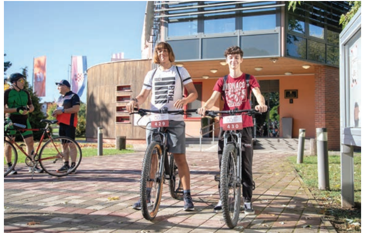
Jedna od ruta utrke krenula je ispred belišćanske gradske uprave

Festival FEBIRE i ove godine obuhvatio i grad Belišće