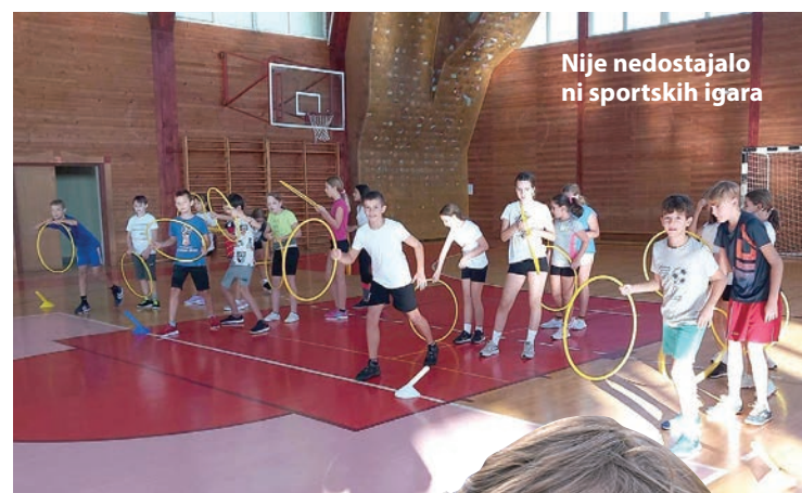
Nije nedostajalo ni sportskih igara