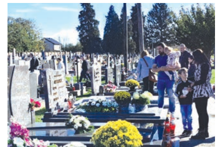
Pijetet prema preminulima usađuje se od najranije dobi