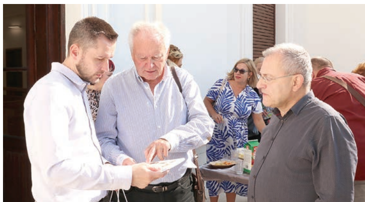
Gosti iz Velike Kanjiže sa zanimanjem su pratili izlaganja domaćina