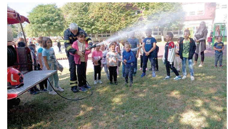
Uzbudljiv susret s vatrogascima