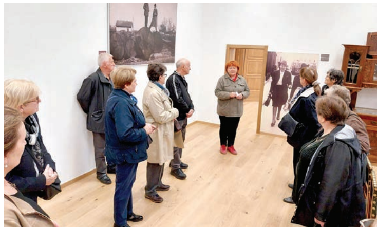
Roditelji poginulih branitelja upoznali su se sa znamenitostima Belišća