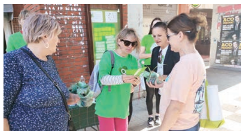
Članice udruge PUKS družile su se građanima

Posljednjih sedam desetljeća diljem svijeta 10. listopada obilježava se kao Svjetski dan mentalnog zdravlja s ciljem podizanja svijesti o mentalnom zdravlju. Kako u djelovanju udruge PUKS važnost zaštite i promicanja mentalnog zdravlja ima visoko mjesto, što se može primijetiti i u njihovim aktivnostima, članice ove udruge odabrale su mjesec listopad za provođenje niza aktivnosti.