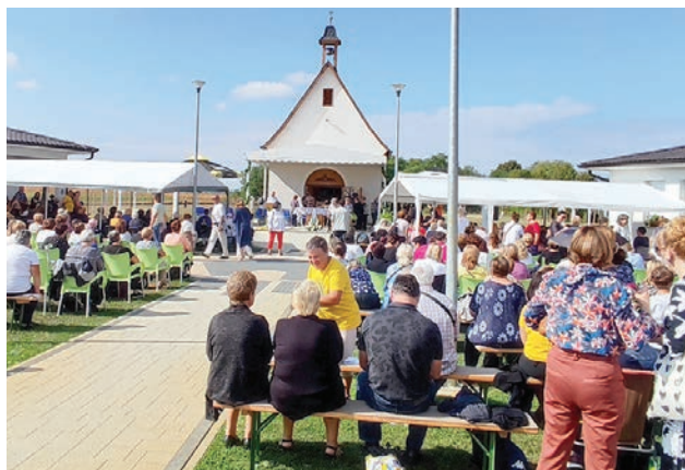
U Hrvatskoj su izgrađena dva originalna schönstattska svetišta: u Maloj Subotici i Ivanovcima