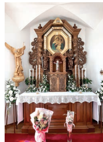
Svetište u Ivanovcima