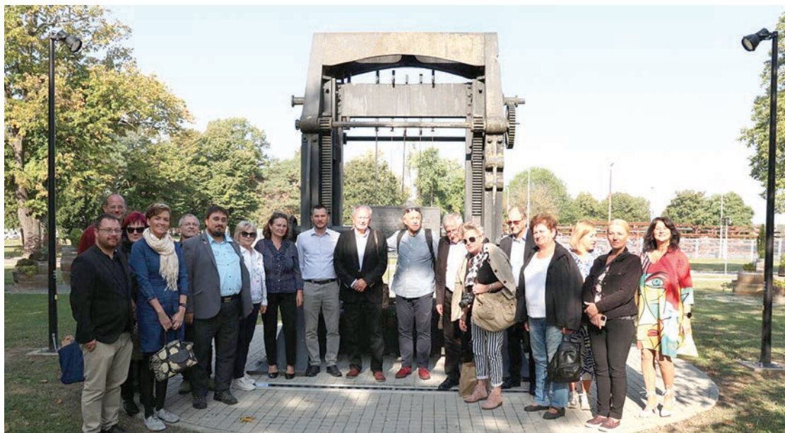
Povijesna saznanja bila su neiscrpna tema razgovora

ška Paleja, prigodne izložbe slika akademskog slikara Tonija Franočića te razgledavanja namještaja iz vremena Gutmannovih iz stalnog postava našeg muzeja. Također, članovi delegacije izrazili su želju posjetiti gradsko groblje i počivalište roditelja proslavljenog kompozitora Sigmunda Romberga.