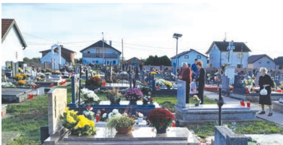
Na groblju u Bistrincima