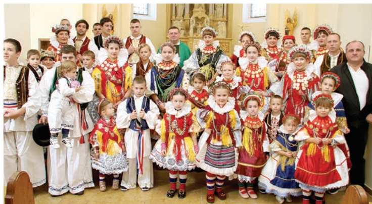
Članovi KUD-a Bizovac na misu zahvalnicu stigli su u svečanim nošnjama