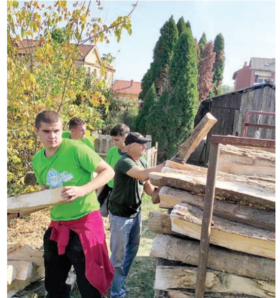
Starijim sugrađanima pomagali su unositi drva za ogrjev