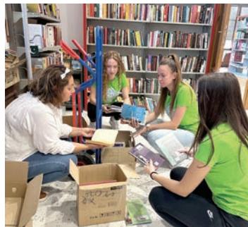
Dobrodošla pomoć bila je i u knjižnici