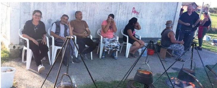
Ugodno druženje bilo je važnije od natjecanja