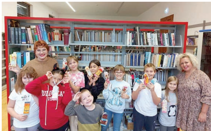
Radionica izrade drvenih straničnika