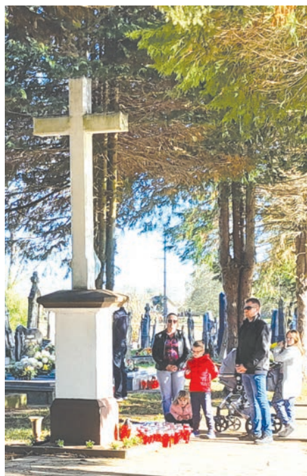
Građani su se rado zaustavljali i u molitvi pred središnjem križem u Veliškovicima