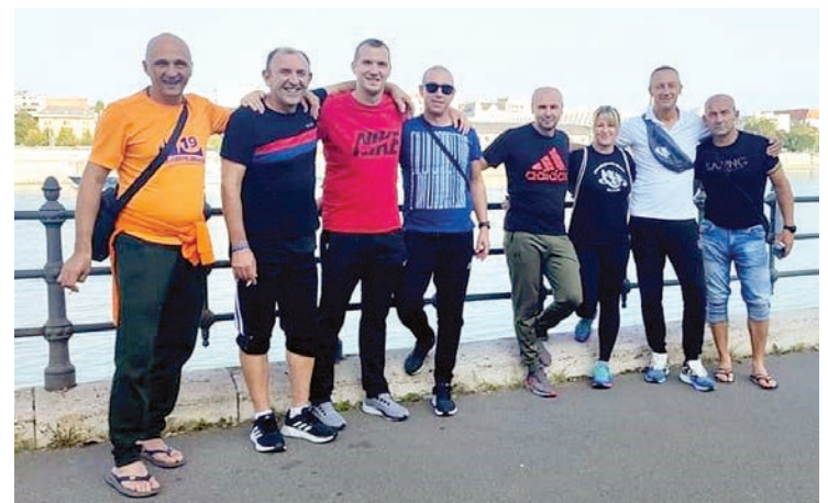
Belišćanski maratonci na 38. Spar Budapest Marathonu