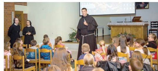
Ove godine župnoj zajednici predstavljene su Kćeri Družbe milosrđa svetog Franje