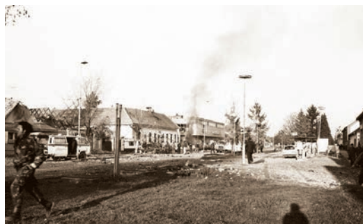
Prizori središta Bizovca nakon raketiranja