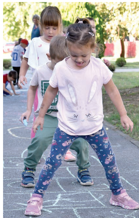
Prilike za igru i druženje bilo je napretek