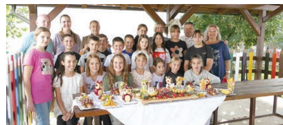
Djeca u Vinogradcima istinski su uživala