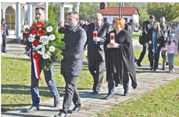
Delegacija Grada Belišća odala je počast pokojnima