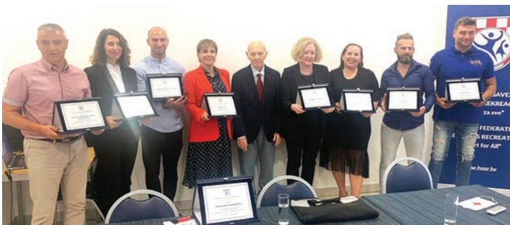
Dobitnici nagrada Hrvatskog saveza sportske rekreacije "Sport za sve"