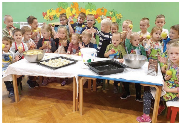
Mališani su uživali u novim aktivnostima