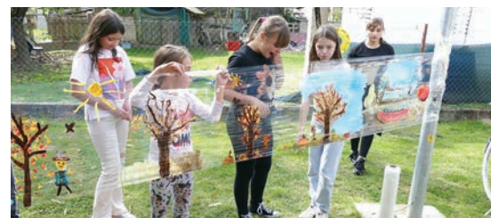
Zanimljive aktivnosti osmišljene su i u Vinogradcima