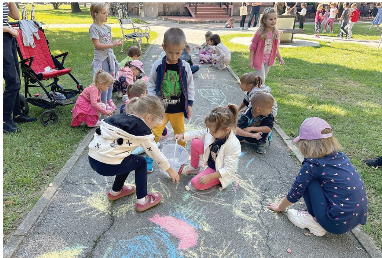
Crtanje kredama neizostavan je dio Dječjeg tjedna