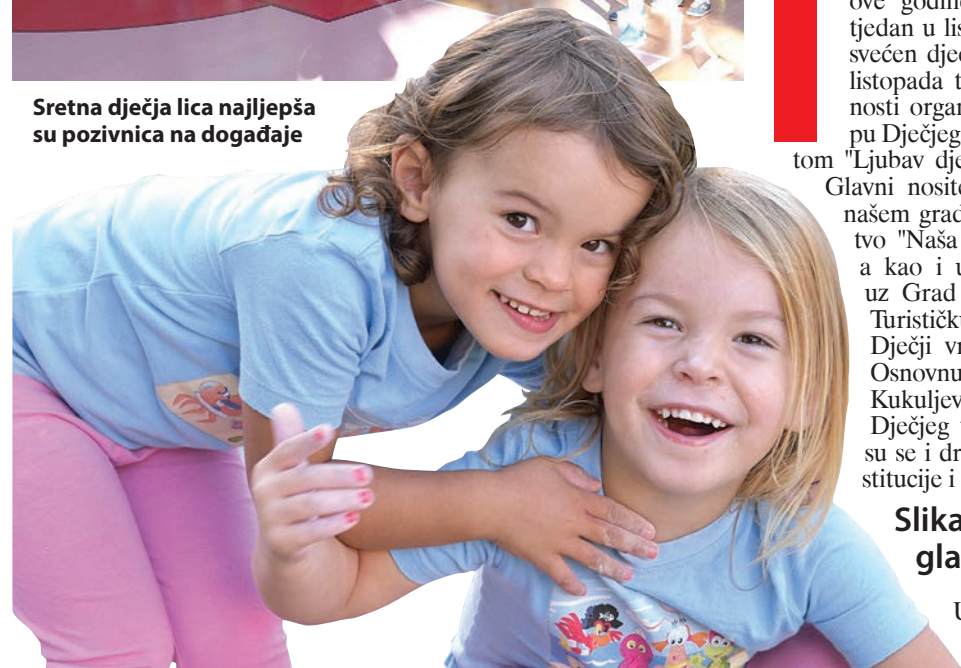
Sretna dječja lica najljepša su pozivnica na događaje