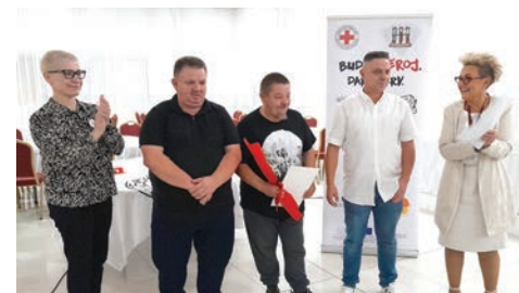
Darovatelji krvi s područja Grada Belišća i ove godine spasili su brojne živote