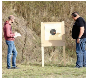
Belišćanski strijelci opet su zabilježili odlične rezultate

- Kada se prisjetimo Bele, kako smo ga svi zvali, treba reći da je bio jedan od najstarijih i najak-