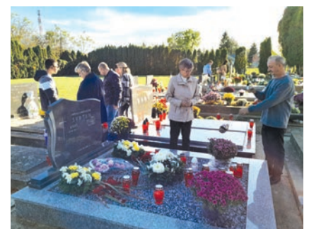
I groblje u Gatu bilo je prigodno uređeno i okićeno