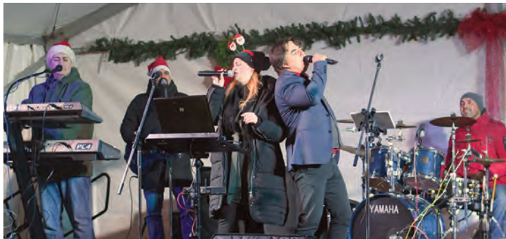
Silver Bend pružio je pravu glazbenu poslasticu