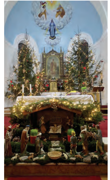
Crkva u Veliškovcima u božićnom ruhu