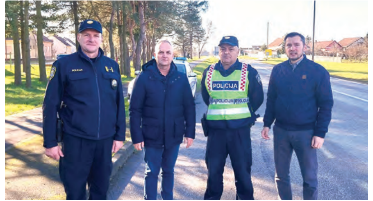
Tradicionalne aktivnosti Vijeća za prevenciju na Štefanje

Tradicionalne aktivnosti Vijeća za prevenciju Grada Belišća