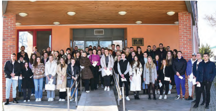
Ugovore je potpisalo 85 studenata s područja Grada Belišća

- U akademskoj 2023./2024. godini Grad Belišće će stipendirati 85 studenata. Najuspješnijih 20 studenata ostvarilo je pravo na stipendiju od 159 eura mjesečno, njih 29 dobivat će 106 eura mjesečno, a 66 eura dobivat će 36 studenata s područja Belišća i prigradskih naselja, za što će Grad plaćati 8630 eura mjesečno