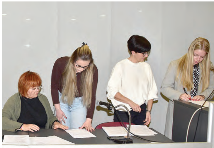
Svaki student dobiva stipendiju prema uspjehu koji postiže

tijekom akademske godine - izvijestila je zamjenica Vučković.