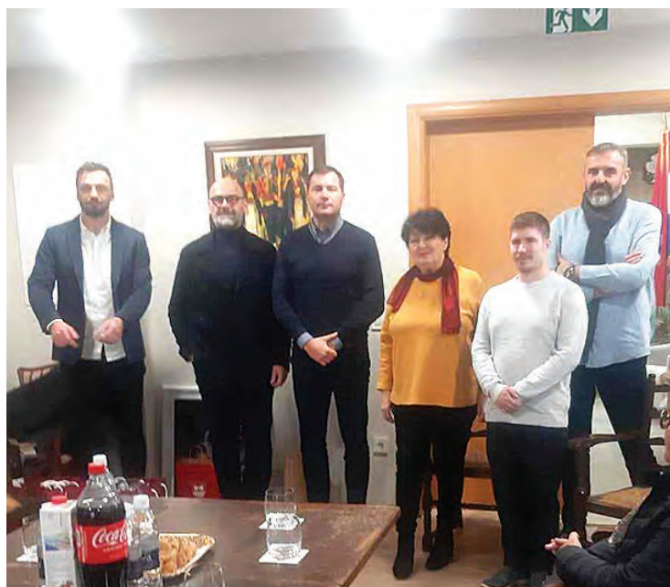
Slavonsko-baranjska delegacija na prijemu u Konavlima