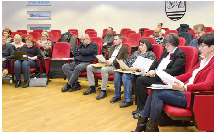
Vijećnici su jednoglasno izglasali rebalans proračuna za 2023. godinu