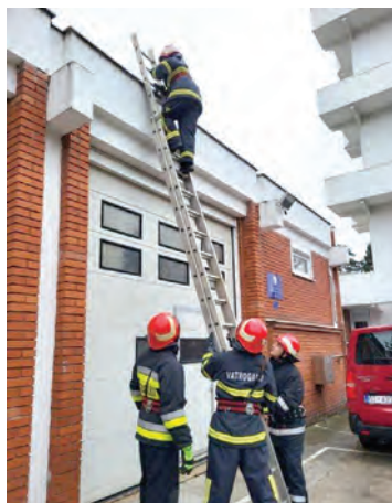
Dio obuke za vatrogasce

U organizaciji Vatrogasne zajednice grada Belišća obavljeno je osposobljavanje za vatrogasna zvanja vatrogasac i vatrogasac I. klase, gdje su bili uključeni i kandidati s područja VZO Bizovac, Marijanci, Osijek i Viljevo. Osposobljavanje je trajalo od 17.