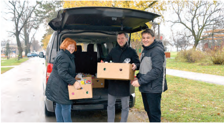
Paketi za 12 obitelji u potrebi