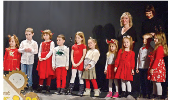
Led su probili Bombončići