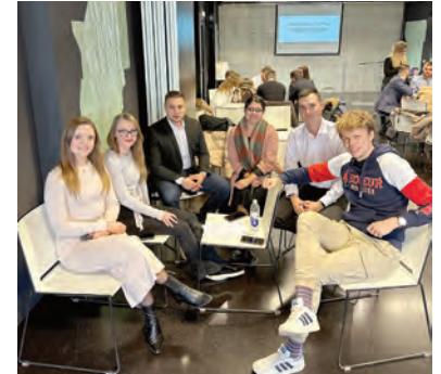
Tema Kongresa bila je: Kako zadržati mlade u lokalnoj zajednici?