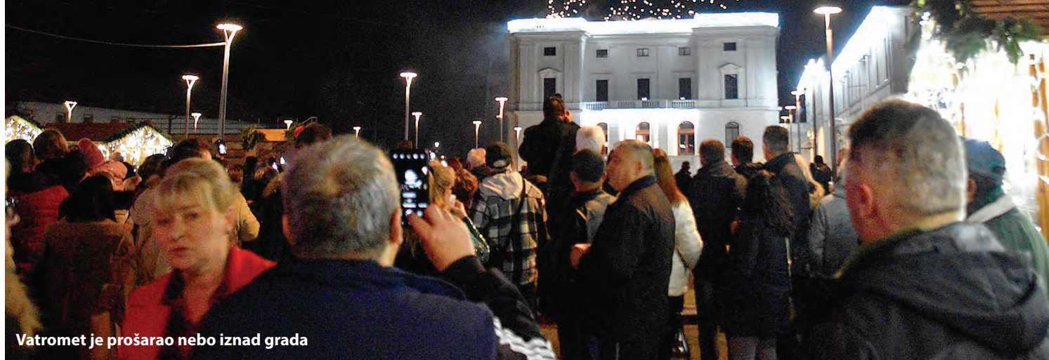
Vatromet je prošarao nebo iznad grada

Doček Nove uz Ceciliju i grupu Pozitiv, kobasice, čaj, kuhano vino i šampanjac