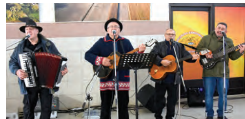
Tamburaški sastav Pax bio je zadužen za dobru zabavu