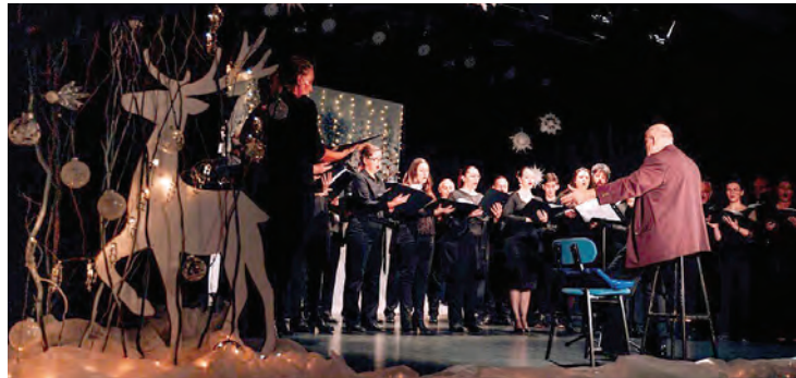
Zbor Opere HNK Osijek izveo je božićni program