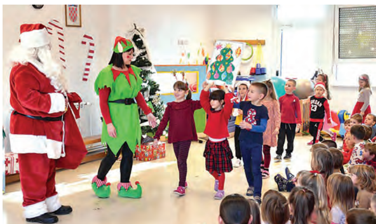
Božićna priredba vrtićaraca