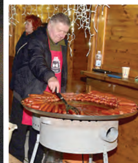
Kotličari su pripremali kobasice