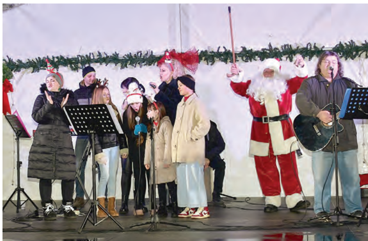
Božićni program Amaterskog kazališta

Božićni program glazbene sekcije Amaterskog kazališta Belišće nije, za razliku od 2022. godine, održan u Centru za kulturu Sigmund Romberg, već je u subotu, 23. prosinca održan na zimskoj pozornici u središtu grada. Nakon paljenja četvrte svijeće na adventskom vijencu i proglašenja pobjednika Potrage za blagom, događanja u sklopu Adventa u Belišću nastavljena su kreativnom radionicom na otvorenom koju je organizirala Gradska knjižnica i čitaonica Belišće, a na kojoj su se izradivale božićne čestitke te božićnim programom koji je vodila Katarina Bošnjak. Prigodnim pje-