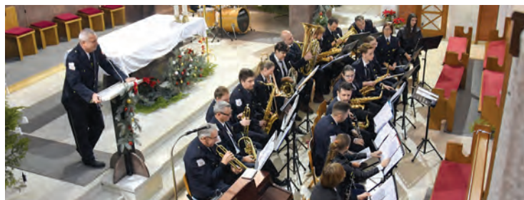
Božićni koncert Puhačkog orkestra DVD-a Valpovo u belišćanskoj crkvi