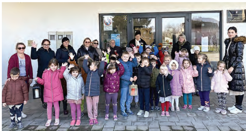
Betlehemske svjetlo zasjalo je i u Gat