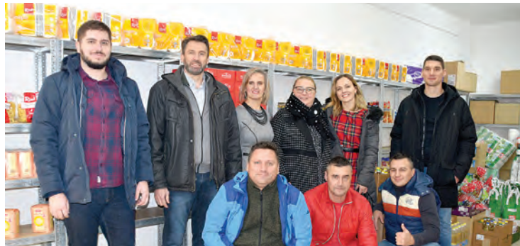
Vrijedna donacija Socijalnoj samoposluzi radnika HF-a i SMH-a