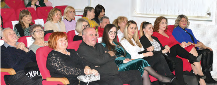
Čestitke vrtiću slavjeniku stizale su sa svih strana