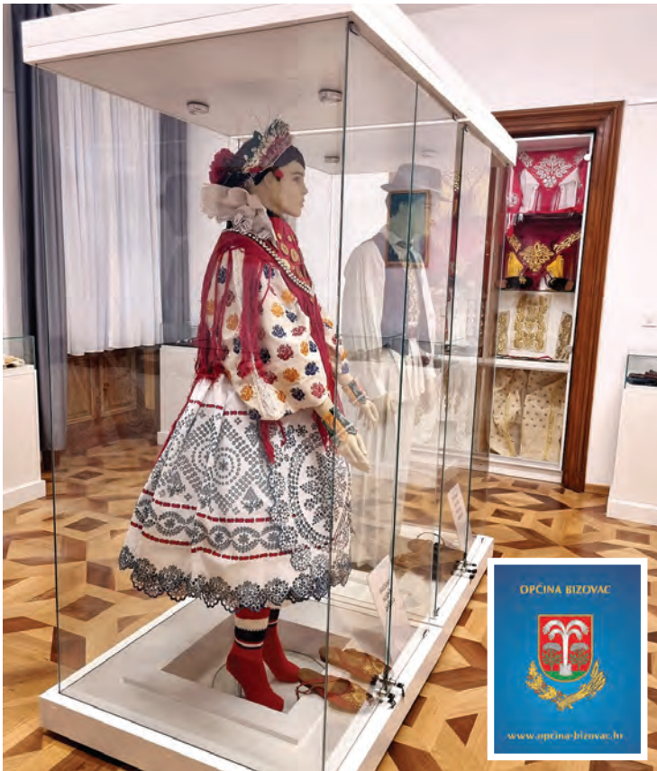
Etnografska izložba Bizovačko blago