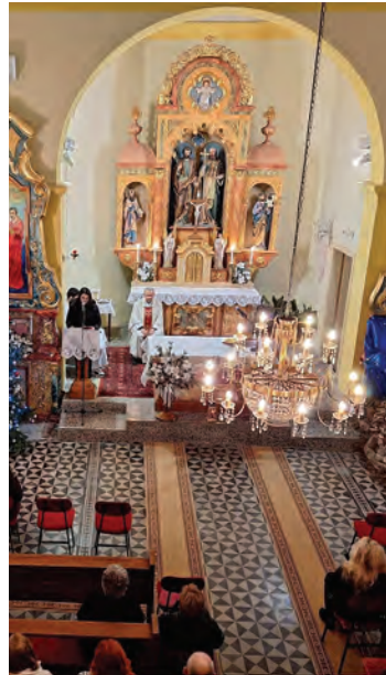
Misno slavlje na Božić u crkvi u Bocanjecima

Adventsko vrijeme iščekivanja nije bilo ništa manje dostojanstveno i svečano u našim prigradskim naseljima, odnosno crkvama koja pripadaju Župi svetog Roka Veliškovci, Župi svetih Filipa i Jakova Bocanjevci te filijalnoj crkvi valpovačke župe u Vinogradcima. Nakon misa zornica i u tim su crkvama vjernici radosno dočekali Božić i blagdane koji su slijedili do kraja prosinca. Na samom kraju 2023. godine nije izostala misa zahvalnica na Silvestrovo te proslava blagdana Marije Bogorodice na samom početku 2024. godine.