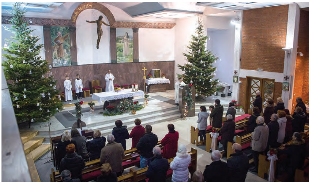
Božićna misa u belišćanskoj župnoj crkvi