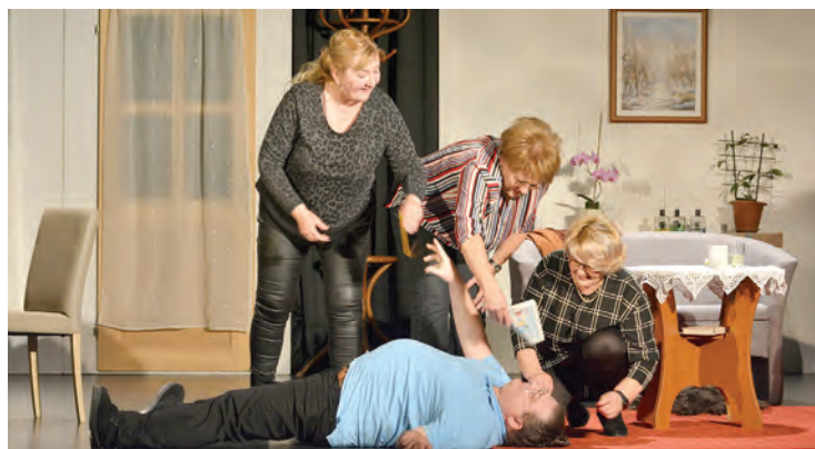
Predstava Digitalno doba nasmijala je publiku