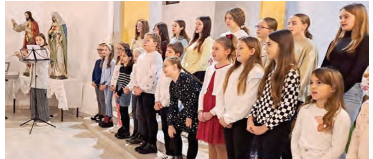
Nastup Dječjeg zbora iz Garčina