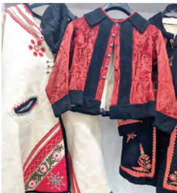
Dio očuvanog starog ruva na izložbi

Ullrich“ smještene u kuriji Normann, otvorena je etnografska izložba pod nazivom „Bizovačko blago“. U šest velikih samostojećih staklenih vitrina na lutkama su izložene originalne jako stare tradicionalne muške i ženske bizovačke narodne nošnje, a pod 25 staklom zaštićenih okvira na uvid javnosti autori izložbe Marija Snježana Glavaš i Radomir Brkić postavili su brojne dijelove dobro očuvanoga staroga ruva. Početkom službenog dijela svečanosti otvorenja o izložbi je govorio općinski načelnik Srećko Vuković, nakon kojeg su se skupu obratili i sami priređivači ove izuzetno vrijedne etnoizložbe, od koje će dio postava ostati i trajno izložen za javnost. S nekoliko melodija izvedenih na bisernici ovaj događaj uveličao je i mladi bizovački glazbenik Ivan Deak.