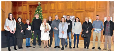
Izložba LU Bel-art Boje zime