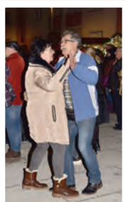
Uz taktove valcera