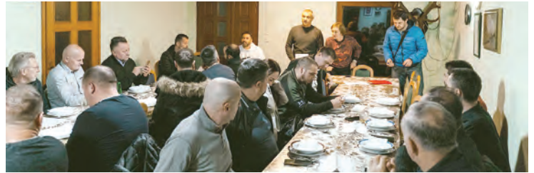
Skupština ZŠU grada Belišća održana je u Tiborjancima

Održana redovna skupština Zajednice športskih udruga grada Belišća