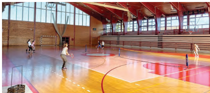
Teniski klub Belišće s projektom Tenis za sve dobitnik je Konzumova natječaja

„Povjerenstvo koje čine predstavnici Konzuma, pojačano stručnim sportskim znanjem našeg proslavljenog vaterpolista Josipa Vrljića, odabralo je dvanaest projekata koji su ne samo zadovoljili tražene uvjete nego su se kroz svoje sportske inicijative istaknuli u odnosu prema drugim prijaviteljima. Njihovu realizaciju Konzum će podržati ukupnim fondom od 50.000 eura koji se prvi put dodjeljuju kroz natječaj