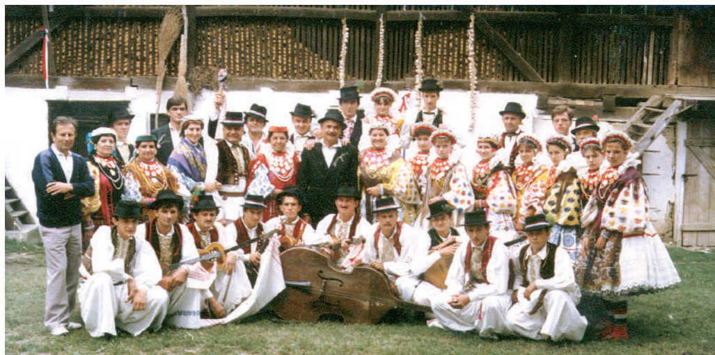
Članovi KUD-a "Mladost" Bizovac s Fabijanom Šovagovićem u filmu "Sokol ga nije volio"