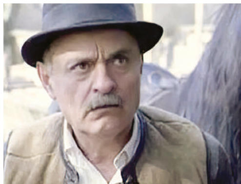
Fabijan Šovagović u filmu "Sokol ga nije volio"