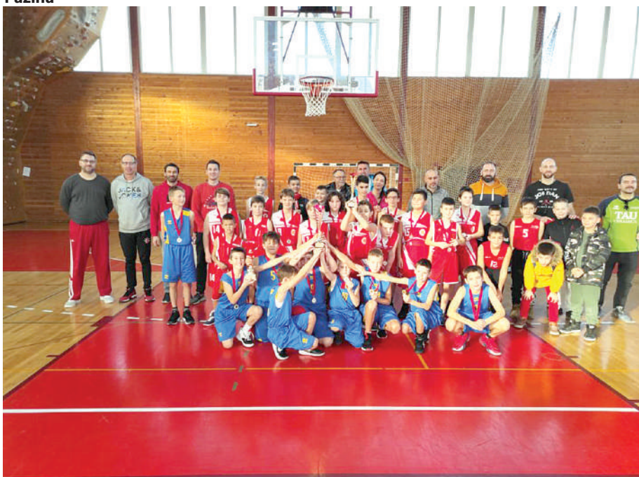
Ekipe domaćina i pobjednici turnira slavili su zajedno