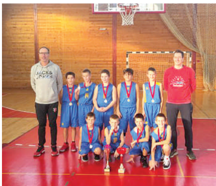
Najbolji na turniru bili su mladi košarkaši Pazina