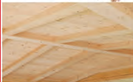
JELOVA GRAĐA - hoblana, prosušena