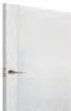
VRATA SOBNA 70/205/10