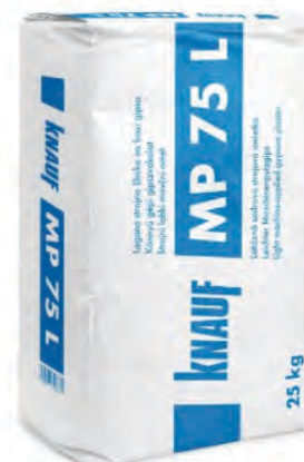
KNAUF ŽBUKA MP 75 25 kg za strujnu ili ručnu primjenu