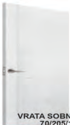
VRATA SOBNA 70/205/10