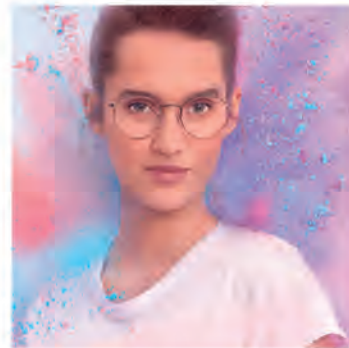
Crizal. Sapphire™ HR

Blue UV Capture je potpuno prozirna, prva integrirana zaštita protiv štetnog svjetla u materijalu leće. Nalazi se unutar materijala leće. Štiti oko od štetne plave svjetlosti 3x više od standardne recepturne leće. Blokira UV zrake na prednjoj površini leće, a na stražnjoj u kombinaciji s Crizal slojem.