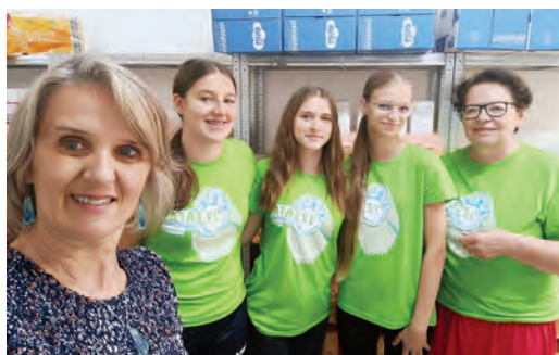
Akcija "72 sata bez kompromisa"