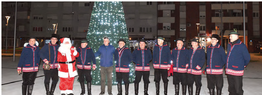
Bocanjevački pajdaši u 2023. godini zabilježili su 29 nastupa