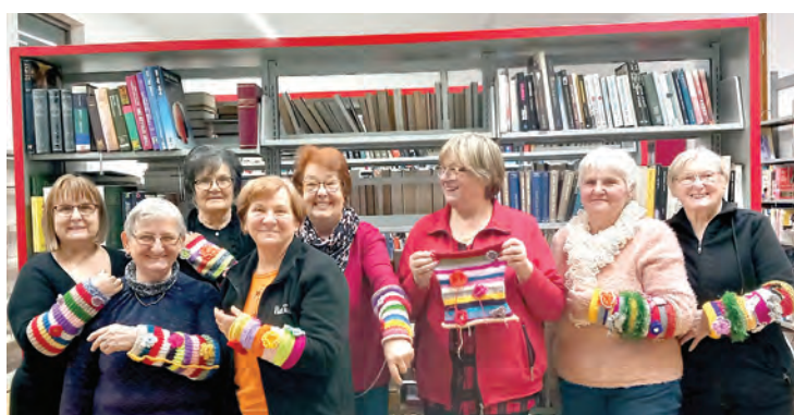
Belišćanske Zlatne ruke vrijedne su i ovoj godini