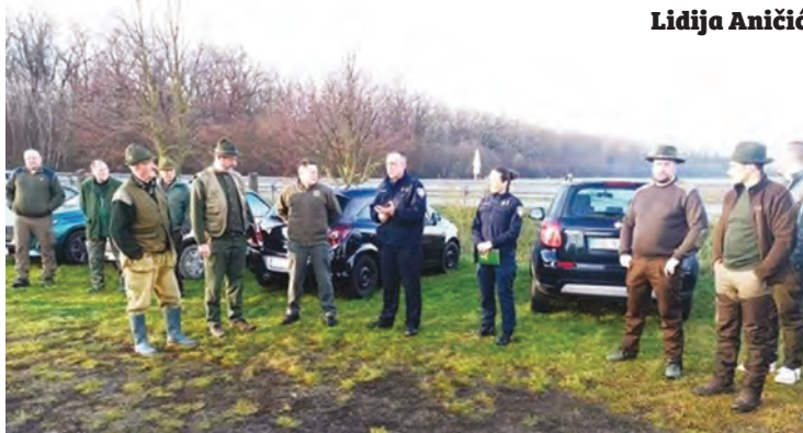
– Edukacija je održana i u LD-u Belišće