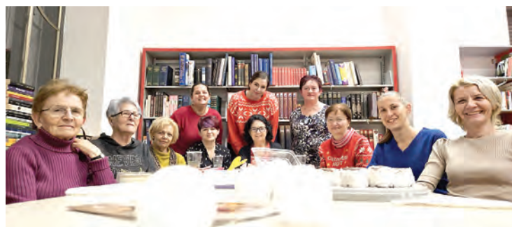
Proslava rođendana Belišćanskog čitateljskog kluba