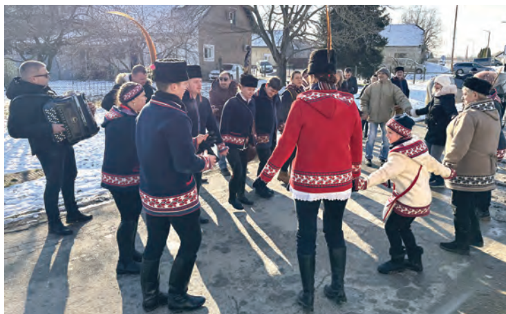
Nema zabave bez šokačkog kola