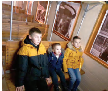
Spomen-vlak ostaje najveća atrakcija