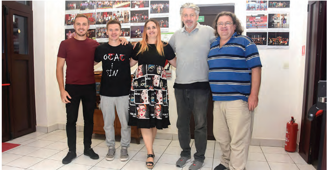
Glumci hit-predstave "Ocat i sin" s djelatnicima CK Sigmund Romberg

Svežinu u vruće srpanjske dane na gradskom bazenu Belišće donio je održani zabavno-glazbeni program "Summer Chill Out", a sredina rujna bila je u znaku stand-up showa "Dobra večer, došao sam po vašu kćer" popularnog Kerekesh Teatra. Humor, smijeh i oduševljenje ponovo su