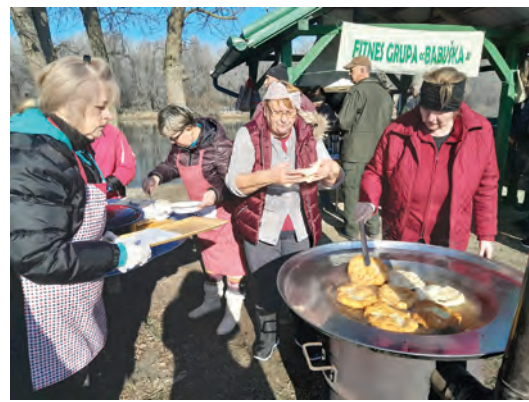
Babuške su se pobrinule za odličnu gastroponudu