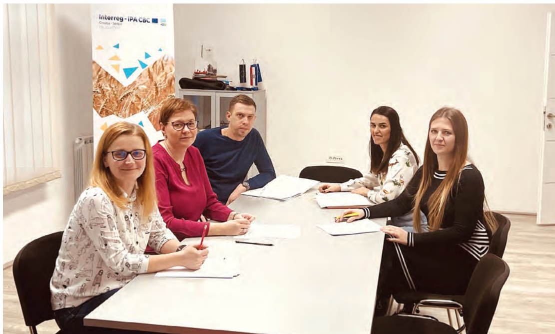
Tim LRA Grada Belišća i u prošloj je godini radio na brojnim projektima

Pružali su i potporu u provedbi projekata na području grada poput Projekta „List do lista, industrijska baština Belišća“ u kojem je Grad Belišće proveo rekonstrukciju najvažnijeg objekta industrijske baštine u gradu Belišću, zaštićenog kulturnog dobra,