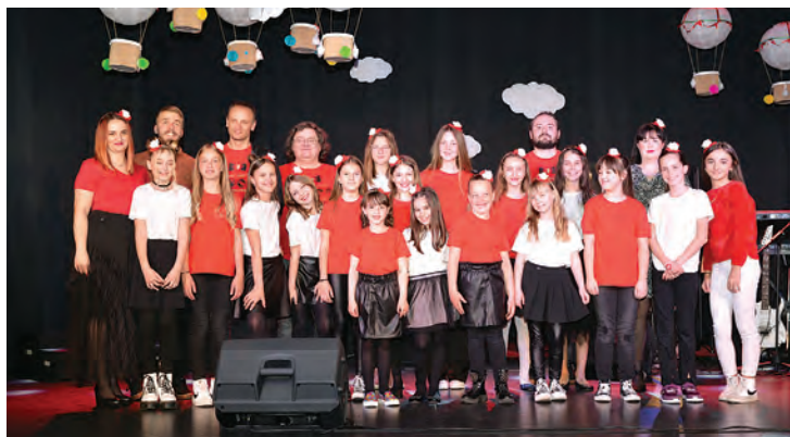
Dječji koncert u povodu Dana grada

Najvažnija događanja koja su u planu za 2024. godinu su 44. Belišćanski dramski memorijal, Dječji koncert u povodu Dana grada Belišća, Belišćanski dječji festival "Vedrofon", Mjesec komedije i 47. Rombergove glazbene večeri.