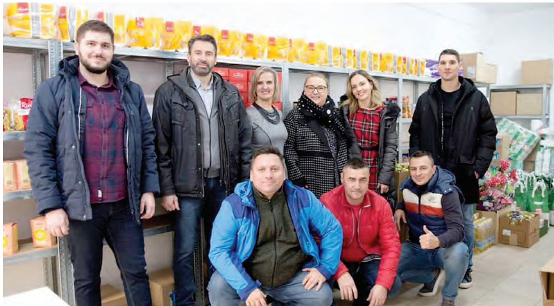
Donacija zaposlenika HF Belišće svake godine

Izdvajajući događanja u prošloj godini, voditeljica Kupanovac ističe i lijepe primjere tvrtke "Plejada" d.o.o. iz Belišća koja se odazivala na svaki upit za pomoć i donaciju Socijalnoj sa-