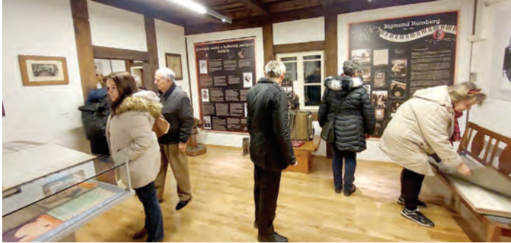
Belišćani su uživali u izloženim muzejskim postavima