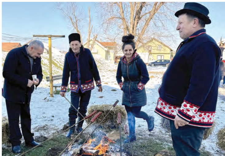
Kobasice pečene na vatri posebno su ukusne