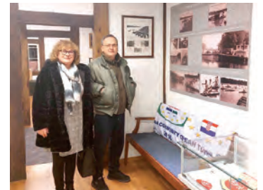
Na svakoj od četiri lokacije posjetitelji su zastajali