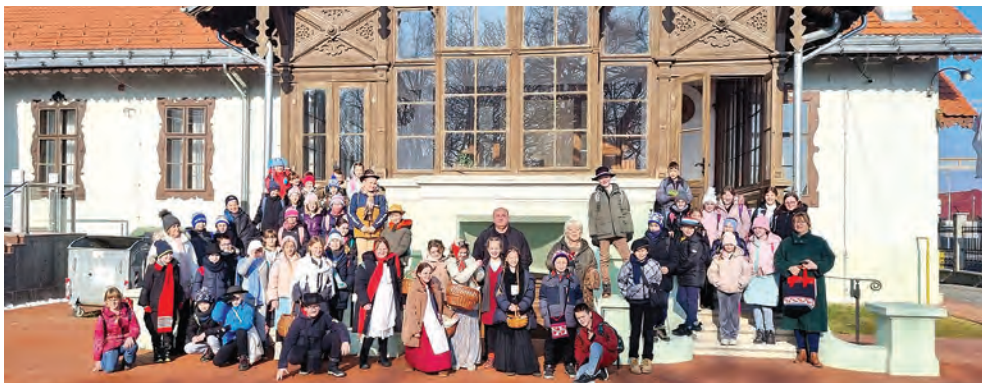
Višnjevački osnovci u posjetu kuriji Normann