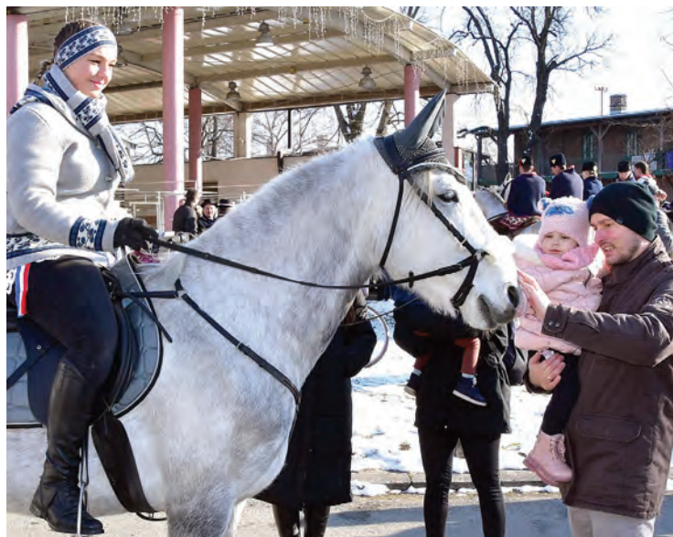
Konji su posebno stpljivi pri susretu s najmlađima