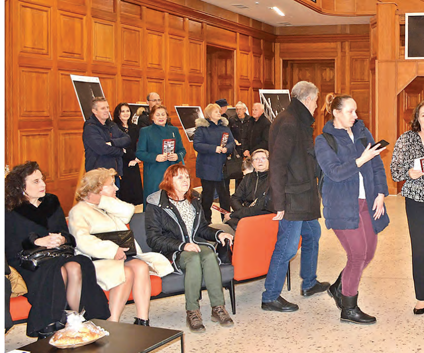
Svečanost otvorenja Belišćanske muzejske noći