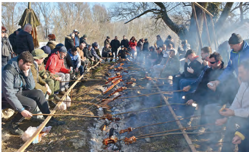
Vještine u pečenju slanine odmjeravalo je četrdesetak natjecatelja