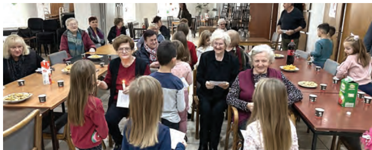
Belišćanski umirovljenici bili su vrlo aktivni