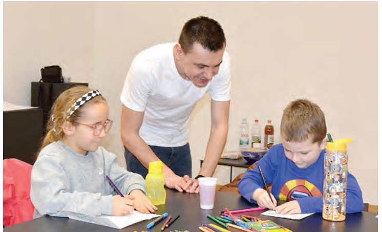
Radionica izrade čestitki s motivom Paleja za djecu