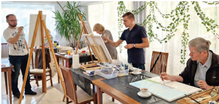
Likovnim radionicama Belartovci su otvorili aktivnosti u 2024. godini

N ema predaha za belišćanske likovne umjetnike. Nakon zimске stanke od subote, 13. siječnja, nastavljene su slikarske radionice u Likovnoj udruzi Bel-art. Ove kreativne likovne radionice namijenjene su djeci osnovnoškolskog uzrasta na kojima se polaznici upoznaju s različitim likovnim tehnikama (olovka, drvene bojice, flomasteri, kolaž, kombinirana tehnika, akvarel, akril...). Rad se odvija jednom tjedno, subotom s početkom u 10 sati, a radionice traju 45 minuta. Radionice za cilj imaju intenzivan razvoj kreativnih sposobnosti i potencijala, usvajanja različitih likovnih tehnika, kvalitetnog provođenja slobodnog vremena, te učenja o svijetu likovne umjet-