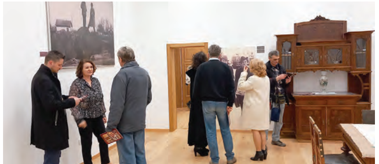
"Muzejska večer nad gradom" odvijala se i u prostoru Paleja