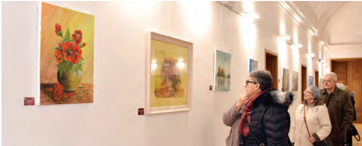
Članovi Bel-arta impresionirali su svojim djelima