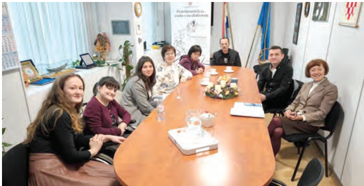
Članovi Zvona kod pravobraniteljice za osobe s invaliditetom

ti jedinstvene rukotvorine i ukrase koje si izradili maštoviti članovi Zvona, te među njima pronaći i kupiti i savršen poklon ili božićnu dekoraciju za svoje najmilije, podržavajući tako i njihove kreatore. Spomenute blagdanske aktivnosti organizirane su u sklopu projekta VirtuOS-uspostava RCK u sektoru turizma i ugostiteljstva, koji je sufinancirao EU iz Europskog socijalnog fonda. Nakon adventskih subota na Citadeli, dio tima IK Zvono, inače