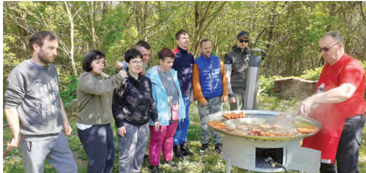
Kotličari su proveli i malu školu kuhanja

bio opsežan posao, jer njihov godišnji plan obuhvaća sudjelovanje na mnogim natjecanjima u kuhanju čobanca, fiš-paprikaša, spravljanju roštilja ili sarme na području Belišća i prigradskih naselja, ali i na području Slavonije, Baranje, juga Hrvatske, pa čak i susjednih država. Osim kulinarskih natjecanja Kotličari su sudjelovali i u društvenim aktivnostima u organizaciji grada Belišća, njegovih institucija i ustanova, te su surađivali s raznim gradskim udrugama. Primjerice, članovi udruge glavni su kuhari u