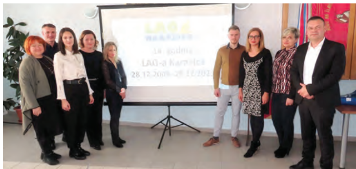
Sudionici sjednice Skupštine LAG-a Karašica

M otiviranje članova i pomaganje prilikom apliciranja na različite natječaje, organiziranje tematskih edukacija za članstvo, volontere i zainteresirane građane kao i sudjelovanje u djelovanju i stručna i materijalna pomoć Lokalnoj akcijskoj grupi u ribarstvu i akvakulturi Pannonia, čiji je LAG jedan od osnivača, središnje su planske odrednice rada LAG-a Karašica za godinu koja je upravo započela, a u kojoj LAG Karašica obilježava svoju 15. godišnjicu rada, najavljeno je na redovnoj sjednici Skupštine LAG-a. Na sjednici koja je održana u