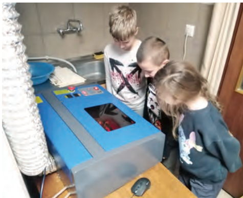
Djeca su uživala u različitim radionicama

Na ovogodišnjem događaju, koji je trajao od utorka, 2. Siječnja, sve do petka, 5. siječnja, sudjelovalo je ukupno 42 djece, učenika iz Valpova, Belišća, Osijeka i Ladimirevaca. Djeca su svoje slobodno vrijeme na zimskim praznicima iskoristila za sudjelovanje u edukativnim i korisnim radionicama Centra tehničke kulture Valpovo-Belišće, koje su trajale pet školskih sati, a kroz koje su, u skladu sa svojim interesima, upoznala „čudesni svijet tehnike“. Riječ je o radionicama modelarstva, fotografije, robotike i elektronike te robotike – lasera, a sve tehničke tvorevine koje su mladi tehničari napravili mogli su ponijeti kući. „Zima u tehnici“ počela je radionicom modelarstva, koju su vodili Bojan Fuderer i Davor Milošević, a na kojoj su polaznici na strojevima Unimat izrađivali modele od šperploče: borove i medvjede. Srijeda, 3. siječnja, bila je rezervirana za radionicu fotografije, koju su vodili Goran Kupčerić i Dragan Francuz, a na kojoj su polaznici fotografirali na zadanu temu i printali fotografije. Slijedila je radionica robotike i elektronike, gdje su voditelji Marijan Antolović i Goran Dojkić polaznike upoznali s robotskim kolicima „mBot“ i načinom njihova programiranja. Posljednji dan „Zime u tehnici“ bio je posvećen radionici robotika – laser, koju su s polaznicima proveli Marijan Antolović i Dragan Francuz.