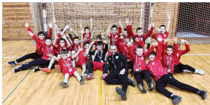
Pobjednička ekipa NK Belišća

Ovaj malonogometni turnir pokazao je visok nivo sportskog znanja među mladim nogometašima, a uzbuđenja i radosti koje su pružili gledateljima svakako će ostati u sjećanju svih koji su bili na „Baraber Cupu 2024.“