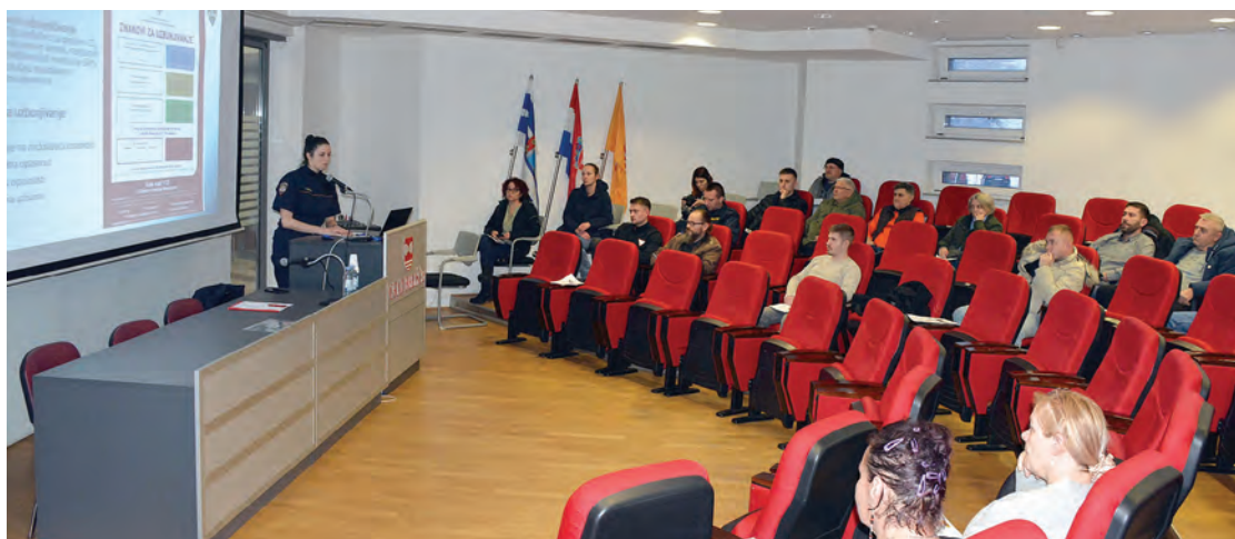
Edukacija Belišćana o sustavu civilne zaštite

Uvijek je dobro podsjetiti da je Civilna zaštita sustav organiziranja sudionika, operativnih snaga i građana za ostvarivanje zaštite i spašavanja ljudi, životinja, materijalnih i kulturnih dobara i okoliša u velikim nesrećama i katastrofama te otklanjanje posljedica terorizma i ratnih razaranja. Posebno u razdoblju od prije nekoliko godina, za vrijeme pandemije, uloga i značenje civilne zaštite imali su veliku važnost u informiranju i zaštiti građana, kao i