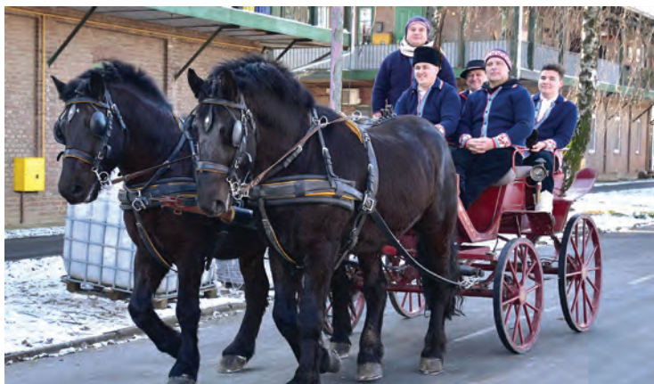
Oduševile su i svečane zaprege