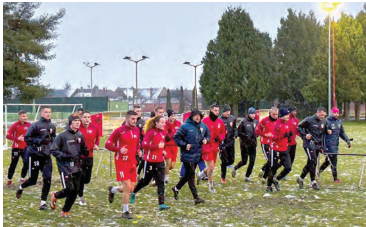
Početak priprema NK Belišće

u sastavu. "Želim zahvaliti igračima koji su odlučili krenuti drugim putem. Sada moramo biti spremni prilagoditi se promjenama i raditi kao jedan."