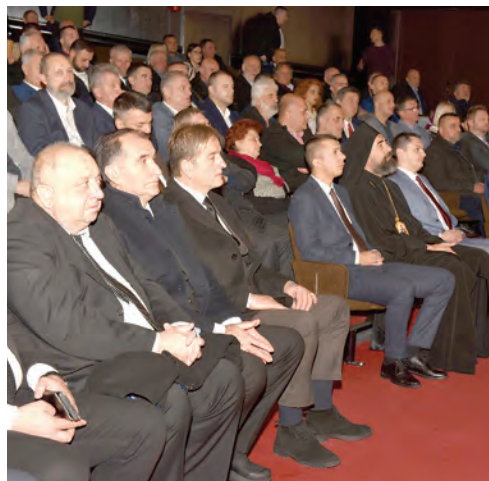
Svečana sjednica u povodu Dana općine Mojkovac