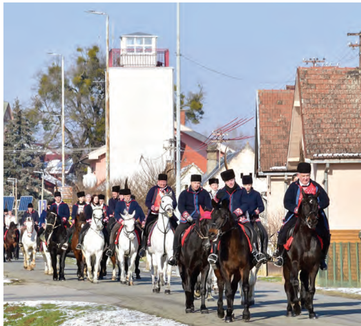
Svečana povorka krenula je iz Bistrinaca prema Belišću