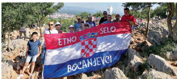
Pjesma i ples Bocanjevčana odjekivali su i izvan hrvatskih granica