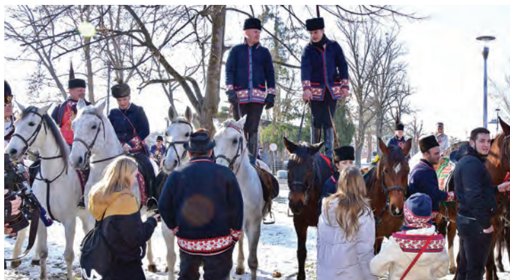
Akrobacije najhrabrijih na konjskim leđima