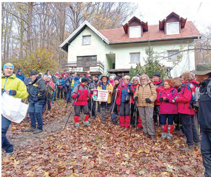
Belišćanski planinari na novom izletu