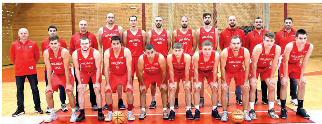
Košarkaški klub Belišće u ovoj godini slavi svoj 50. rođendan