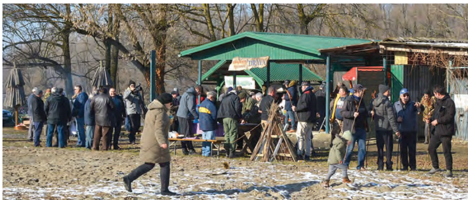
Sunčana zimska subota izmamila je velik broj posjetitelja