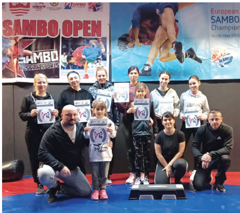
Polaznice tečaja samoobrane za žene

PUKS i Sambo & MMA klub Belišće proveli prvi ovogodišnji tečaj samoobrane za žene