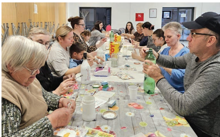
Uskrsna radionica u Gatu