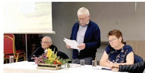
Izvještajna skupština Udruge športskih ribolovaca Podravac