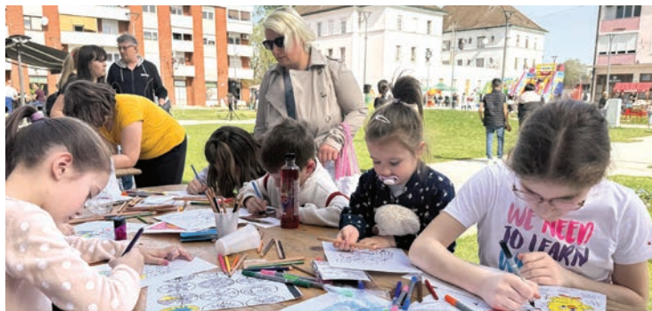
Likovna radionica za djecu na otvorenom