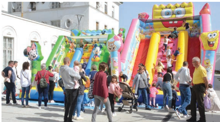
Najmlađi su uživali u raznim atrakcijama