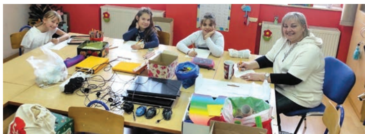
Uskršna radionica u Vinogradcima