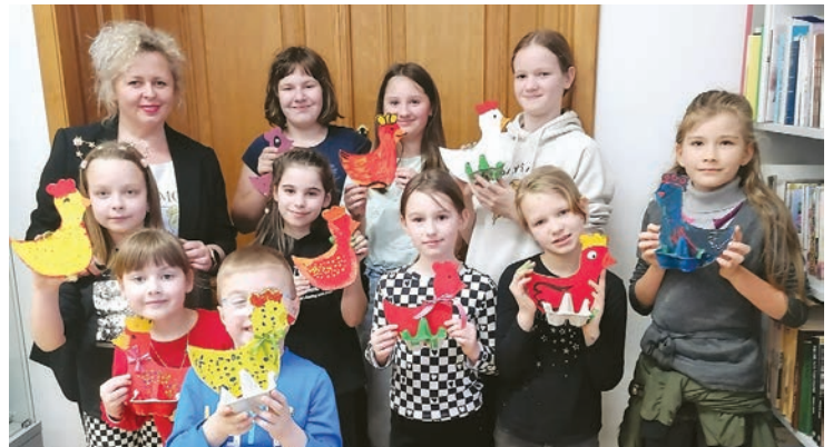
Nova kreativna radionica za djecu