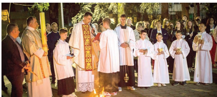
Blagoslov novog ognja i uskrсне svijeće na Veliku subotu