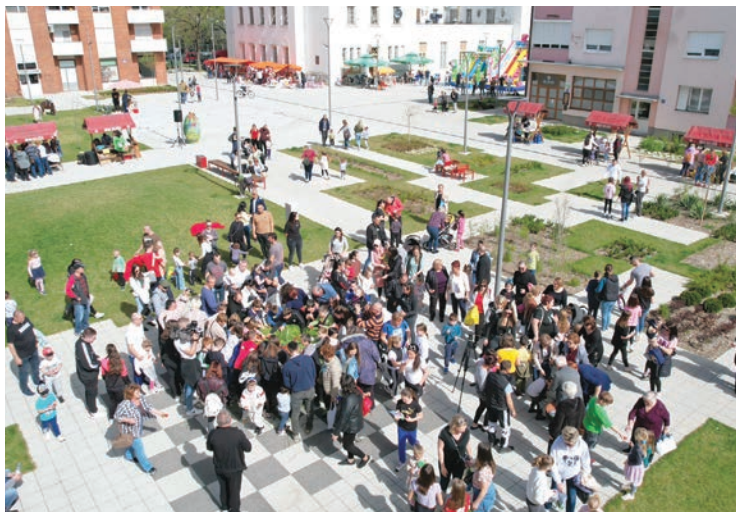
Velika subota na obnovljenom Trgu Ante Starčevića u Belišću