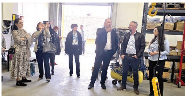
Gosti iz Benkovca posjetili su Poduzetnički inkubator Polet

Zanimljiva su im bila i iskustva u provedbi EU projekata, te su imali priliku vidjeti rezultate projekata Zelene staze Dunava i Drave, List do lista, industrijska baština Be-