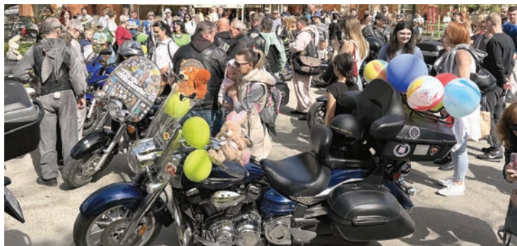
Motozečevi već su postali tradicija na Veliku subotu