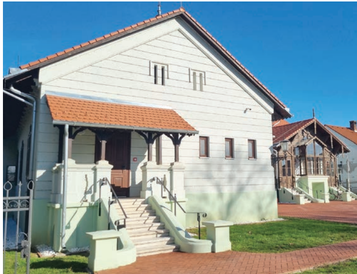
Obnovljena zgrada kurije ponos je cijele općine

- Središte Bizovca zasjalo je novim sjajem nakon što je završena obnova kurije Normann izgrađene 1830. godine. Obnovi se pristupilo s ciljem stvaranja integriranog kulturnog prostora za prezentaciju i interpretaciju kulturne baštine bizovačkog kraja. Provedbom projekta pod nazivom "Čuvarica baštine u srcu Bizovca" revitalizirano je uže središte Bizovca, a osiguranjem adekvatne infrastrukture omogućeno je i organiziranje različitih turističkih, kulturnih, edukativnih i društvenih aktivnosti i stvaranje pretpostavki za omogućavanje rada knjižnice, etnomuzeja i likovne galerije. Zgradu kurije sada koristi Općina Bizovac i ona je zaštićeno kulturno dobro, zbog čega su obnova i uređenje kurije bili istinski ključna investicija za pozicioniranje općine Bizovac kao turističke destinacije istočne Hrvatske - poručuje Vuković.