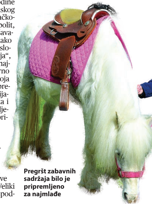
Pregršt zabavnih sadržaja bilo je pripremljeno za najmlađe

Turistička zajednica grada Belišća i Grad Belišće i ove su se godine pobrinuli da u povodu blagdana razvesele svoje najmlađe, ali i sve ostale sugrađane, pa su u program slavljenja Uskrsa u Belišću tradicionalno uključili gradske kulturne ustanove i institucije kao što su Centar za kulturu „Sigmund Romberg“, Matica umirovljenika