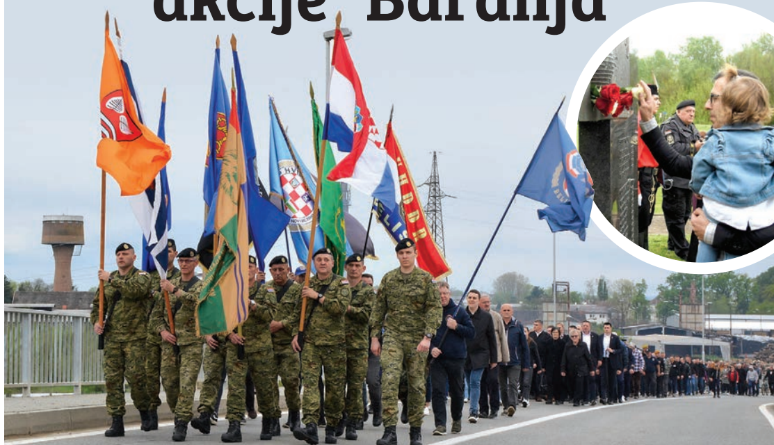
Svečani mimohod krenuo je od mosta 107. brigade u Belišću