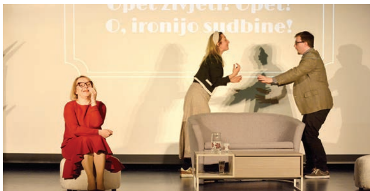
Predstava Čehovljeve livadice prvi put u Belišću

stavljena je u obliku stand-upa. Predstava je pomalo drukčija od onoga što je belišćanska publika dosad imala prilike vidjeti, ali svakako zanimljiva i vrijedi je pogledati. U sat vre-