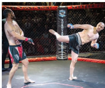
Gledatelji su uživali u 14 odličnih borbi

Svi borci, uz potporu svojih trenera i ljubitelja MMA borbi, te su se subote već u podne okupili na Trgu Ante Starčevića, gdje je bilo pred-