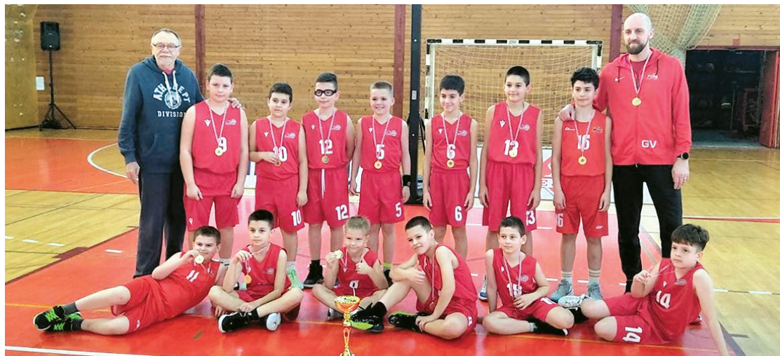
Ekipa U11 KK Belišće ostvarila je novi uspjeh

U Belišću su u nedjelju ostvarene pobjede nad Požeškom 72:40