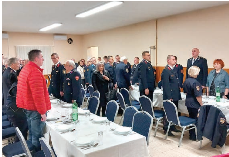
Skupština Vatrogasne zajednice održana je u Veliškovcima

U nazočnosti velikog broja zastupnika DVD-a članica VZG-a Belišće te gostiju iz susjednih VZ-ova, u Veliškovcima je u četvrtak, 21. ožujka u Društvenom domu održana redovna godišnja skupština VZG-a Belišće.