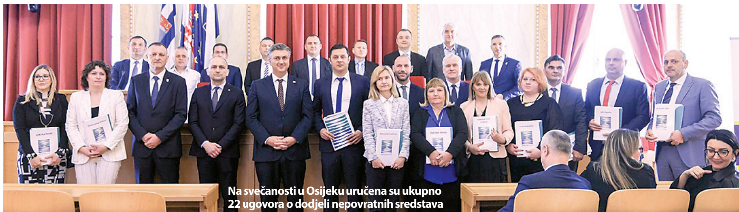
Na svečanosti u Osijeku uručena su ukupno 22 ugovora o dodjeli nepovratnih sredstava

Odlične vijesti: Iz Mehanizma za oporavak i otpornost Hidrobelu d.o.o. odobreno nepovratnih 8,2 milijuna eura