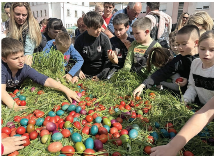
Gnijezdo s tisuću pisanica

Blagdan Uskrsa i ove godine obilježen brojnim manifestacijama