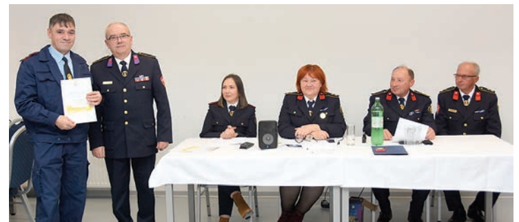
Dodjela priznanja i diploma na skupštini DVD-a Gat