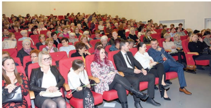
Brojne pripadnice nježnijeg spola nazočile su svečanom programu