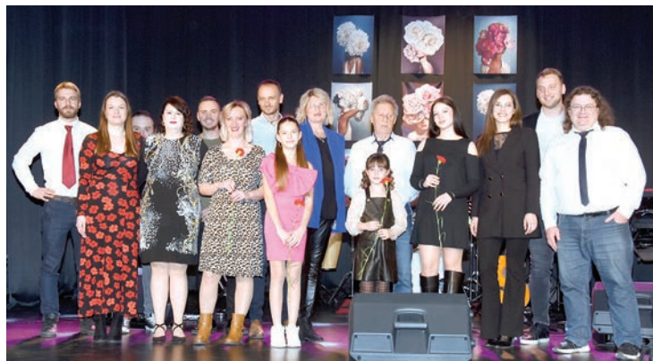
Zabavni orkestar AK sa solistima

nika Belišća je žena, u gradskoj upravi imamo više pročelnica nego pročelnika, na čelu svih gradskih ustanova su ravnateljice, a gradske tvrtke vode većinom direktorice, imamo samo jednog direktora.