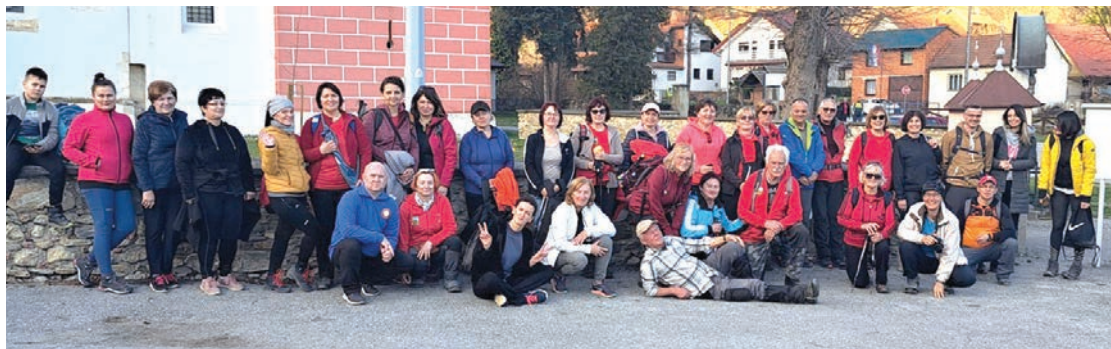
Na Srimušijadi u Velikoj

je planinarska manifestacija koja se održava već 42. godinu na Papuku, kod mjesta Velika.