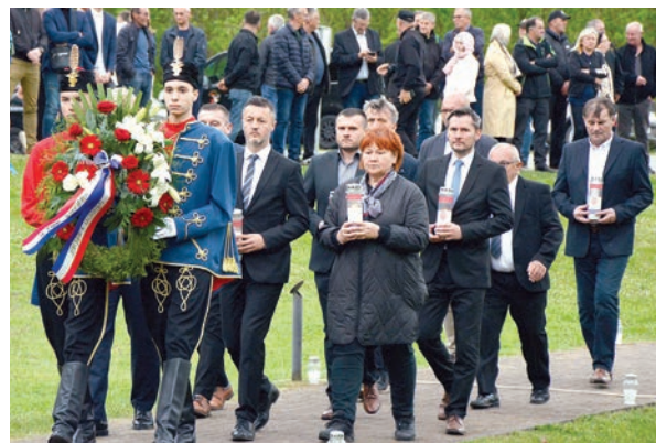
Delegacija gradova i općina Valpovštine i Donjomiholjštine