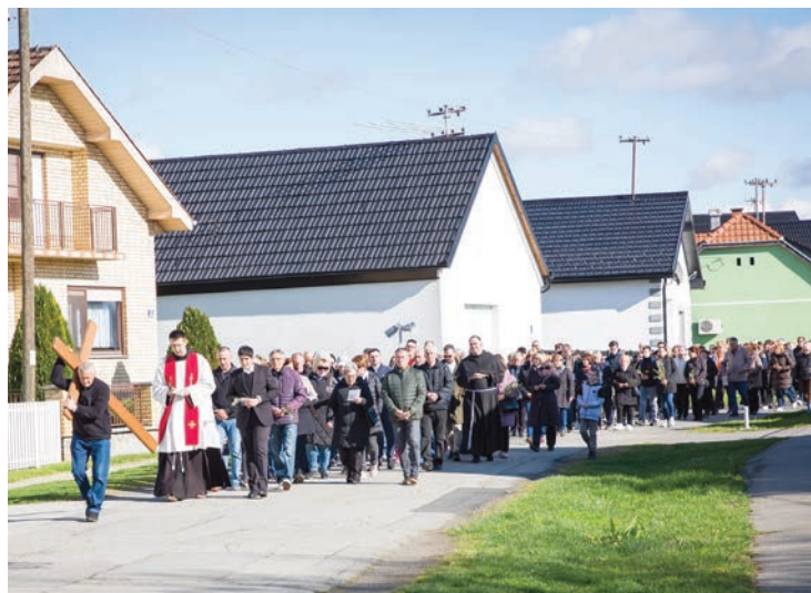
Križni put do Svetišta svete Ane u Bistrincima