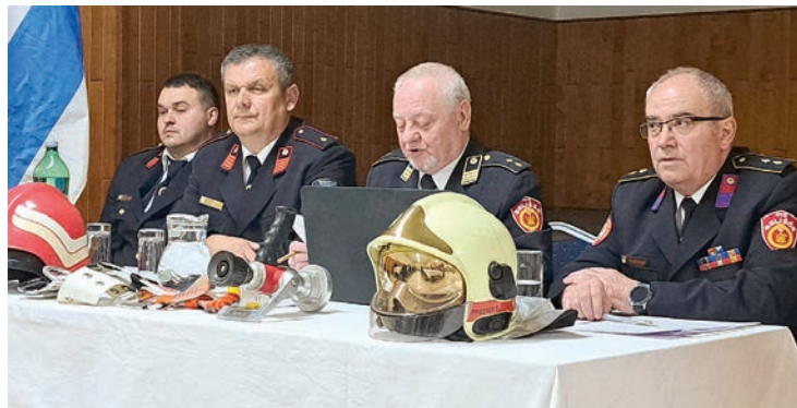
Čelnici Zajednice prezentirali su izvješća i planove