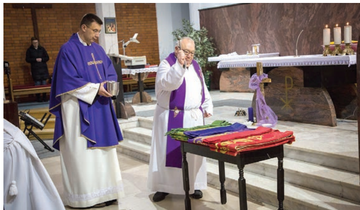
Dekanatski pohod uz blagoslov misnica u Belišću

Poslije euharistijskoga slavlja uslijedila je zajednička sjednica Župnoga pastoralnoga vijeća i Župnoga ekonomskoga vijeća kojoj je predsjedao dekan. Članovi pastoralnoga i ekonomskoga vijeća razmijenili su s dekanom svoja razmišljanja o životu i radu u župnoj zajednici, osvrnuli se na dosadašnji rad i naznačili mogućnosti za budućnost, a dekan je na koncu pregledao i potpisao potrebnu dokumentaciju i župne knjige.