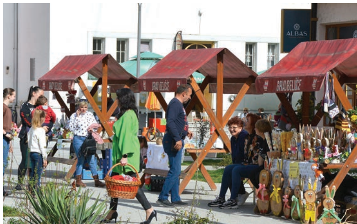
Lokalni proizvođači izlagali su na štandovima Uskršnog sajma