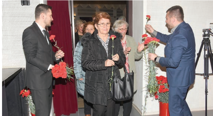
Žene i djevojke u publici dobile su karanfile

- Iako to trebamo činiti i, nadam se, činimo svaki dan, ipak posebno 8. ožujka odajemo priznanje svim ženama za sve ono što svakodnevno čine za nas i za sredinu u kojoj žive. U demokratskim društvima žene su se izborile za ravnopravnost, no, nažalost, u nekim sredinama i dalje ih smatraju manje vrijednima - rekao je Fletko te dodao: - U Belišću smo ponosni na svoje sugrađanke, na njihovu ravnopravnost i na njihovo značenje u društvu. Zamjenica gradonačel-