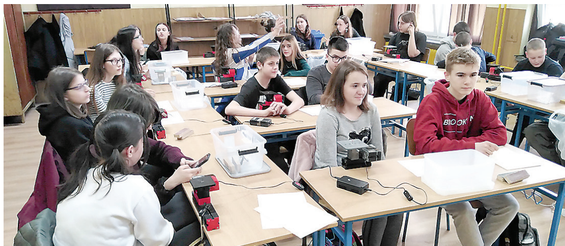
Radionice modelarstva u OŠ Belišće i PŠ Veliškovci

Učenici su u ovoj radionici radili na Unimat strojevima i izrezivali modele bora od 3-milimetarske šperploče prema isprintanom nacrtu na samoljepivom papiru. Dva učenika morala su što kvalitetnije obraditi materijal i spojiti ga u zadani model. Nakon svih održanih radionica ocjenjivačko povjerenstvo izabralo je najbolji rad koji će dvije ekipe iz svake škole odvesti na županijsku razinu natjecanja, a dvije najbolje ekipe sudjelovat će na županijskom