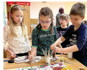
Likovna radionica u Osnovnoj školi