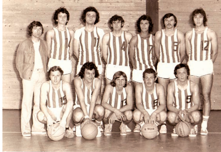
Prva postava KK Belišće prije pola stoljeća

- Danas, 50 godina poslije, klub se, gledajući u bliži i dalji retrovizor, sigurno može pohvaliti s puno uspjeha, ali i kontinuiranog rada. Još iz vremena 1990-ih godina naše su mlade kategorije redovito osvajale prvenstva u našoj regiji, što je poslije i donosilo plasmane na poluzavršnice, ali i završnice državnih prvenstva, s kojih smo se i ne-