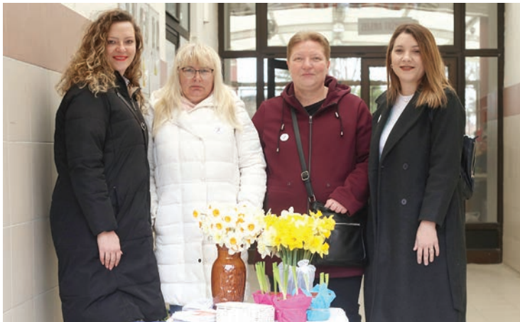
Članice novoosnovane Lige protiv raka Valpovštine