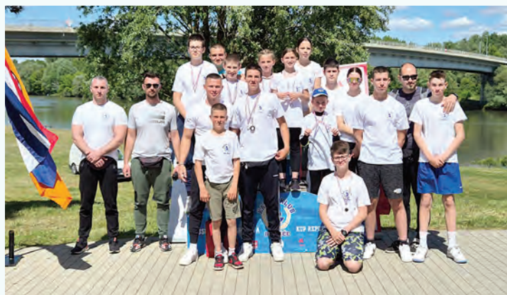
Ekipa Kajak kluba Belišće i ovaj put je ostvarila odlične rezultate