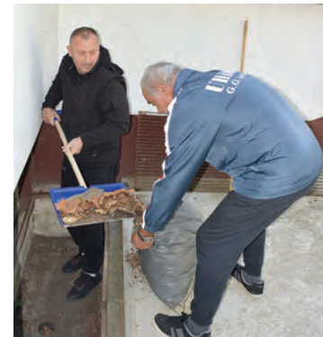
Članovi UHDDR-a također su se uključili u akciju