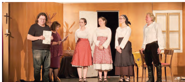
Dodjela srebrnih diploma