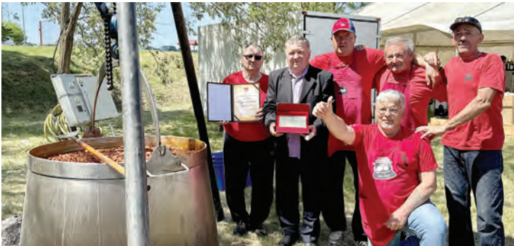
Kotličari su i ove godine pripremili odličan grah