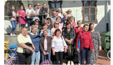
Potpisivanje ugovora u projektu Zaželi s 25 žena

Zaposlenice će se na području općine Bizovac brinuti o 150 osoba ciljane skupine puna 34 mjeseca. Stariji i nemoćni uz pomoć pružatelja usluge lakše će obavljati svakodnevne ak-