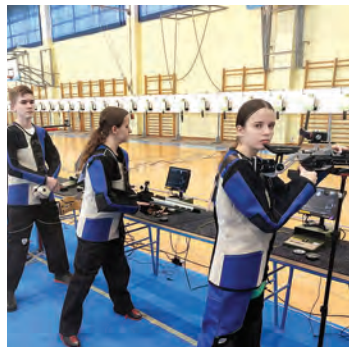
Mladi strijelci bilježe nove uspjehe

Tjedan dana prije županijskog prvenstva, belišćanski su strijelci sudjelovali na Prvenstvu Hrvatske ISSF zračna puška 10 m za mlađe kadete i kadete u zagrebačkoj Dubravi. Iz SK Belišće izvijestili su o rezultatima