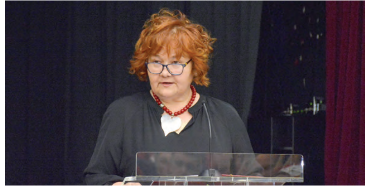
Domaćica ovogodišnje proslave bila je zamjenica gradonačelnika Ljerka Vučković