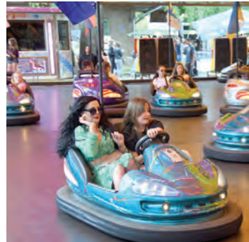
Adrenalina nije nedostajalo