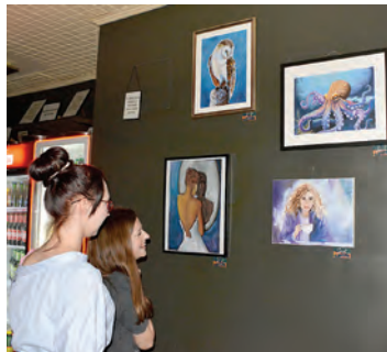
Izložba u povodu Svjetskog dana umjetnosti

U sklopu obilježavanja Dana grada Belišća članovi Likovne Udruge Bel-art u subotu, 27. travnja, održali su likovnu koloniju koja je privukla ljubitelje umjetnosti