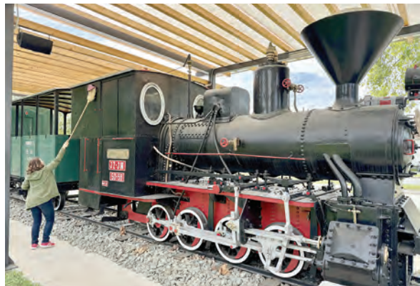
Uređen je i Guco