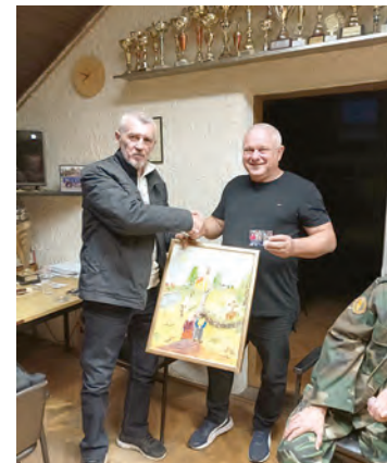
Članovi belišćanskog UHDDR-a zabilježili su niz aktivnosti

Članovi belišćanskog ogranka UHDDR-a sudjelovali su i u akciji „Volim Belišće, ali čisto“ - inicijativi koja okuplja lokalnu zajednicu u cilju očuvanja čistoće i ljepote grada Belišća. Nedavno