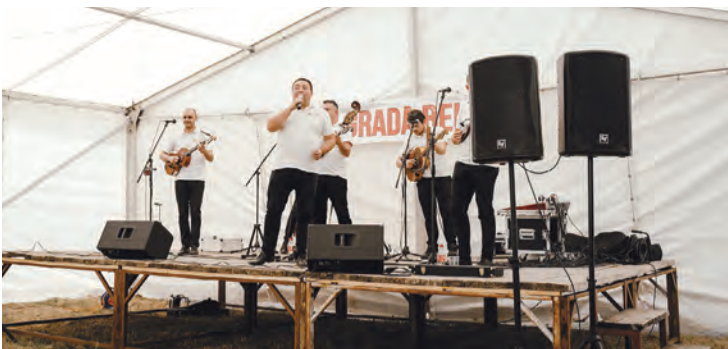
Za zabavu su bili zaduženi Čuvari noći

Proslava Dana grada Belišća nastavljena je potom tradicionalnim zajedničkim ručkom i druženjem na desnoj obali Drave kod Hostela Belišće, gdje su članovi Udruge Kotličari skuhalo grah u našem poznatom 600-litarskom kotliću. Pripreme za kuhanje ručka za Belišćane i njihove goste počele su dan ranije, već u ponedjeljak u poslijepodnevnom satima jer je 100 kilograma graha, 30 kilograma luka, 10 kilograma mrkve, 5 kilograma peršina i 3 kilograma celera trebalo oprati, očistiti i izrezati, pa ih uz 120 kilograma kobasica, suhog mesa i slanine pripremiti za trosatno kuhanje 1.200 porcija. Grah i mladi luk te osvježavajuće piće i druženje se moglo nastaviti uz pjesmu i ples, za što se pobrinuo Tamburaški sastav Čuvari noći.