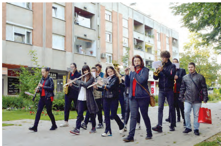
Dan je započeo budnicom u izvedbi Puhačkog orkestra grada Belišća