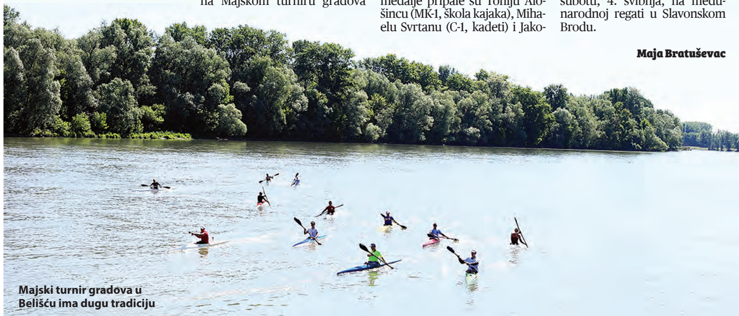
Majski turnir gradova u Belišću ima dugu tradiciju