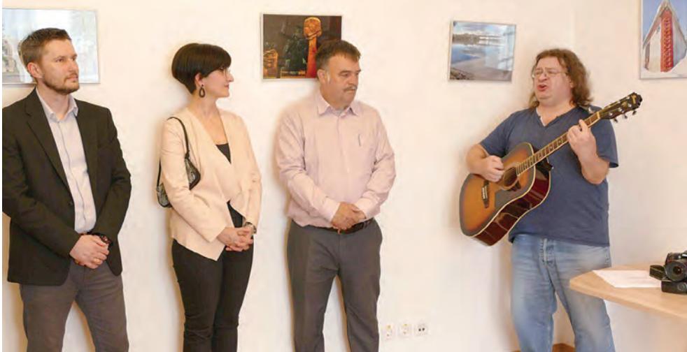
Naš Zajo vjerni je kroničar događaja u svom kraju