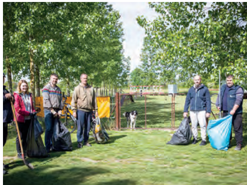
Svoj doprinos uređenju dali su i članovi Kinološkog društva