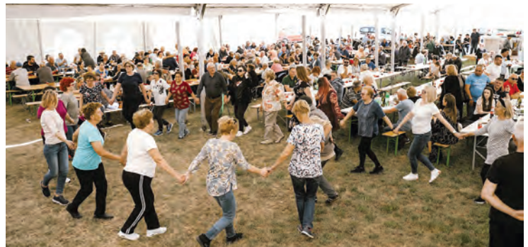
Dobroj atmosferi na proslavi pridonio je i ples