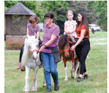
Jahanje je za djecu uvijek posebna atrakcija