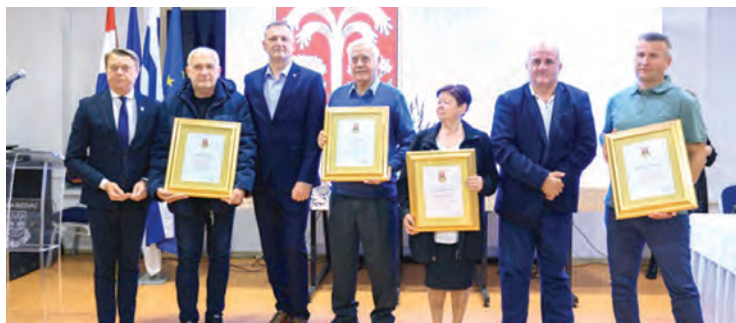
Dobitnici zahvalnica Općine Bizovac