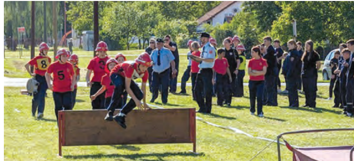
Mladež je pokazala iznimnu uvježbanost

vače, drugo je mjesto pripalo DVD-u Veliškovci, a treće ekipi DVD-a Grabovac. U konkurenciji 20 ekipa Bocanjevčani su bili peti, na 11. mjestu je bio DVD Gat, a na 14. mjestu ekipa Belišća. U istoj disciplini, ali kategoriji djeca ženska, natjecalo se osam ekipa. Prva je bila ekipa Vukojevaca, slijedi Beljevina pa Dalj, a male Belišćanke su bile sedme. U natjecanju s preprekama za vatrogasnu mladež sudjelovalo je 13 muških ekipa. Prvo je mjesto pripalo DVD-u Vukojevci, slijedi Antunovac pa Branjin vrh, a ekipa DVD-a Beliše završila je na 10. mjestu. U kategoriji ženske mladeži nadmetalo se šest ekipa. Vatrogaskinje iz Stipanovaca, Feričanaca i Đakova bile su najuspješnije. Članice ženske ekipe DVD-a Veliškovci završile su na petom mjestu.