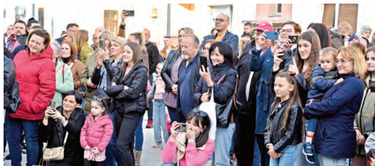
Priredba se odvijala pod budnim okom publike