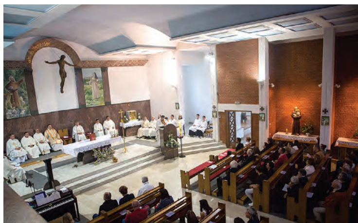
Svečana sveta misa u belišćanskoj župnoj crkvi