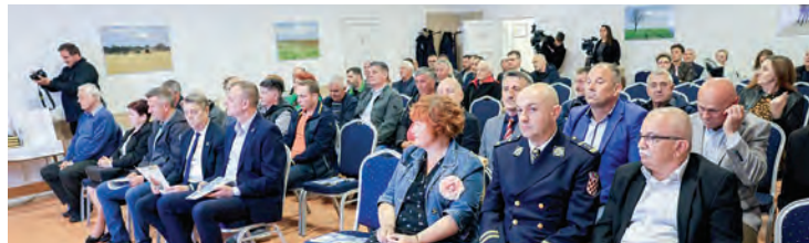
Svečana sjednica Općinskog vijeća