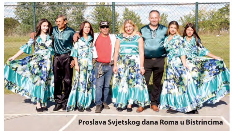
Proslava Svjetskog dana Roma u Bistrincima