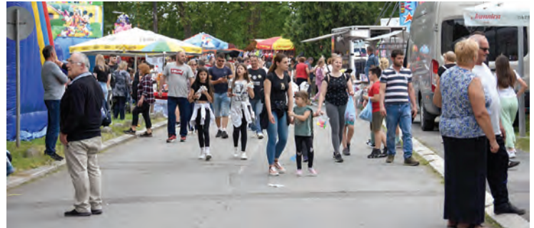
Belišćani i njihovi gosti u velikom su broju pohrlili u središte grada