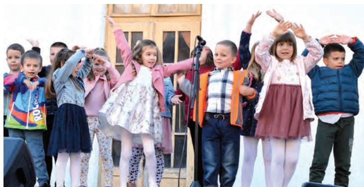
Red pjesme, red plesa i recitacija