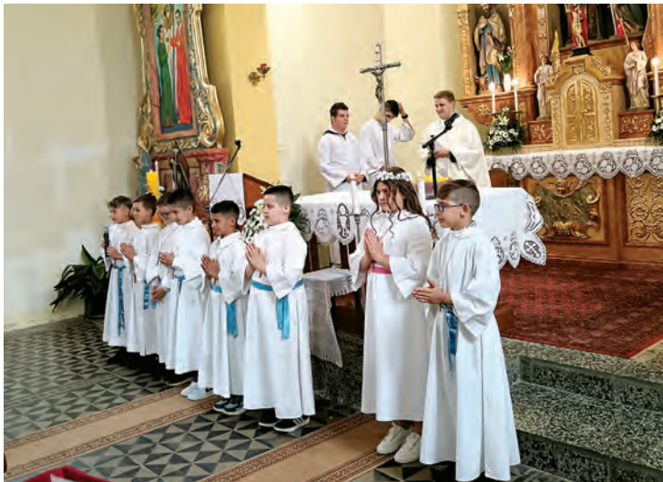
Prva pričest i kirvaj u Bocanjecima