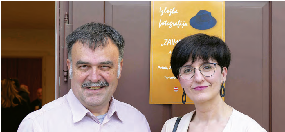
Prva izložba fotografija Zaima Saljijija