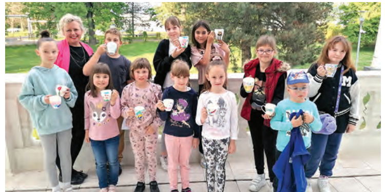
Polaznici kreativne radionice u knjižnici

Proletne aktivnosti u Gradskoj knjižnici i čitaonici