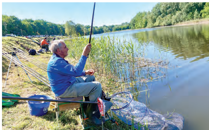
Belišćanski ribiči ostvarili su dobar plasman