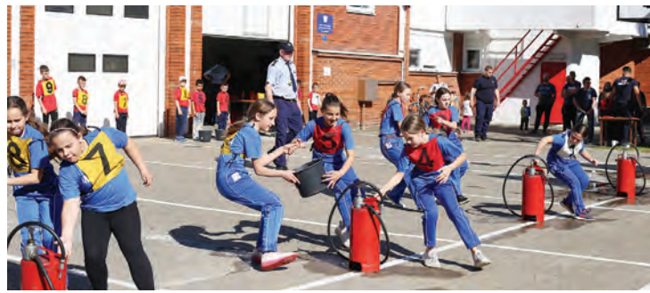
Belišćanski 25. Susret mladeži i pomlatka

U natjecanju s vatrogasnom brentačom, u kategoriji djeca muška, prva je bila ekipa Popo-