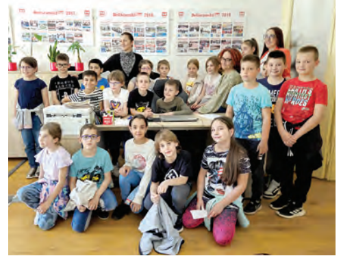
Posjet 2.a razreda

Svečano otvorena izložba starih mapa i razglednica grada Belišća "Život uz tvornicu"