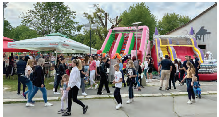
Pod šarenim šatorima svatko je mogao pronaći nešto za sebe

čestitamo 1. svibnja - Dan Grada Belišća