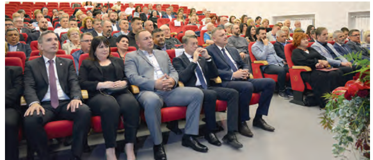
Brojni uzvanici odazvali su se proslavi belišćanskog rođendana

D ržavna himna, splet slavon- skih pjesama te svima draga i dobro poznata pjesma „Volim te, volim Belišće moje“, u izvođenju CPD-a Mir, označili su početak središnjeg dijela proslave 140. rođendana našeg grada - svečane sjednice Gradskog vijeća grada Belišća, koja je u utorak, 30. travnja, održana u Centru za kulturu Sigmund Romberg.