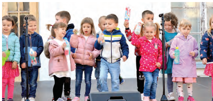
Program su otvorili najmlađi