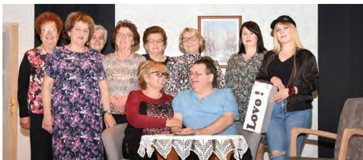
Predstava Digitalno doba