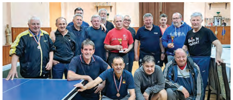
Sudionici stolnoteniskog turnira u Brođancima