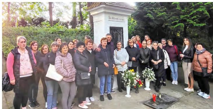
Posjet Svetištu svete Ane u Bistrincima