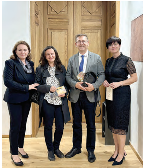
Organizatori izložbe i predstavnici Grada Belišća, Muzeja Belišće i Državnog arhiva Osijek na otvorenju

Razdoblje razvoja industrije i gradnje stambenih i tvorničkih zgrada Belišća, ovdjekovječeno je rijetkim razglednicama, u to vrijeme zbog jednostavnosti i jeftinog slanja, omiljeno sredstvo komunikacije.