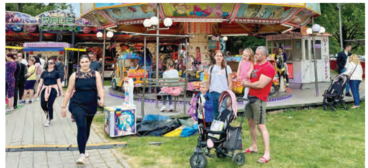
Najviše sadržaja bilo je za najmlađe