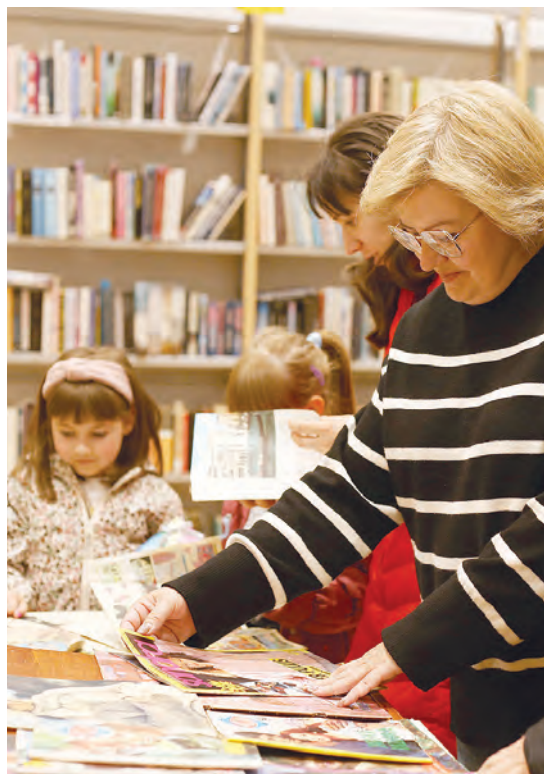
Izložba starih časopisa i novina