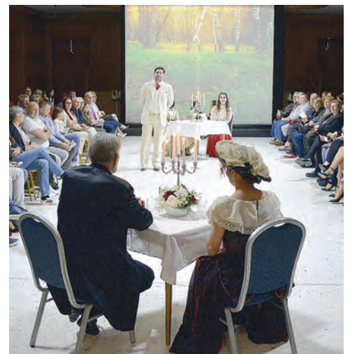
Palej ljubavi ponovo je oduševio Belišćane