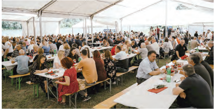
Zajednički ručak s građanima