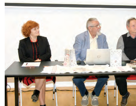
Predstavljanje knjige „Zidnjaci naših baka“