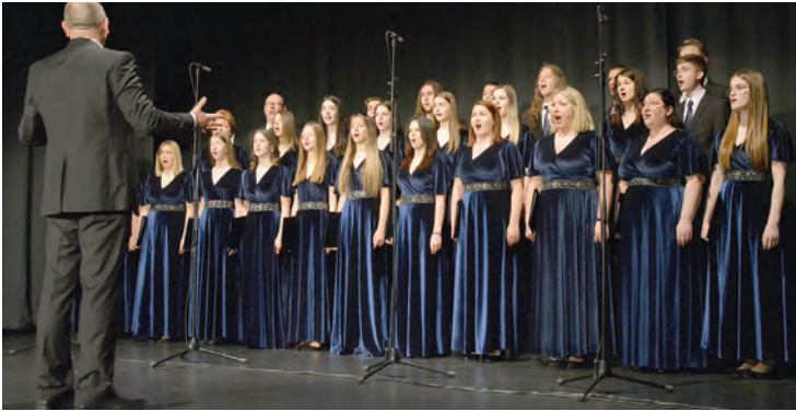
Crkveno pjevačko društvo Mir Belišće