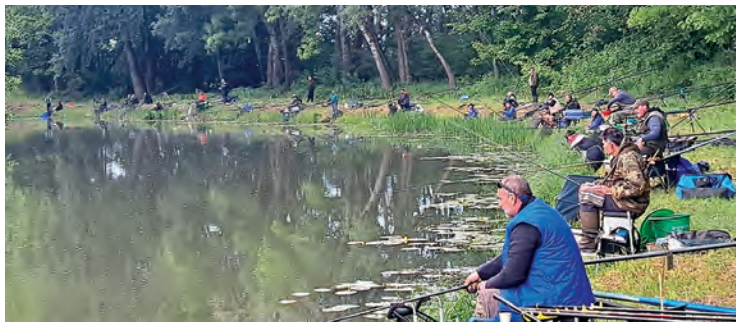
Memorijalni Kup u Gat u okupio je devet ekipa