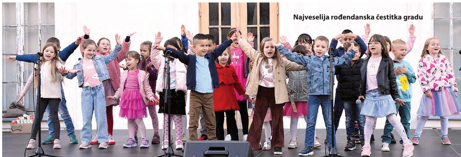
Najveselija rođendanska čestitka gradu

Najveseliju rođendansku čestitku Belišću i ove godine uputili najmlađi