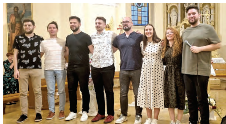
Band Noel uvećao je misno slavlje