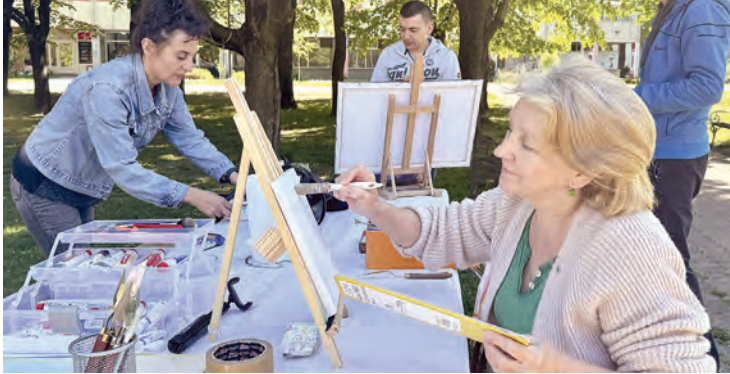
Belišćanski slikari svome gradu za rođendan