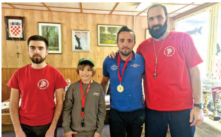
Najbolji su bili natjecatelji Amur Interland iz Darde