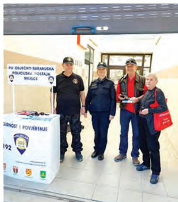
U Belišću je obilježen Međunarodni dan svjesnosti od mina