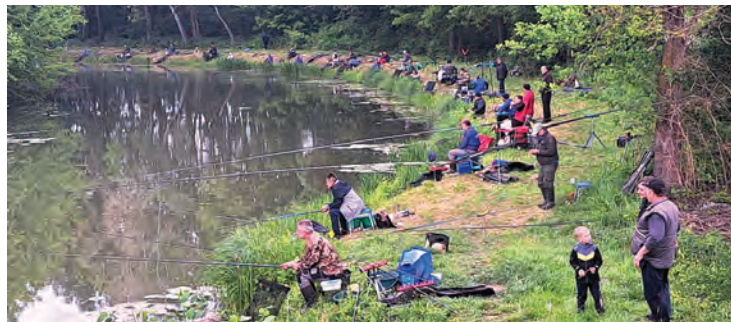
Posjećeno je bilo i društveno natjecanje