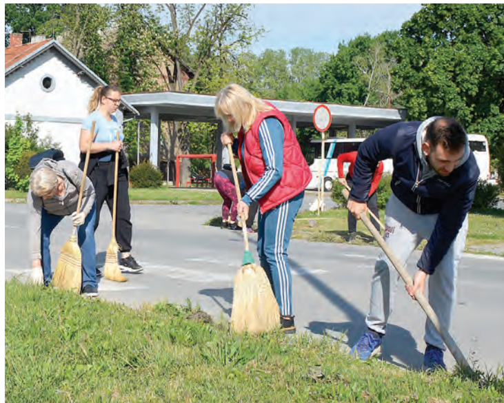
Čistilo se u svim dijelovima Belišća