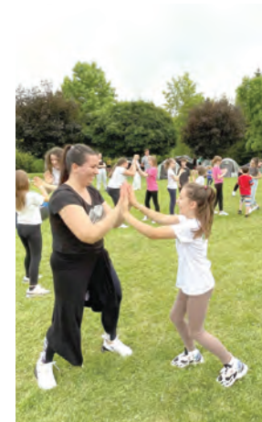
U kampovima su sudjelovale i cijele obitelji