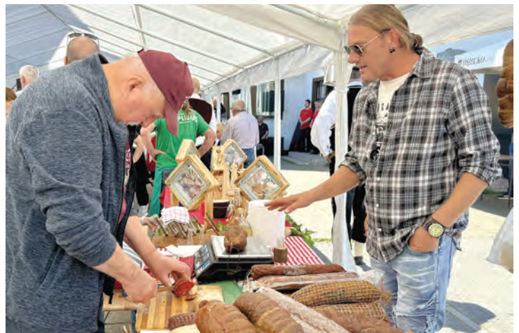
Uživalo se u domaćem kulenu