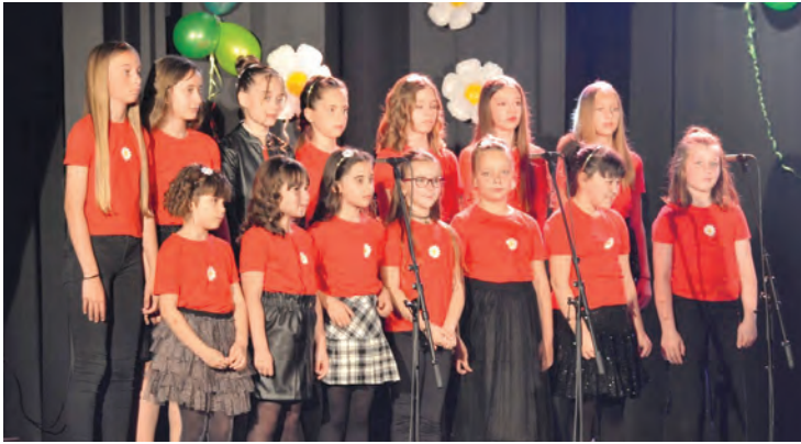
Dječji zbor Belissimo bio je posebno iznenađenje