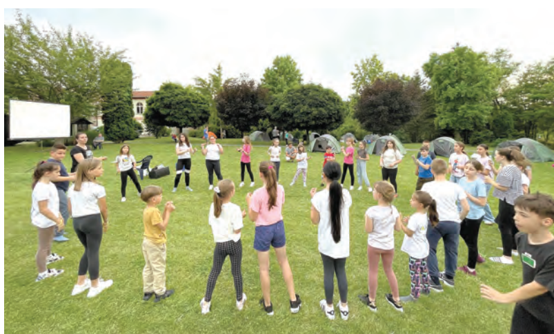
Brojne igre i izazovi oduševili su djecu