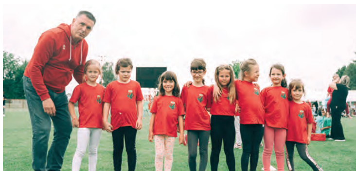
Ekipa belišćanskog vrtića postigla je odlične rezultate