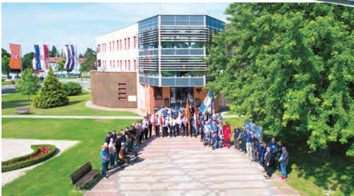
Okupljanje sudionika započelo je ispred gradske uprave