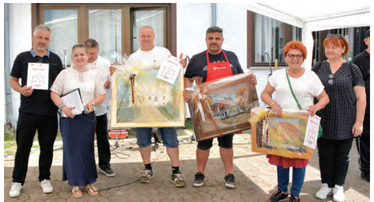
Najbolji kuhari Gastro festa