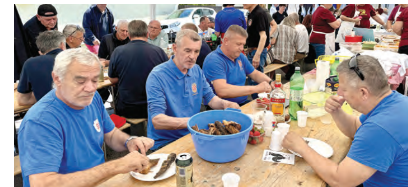
Članovi UHDDR-a Belišće spravljali su riblje specijalitete