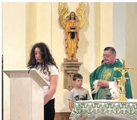
Na euharistijskom slavlju