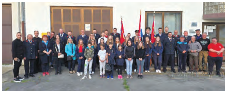
Proslava Svetog Florijana u Veliškovicima