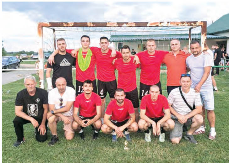
Ekipa NK Luč pobjednici su Šerifovog turnira

je u finalu pobijedila ekipu „Zalutali“ Normanci-Topoline, dok je treće mjesto zauzela ekipa „Masteri“.