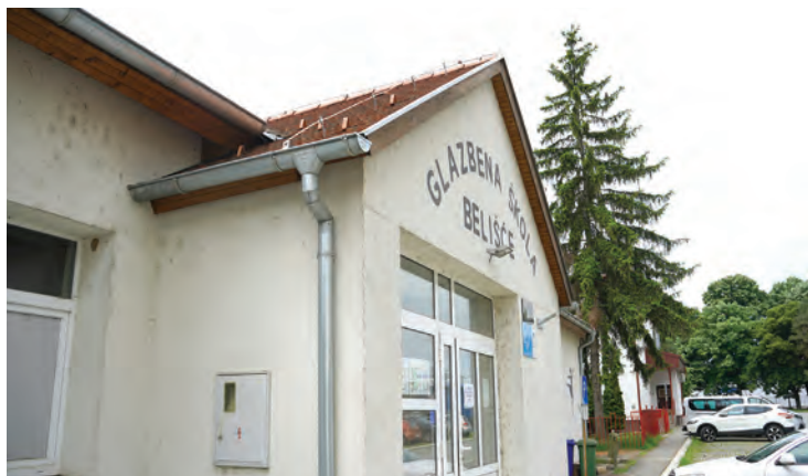
Zgrada u vlasništvu Grada Belišća koristila se za potrebe dislociranog odjela Glazbene škole

Budući da se na području grada Belišća kontinuirano bilježi porast interesa za dodatnim kapacitetima boravka djece u vrtiću, provedbom ovog projekta uvelike se pridonosi poboljšanju standarda obiteljskog života, ali i kvalitetnijoj brizi o predškolskoj djeci. Na taj način Dječji vrtić Maslačak Belišće postaje još dostupniji, a sve zahvaljujući prenamjeni, rekonstrukciji i opremanju objekta u neposrednoj blizini matičnog vrtića. Naime, radi se o zgradi u vlasništvu Grada Belišća koja se koristila za potrebe dislociranog odjela Glazbene škole, a koju od igrališta DV-a Maslačak dijeli samo zaštitna ograda.