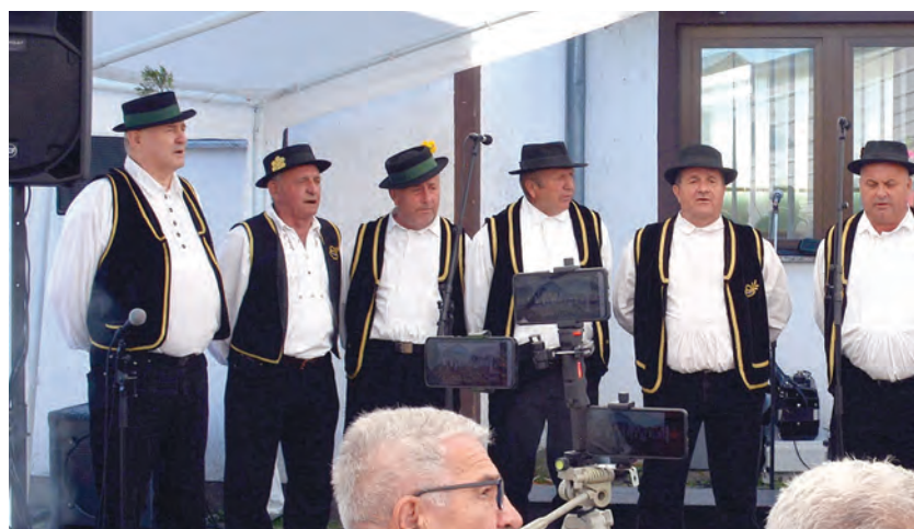
Nastup Bocanjevačkih pajaša