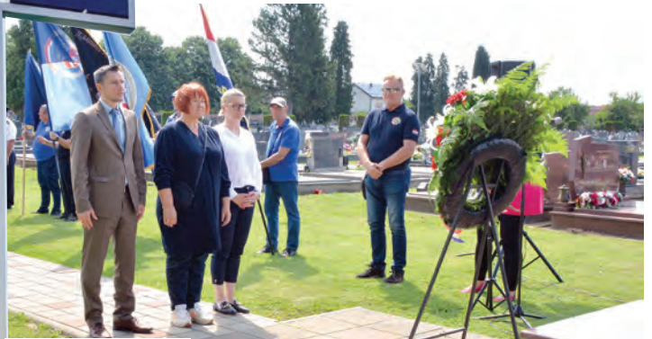
Vijenac i svijeće za poginule od izaslanstva Grada Belišća