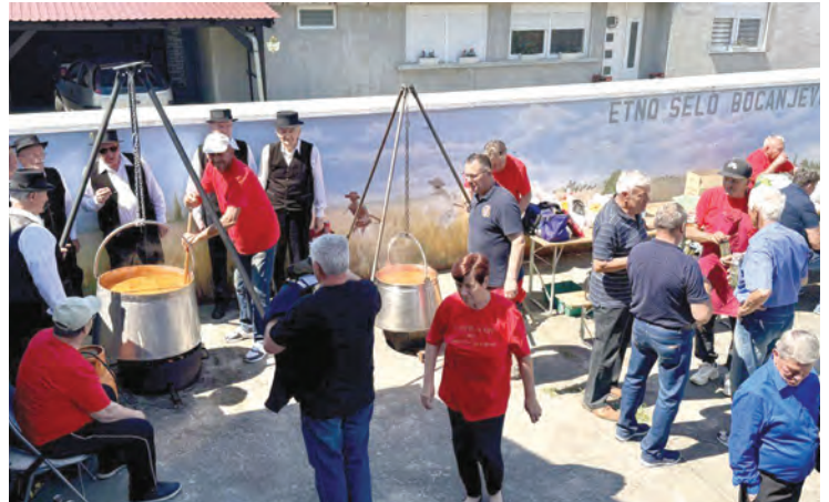
Središte Bocanjevaca, ali i šire ispunili su zamamni mirisi