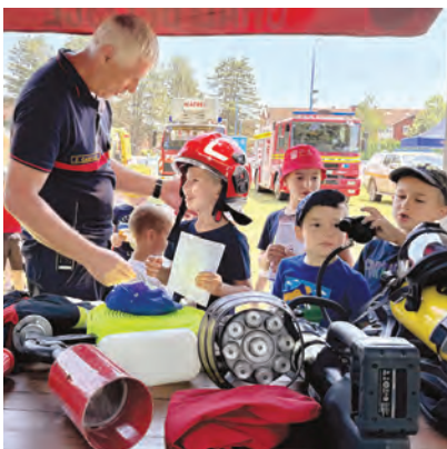
Najmlađi su posebno uživali u prezentacijama