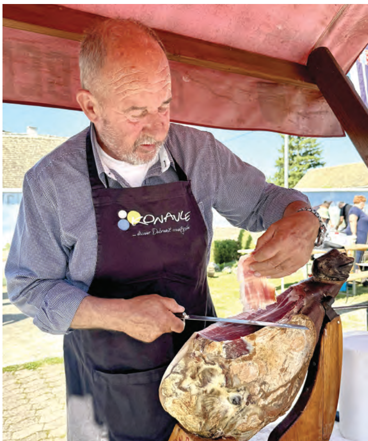
Degustirao se i konavolski pršut

M ještani Bogačnjevaca još su jednom pokazali koliko su odlični domaćini pri realizaciji osmog zaredom Gastro festa - manifestacije koja se početkom svibnja tradicionalno održava u ovom etnoselu u povodu Dana grada Belišća, a koja je ove godine održana u subotu, 11. svibnja. Organizatori događanja bili su Grad Belišće i Turistička zajednica Grada Belišća. Posjetitelji koji su se od jutarnjih sati počeli okupljati u Bogačnjevcima na ovaj su događaj najbolju pozivnicu dobili prethodnih godina kada su uživali u druženju, pjesmi te odličnoj do-