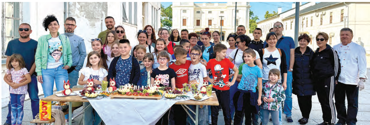
Sudionici ovogodišnjeg obilježavanja Međunarodnog dana obitelji u Belišću