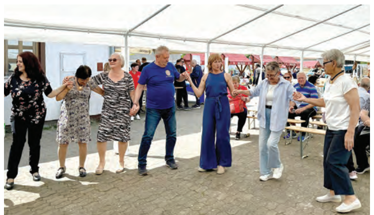
Zaplesalo se i zapjevalo