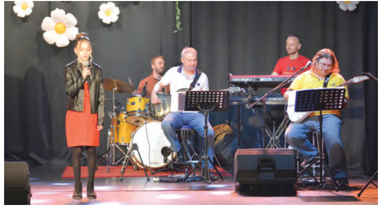
Soliste je pratio Zabavni orkestar AK

Dječji koncert u organizaciji CK „Sigmund Romberg“