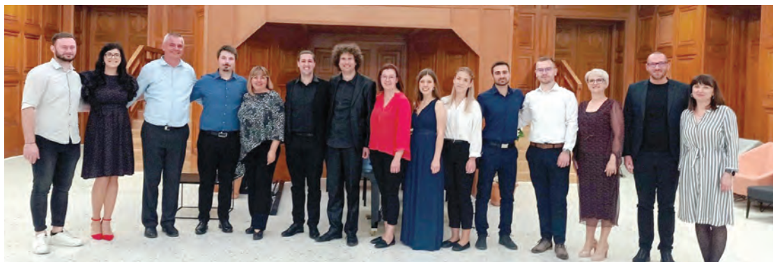
Bivši učenici Glazbene škole oduševili su muziciranjem

Dva dana poslije, u srijedu, 15. svibnja u prostoru Palače Gutmann ugostili su prijatelje - učenike glazbenih škola iz Slavonije i Baranje. Učenici iz Slatine, Vukovara, Požege, Slavenskog Broda, Donjeg Miholjca, Đakova, Našica, Belog Manastira i Osijeka svojim su sviranjem još jednom dokazali zašto je glazba toliko obožavana, a uživalo se u svakom trenutku njihova programa. Gosti su čestitali na obljetnici, a domaćini ih počastili prigodnim domjenkom. Drugi koncert održan je dan poslije u kapelici dvorca Prandau-Normann u Valpovu, gdje su učenici i zborovi Glazbene škole održali impresivan koncert, a na koncertu je premijerno prikazan film o 20 godina djelovanja Glazbene škole auto-