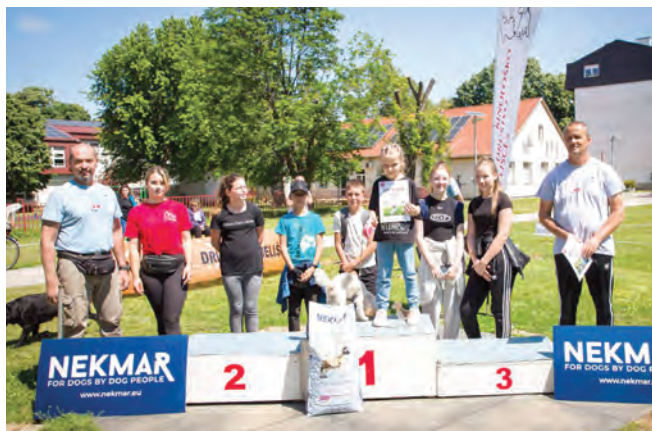
Evin pudl proglašen je najljepšim psom