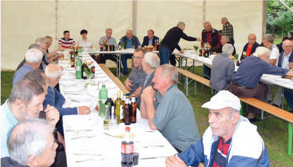
Nekadašnji zaposlenici papirne industrije pri Kombinat u Belišću okupili su se 18. put