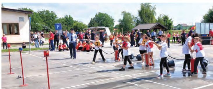
Kup DVD-a Veliškovci za podmladak