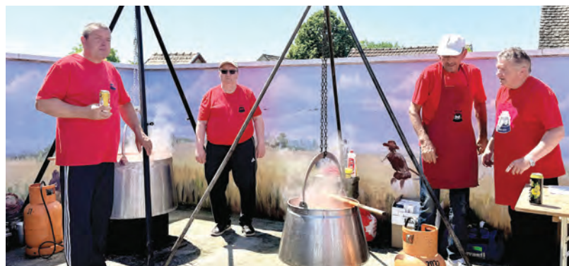
Kotličari su pripravljali slavonski čobanac