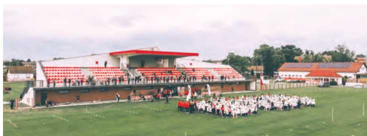
Dan kada je Belišće ispunio olimpijski duh