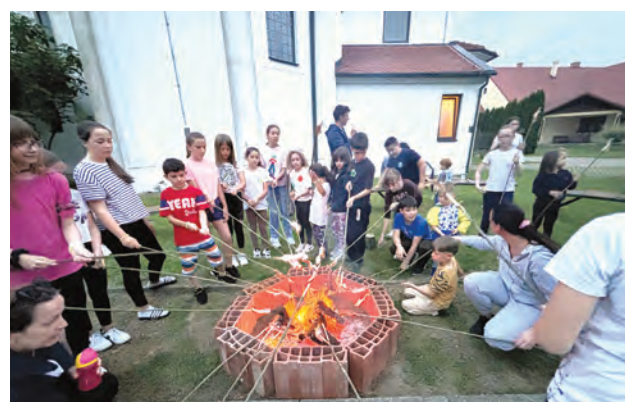
Pečena slanina uz logorsku vatru