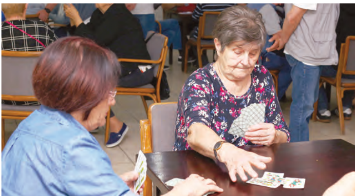
Sportski susreti umirovljenika u Belišću

Nizu manifestacija kojima je obilježen Dan grada Belišća i ove se godine pridružila Matica umirovljenika grada Belišća, koja je organizirala tradicionalni Sportski susret članova udruga umirovljenika iz Zdenaca i Đurđenovca.