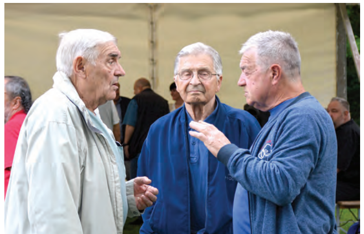
Sjećanja i lijepih uspomena bilo je napretek