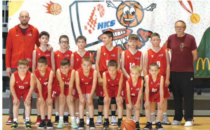
Mladi Belišćani su među sedam najboljih ekipa u Hrvatskoj