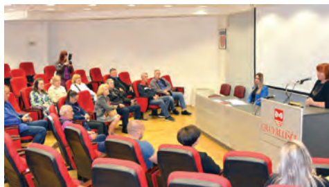
Potpisivanje ugovora s udrugama