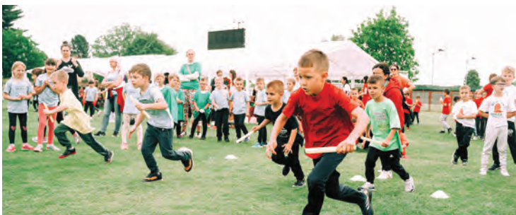
Natjecatelji su pokazali iznimnu spretnost i vještine