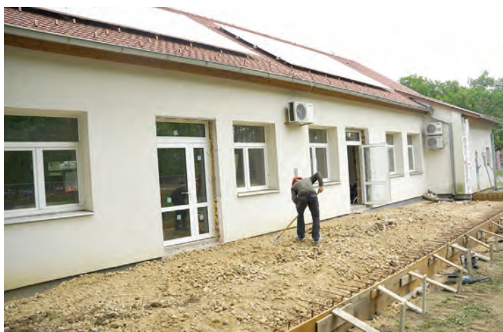
U tijeku su radovi na izgradnji terase u dvorištu Glazbene škole

Sadržaj ovog članka isključiva je odgovornost Grada Belišća. Izneseni stavovi i mišljenja samo su autorova i ne odražavaju nužno službena stajališta Europske unije ili Europske komisije. Ni Europska unija ni Europska komisija ne mogu se smatrati odgovornima za njih.