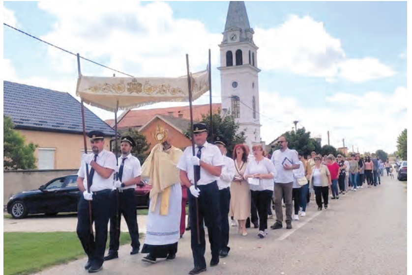
Župa Veliškovci također njeguje lijepu tradiciju Tijelovske procesije kroz mjesto

P roslava crkvenog goda i nebeskog zaštitnika, svetog Josipa Radnika (1. svibnja), slavlje sakramenta svete potvrde ili krizme (12. svibnja) te svete pričesti (26. svibnja), samo su dio važnih događaja koji su obilježili život župne zajednice u Belišću tijekom svibnja.