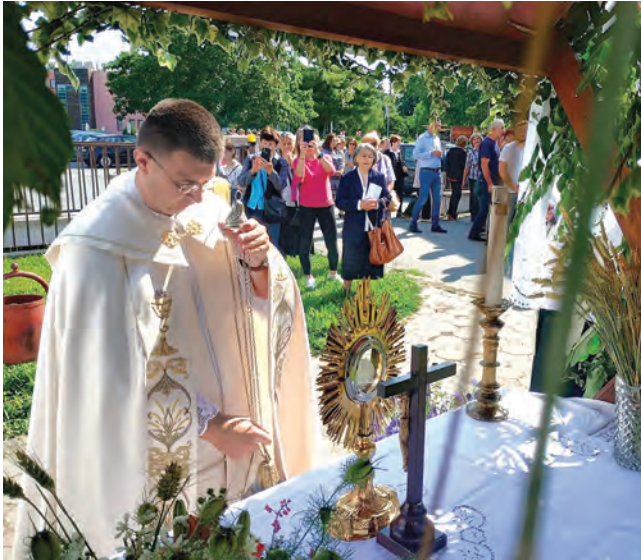
Svaku od sjenica uredila je pojedna grupa vjernika