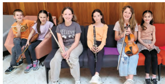
Mladi glazbenici marljivo i predano vježbaju