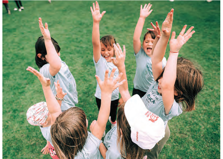
Mali olimpijci spremni za natjecanja i druženja

U Belišću održan 20. Olimpijski festival d