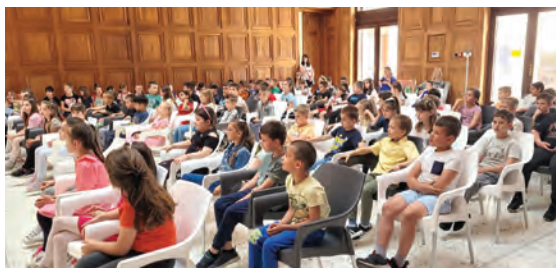
Dan otvorenih vrata Glazbene škole