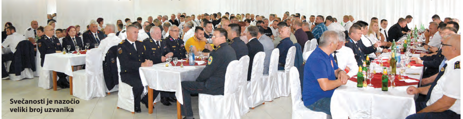
Svečanosti je nazočio veliki broj uzvanika