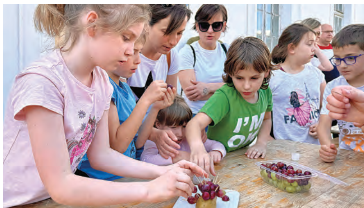
Radionica ukrašavanja voća bila je poseban izazov