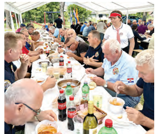
Zajednički ručak priređen je na prostoru gradskog bazena