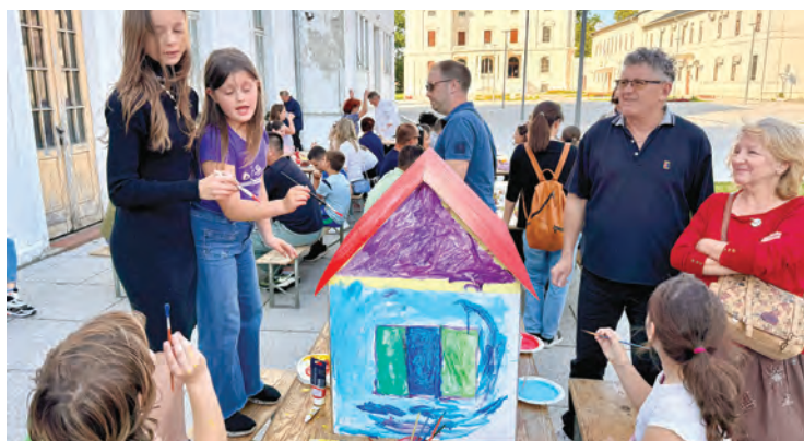
Djeca i roditelji zajednički su bojili kartonsku kuću