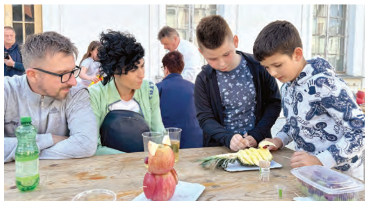
Obitelji su uživale u različitim zajedničkim aktivnostima