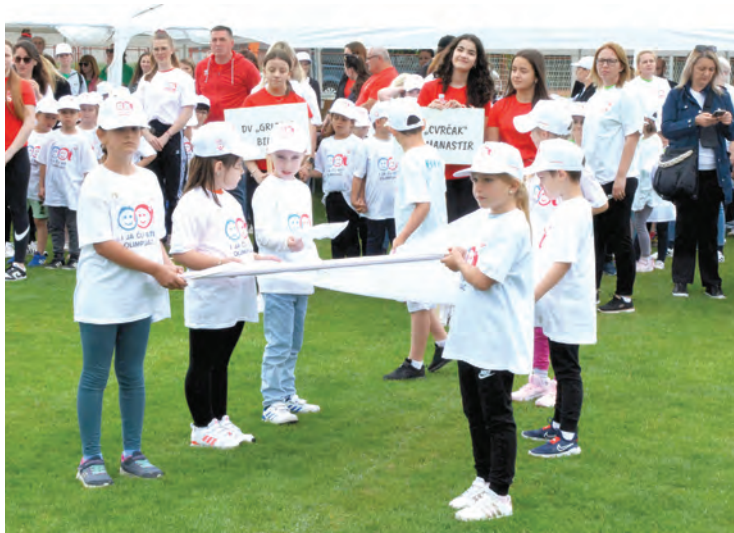
Zavijorila se i zastava HOO-a

ječjih vrtića Osječko-baranjske županije