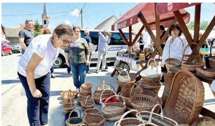
Bogata ponuda autohtonih proizvoda