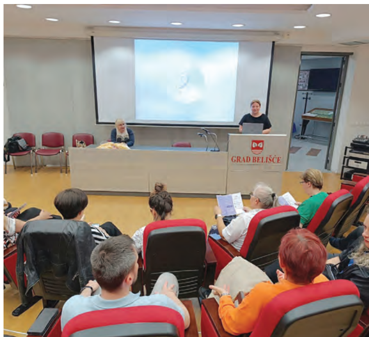
Predstavljanje Lige protiv raka u Belišću

Natjecatelji iz CTK Valpovo-Belišće ostvarili su odličan rezultat