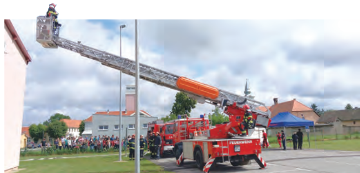
Važnu ulogu u vježbi imali su i pripadnici DVD-a Belišće