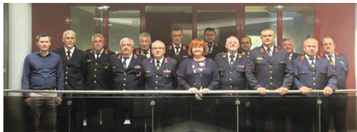
Prijam za vatrogasce u gradskoj upravi

dobru suradnju Grada i Vatrogasne zajednice te zahvalili na pomoći i podršci Gradu i svim vatrogascima na doprinosu i radu. U jutarnjim satima članovi DVD-a Belišće nazočili su svetoj misi