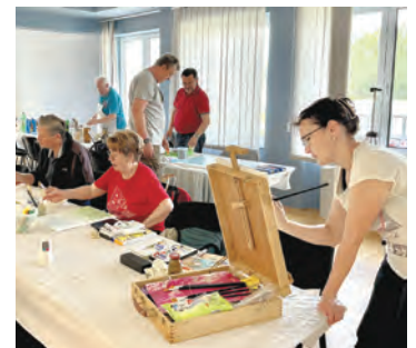
Belišćanski umjetnici u Branjinu Vrhu

Tradicionalno druženje umirovljenika u povodu Dana grada Belišća