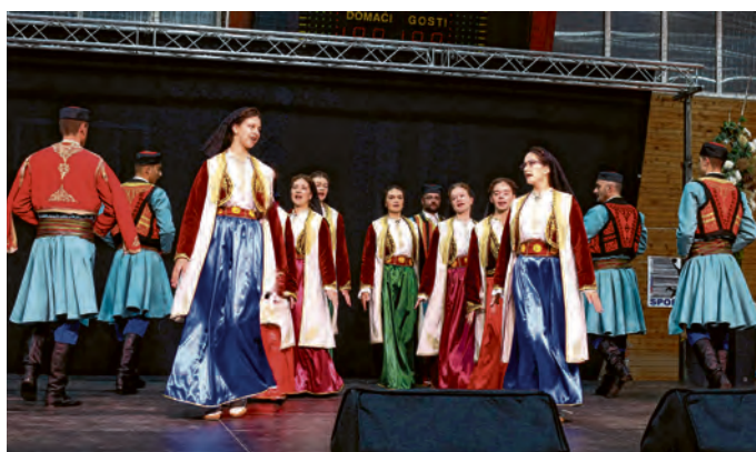
Članovi KUD-a "Vesna" iz Mojkovca u Crnoj Gori