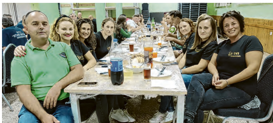
Na 4. Druženju pjevačkih skupina u Bocanjevcima

U organizaciji Muške pjevačke družine Bocanjevački pajdaši, u subotu, 21. rujna 2024., u prostorijama Hrvatskog doma Bocanjevci održano je četvrto druženje pjevačkih skupina.