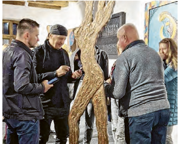
Slike i skulpture Stephana Lupina oživjele su obnovljeni prostor Starog mlina

ost otvaranja obnovljene zgrade Starog mlina, u kojem je postavljena izložba našeg renomiranog umjetnika Stephana Lupina