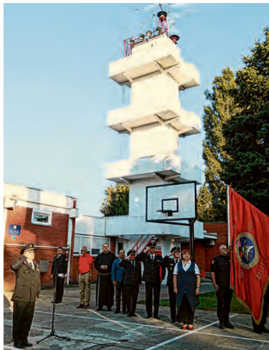
Postrojavanje sudionika prije svečane sjednice