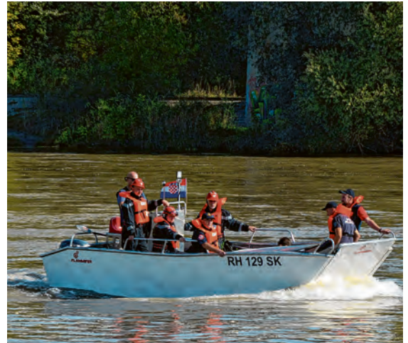
Obilježavanju su se priključili i belišćanski vatrogasci