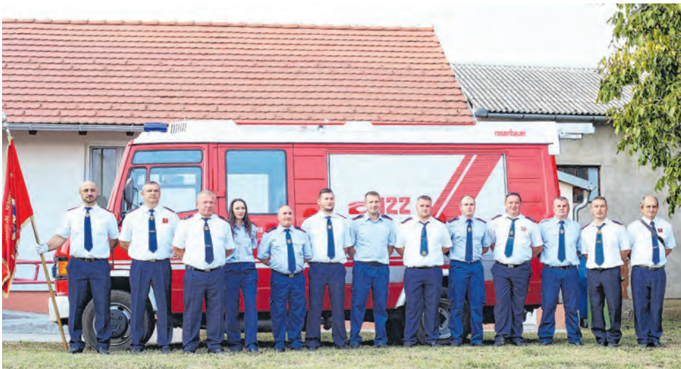
Vatrogasci uz donirano navalno vozilo iz Austrije