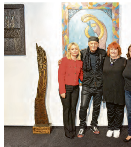
I umjetnik Stephen Lupino bio je imprints belišćanskim muzejsko-galerijskim pro