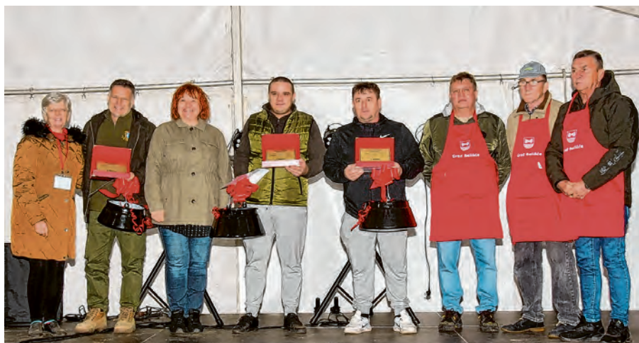
Najboljim kuharima uručena su priznanja i nagrade