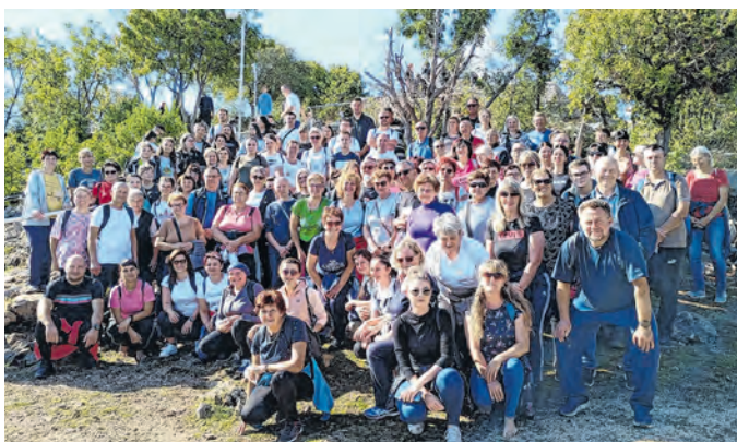
Belišćanski vjernici kod Kraljice mira