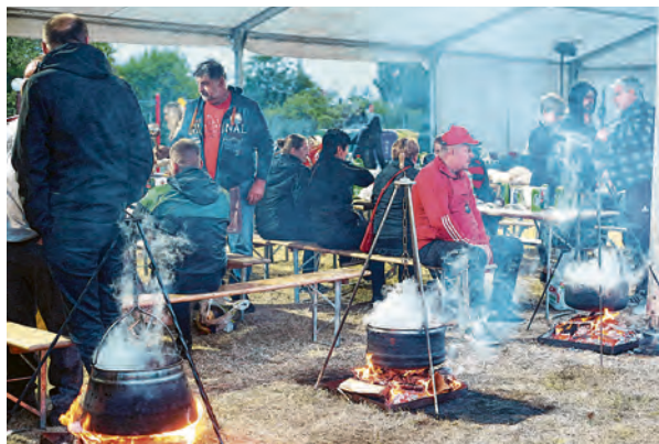
Na natjecanju je sudjelovalo tridesetak majstora kotlića