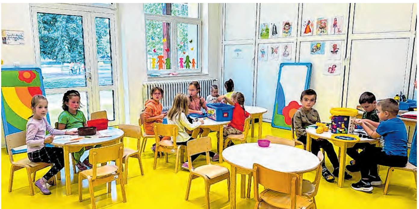
Mališani su dobili moderno uređen prostor za boravak