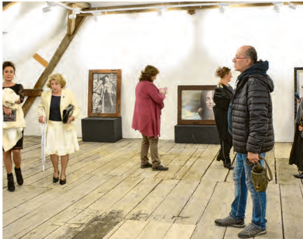
Posjetitelji su se oduševili izložbom i rezultatima obnove