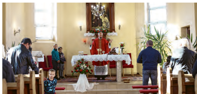
Proslava crkvenog goda u Tiborjancima