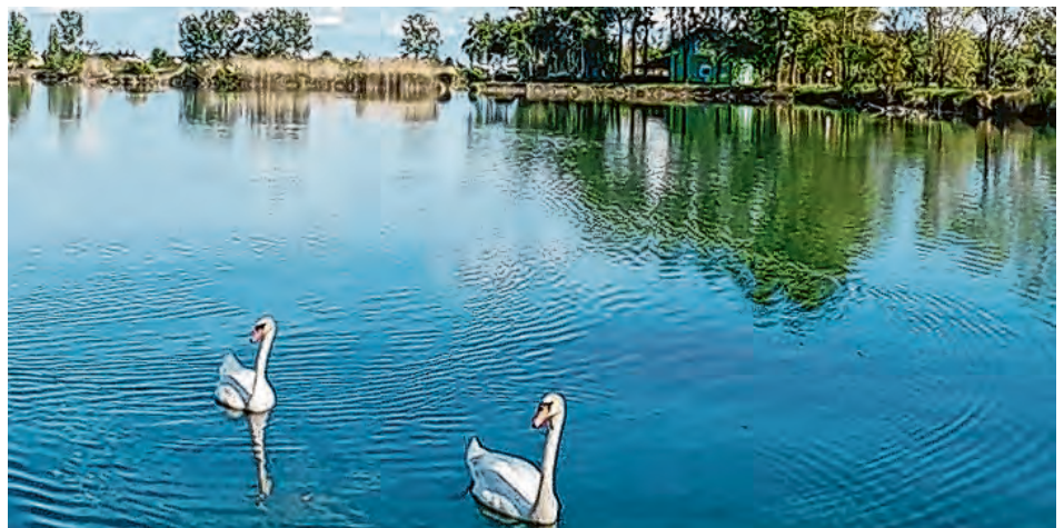
Voda u Bajeru izvrsne je kakvoće