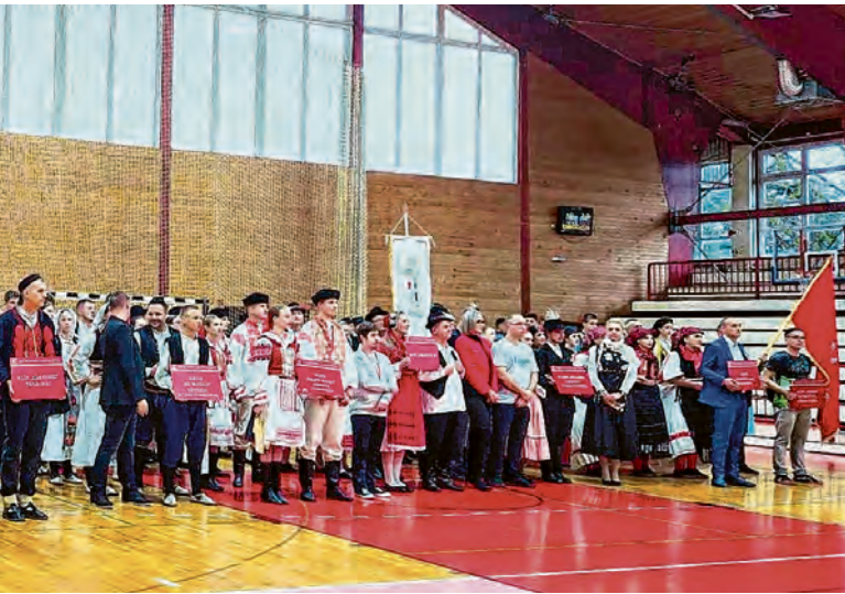
Sudionici Međunarodne smotre folkloru u Belišću