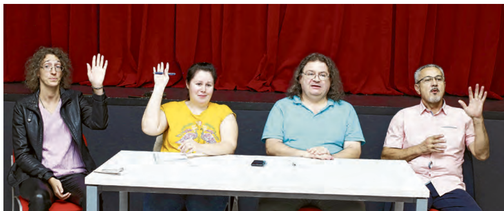
Godišnja skupština Amaterskog kazališta