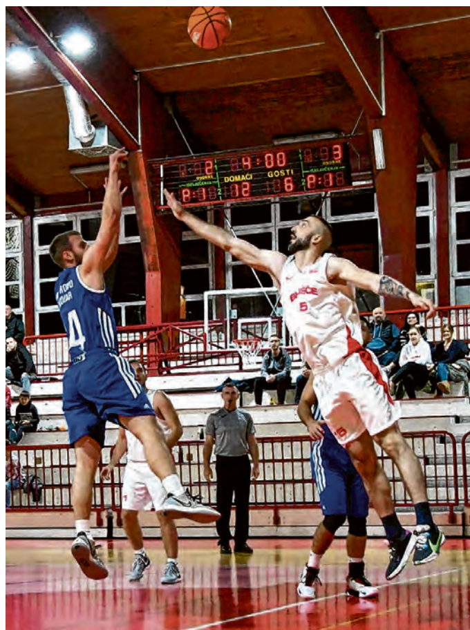
Seniori KK Belišće otvorili su novu sezonu