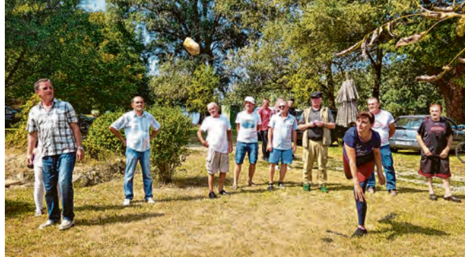
Uvijek atraktivno bacanje kamena s ramena