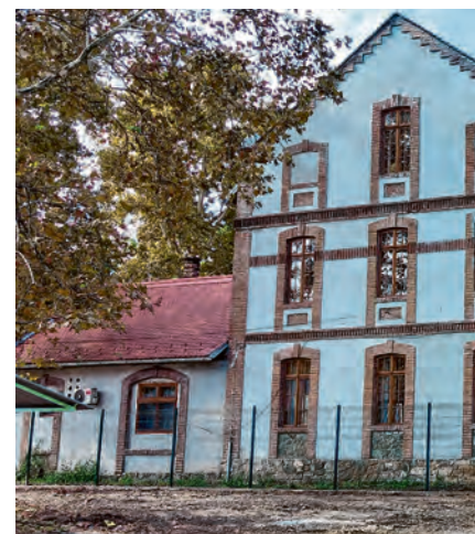
Novi atraktivan prostor i objekt u gradu

Prisutnima se tada obratila konzervatorica, koja je izrazila veliko zadovoljstvo zbog uspješno završenog projekta energetske obnove mlina. U svom govoru istaknula je značenje očuvanja kulturne baštine, posebno u zajednicama