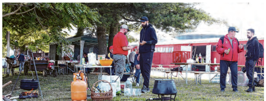
Gastronomskih užitaka bilo je napretek