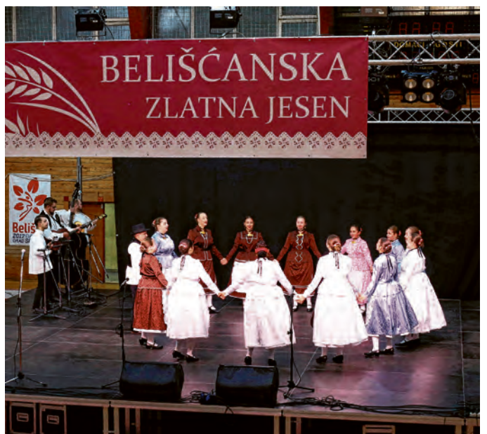
Led su probili Bocanjevčani