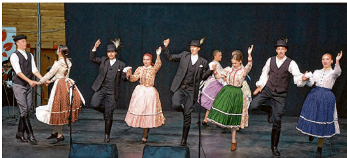
Dojmljiv nastup folklorša iz Mađarske