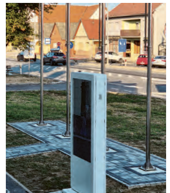
Novi informativni stupovi u Bizovcu