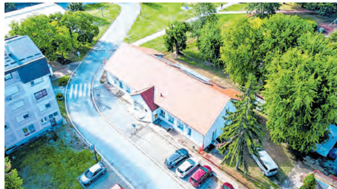
Nekadašnja Glazbena škola postala je vrtić

Projekt ne samo da zadovoljava potrebe roditelja, već i doprinosi općem poboljšanju kvalitete života u našem gradu, osiguravajući visok standard predškolskog obrazovanja.