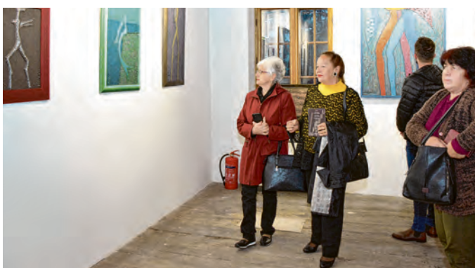
Nesvakidašnja prilika za susret s lupinizmom