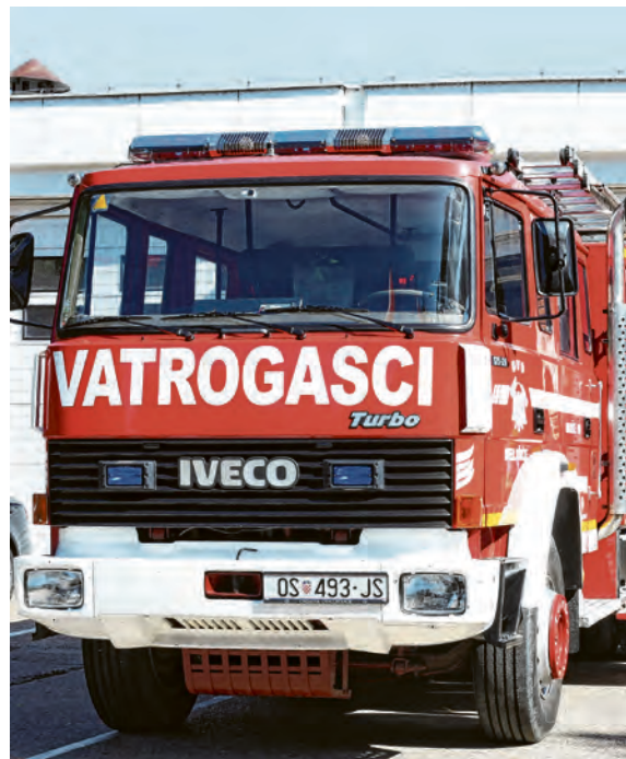
Dan otvorenih vrata u DVD Belišće

nji dio proslave 140. obljetnice bio je u petak, 27. rujna, uz postrojavanje ispred vatrogasnog spremišta te intoniranje hrvatske i vatrogasne himne, nakon čega je nekoliko belišćanskih vatrogasaca otišlo do gradskog groblja kako bi položilo vijenac za sve pokojne članove.