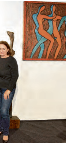
sioniran novim storom