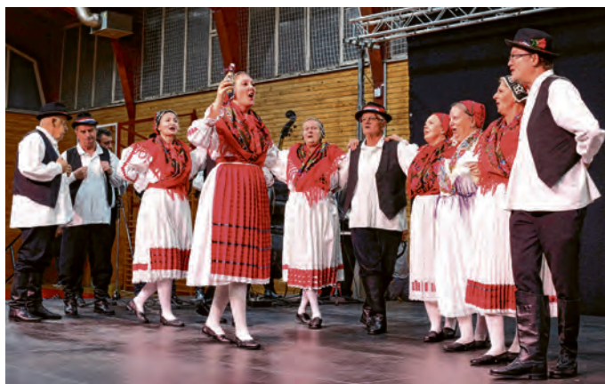
Gosti iz Virovitice prikazali su dio svog nasljeđa