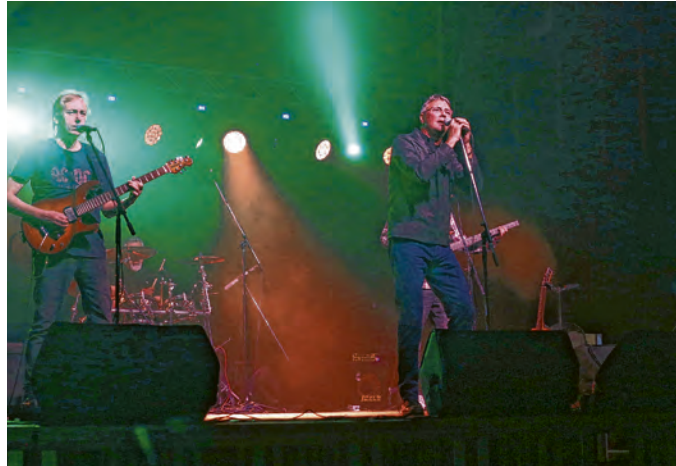
Hari Rončević raspjevao je belišćansku publiku

Jedan od najistaknutijih i najpopularnijih splitskih kantautora koji se ovom prigodom prvi put predstavio belišćanskoj publici, razgalio je okupljene i kvalitetom svojih izvedbi potvrdio zašto već trideset godina ima neprijepornu ulogu na domaćoj glazbe-