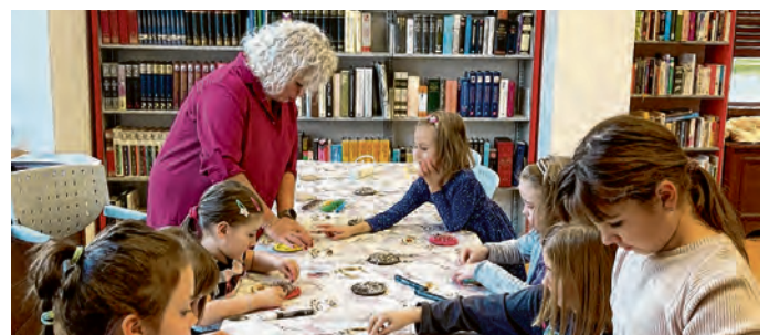
Kreativna radionica u Knjižnici