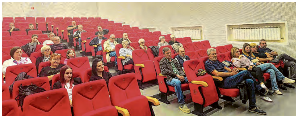
Sva prezentirana izvješća prihvaćena su jednoglasno