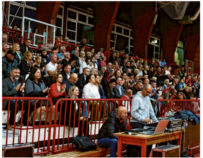
Posjetitelji su uživali u izvedbama čuvara tradicije