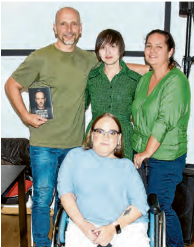
U društvu naših knjižničarki