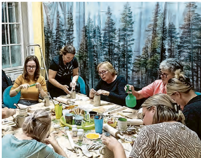
Radionica tečaja keramike oduševila je polaznike