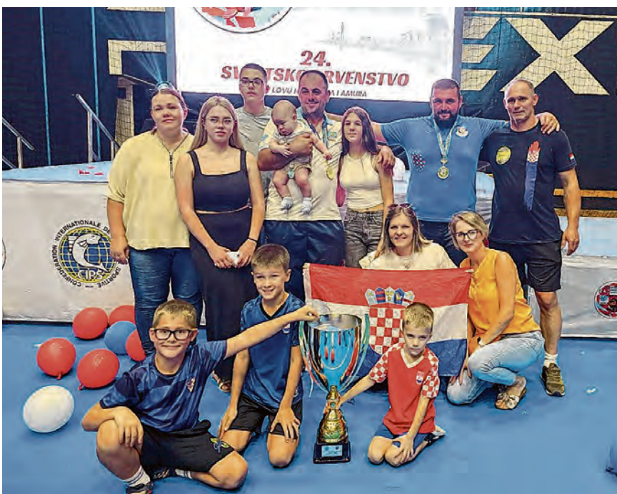
Hrvatska šaranska repka – prvaci svijeta 2024.godine