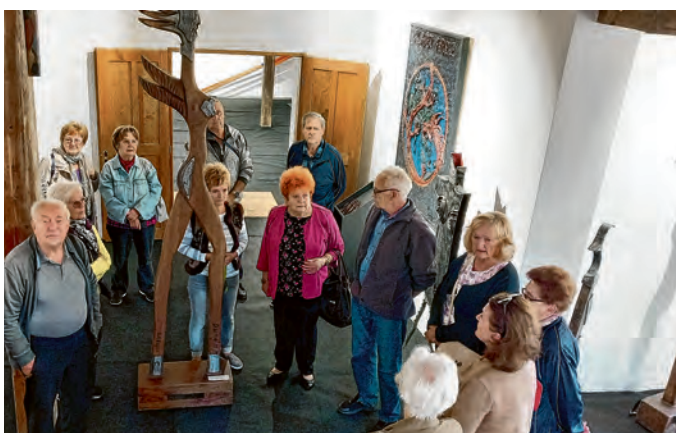
Belišćanski umirovljenici među prvima su grupno posjetili Stari mlin