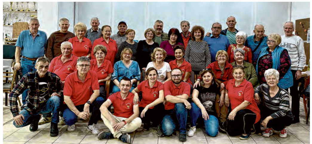
Sudionici Panona 2024. u Belišću