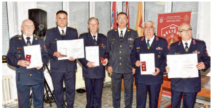
Dio dobitnika odlikovanja