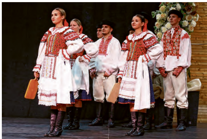
SKUD "Braća Banas" Josipovac Punitovački