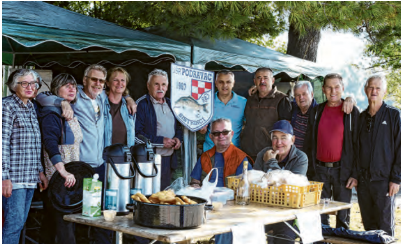
Članovi UŠR-a Podravac Bistrinci