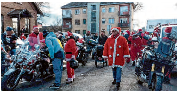
Motomrazovi uvijek su prava atrakcija