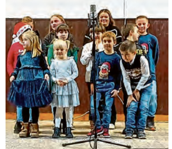
Mali Tiborjančani donijeli su radost i toplinu