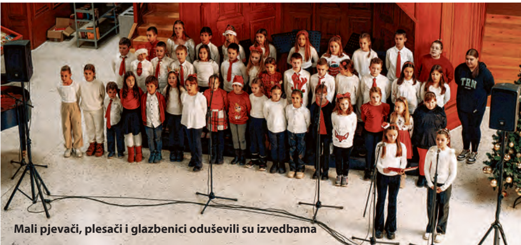
Mali pjevači, plesači i glazbenici oduševili su izvedbama