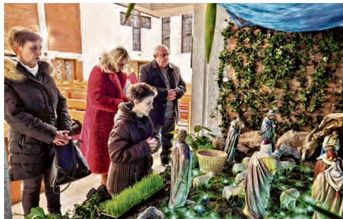
Poklon malom Isusu u jaslicama