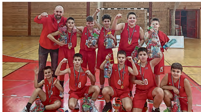
Pobjednici Božićnog turnira Belišće 2024.

T radicionalni Božićni košarkaški turnir održan je 21. i 22. prosinca u školskoj dvorani u Belišću. Belišćanima su tom prigodom u gostima bile ekipe Crikvenice, Broda i Vrijednosnica Osijek, a turnir je bio organiziran za dječake U13 (2012./2013. godište). Prvog dana turnira, u subotu, odigrane su polufinalne utakmice, u kojima su postignuti sjedeći rezultati: Belišće - Brod 66:46, Crikvenica - Vrijednosnice 37:56. U utakmici Belišće - Brod učinak je za domaćine bio: Zbanatski 13, Brkić 10, Vidaković 12, Vukobratović 4, Kuna 10, Kalazić 8, Anočić, Poštić 6, Pavin 3, Šmider. Nedjelja je donijela utakmice za plasman.