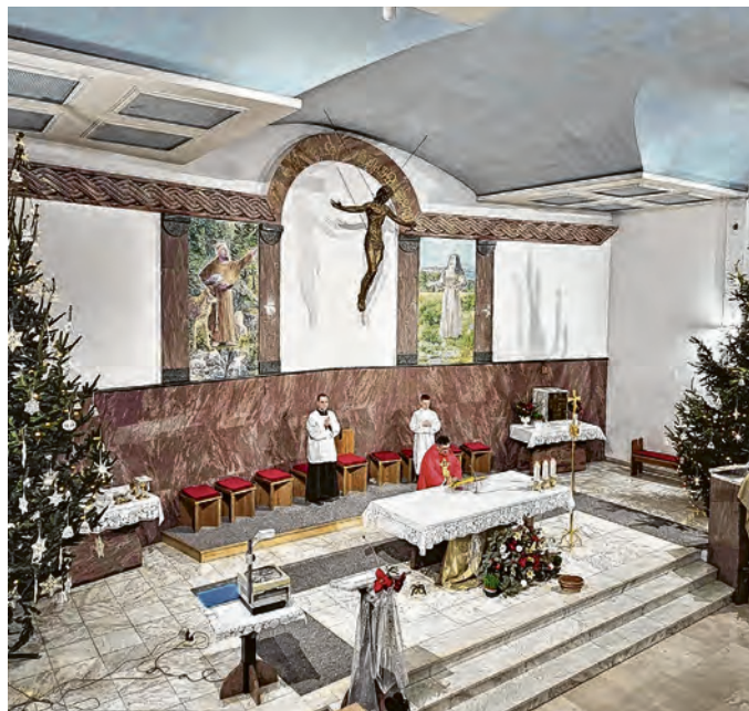
Vjernici su se okupljali na božićnom bogoslužju

luka te nešto malo dodatka. - To je recept da bi fiš-paprikaš bio prva liga! - otkrio je kuhar Vučetić, koji je fiš za 600 porcija Belišćanima pripremao puna tri sata. Prije samog ručka s građanima svim nazočnima božićnom i novogodišnjom čestitkom i prigodnim riječima i željama obratio se gradonačelnik Belišća Dinko Burić.