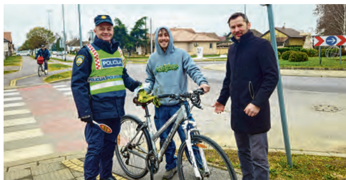
Preventivna akcija u prometu u Belišću

Grad Belišće i nadalje će provoditi nacionalne i regionalne preventivne projekte koji su u skladu sa strateškim ciljevima i prioritetima Policijske uprave osječko-baranjske i Policijske postaje Belišće, a još jedna u nizu takvih tradicionalnih akcija održana je u četvrtak, 26. prosinca, na Blagdan svetog Stjepana u Belišću, kada su vozačima uz informacije o preventivnim akcijama podijeljeni i poklon-paketi.