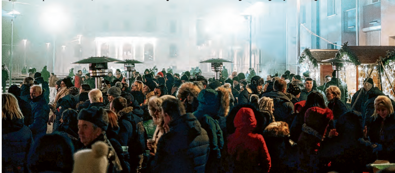
I ove godine brojni su građani uživali u novogodišnjem dočeku