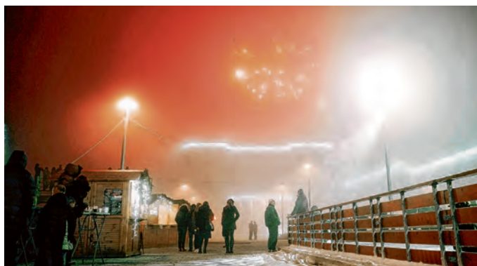
Vatromet je prošarao nebo iznad grada