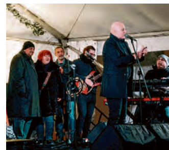
Svojim sugrađanima Novu godinu prvi je čestitao gradonačelnik Dinko Burić