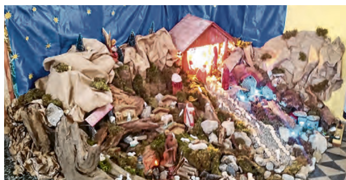
Jaslice u Bocanjecima uvijek privlače puno pozornosti