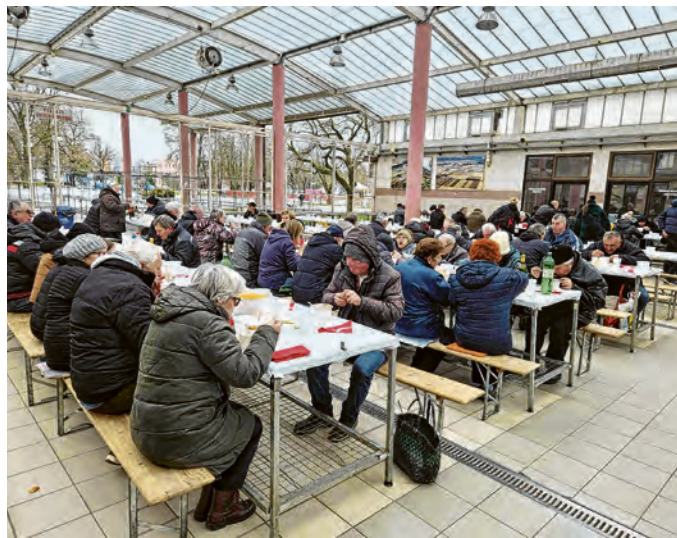
Brojni građani okupili su se na ručku u Tržnom centru