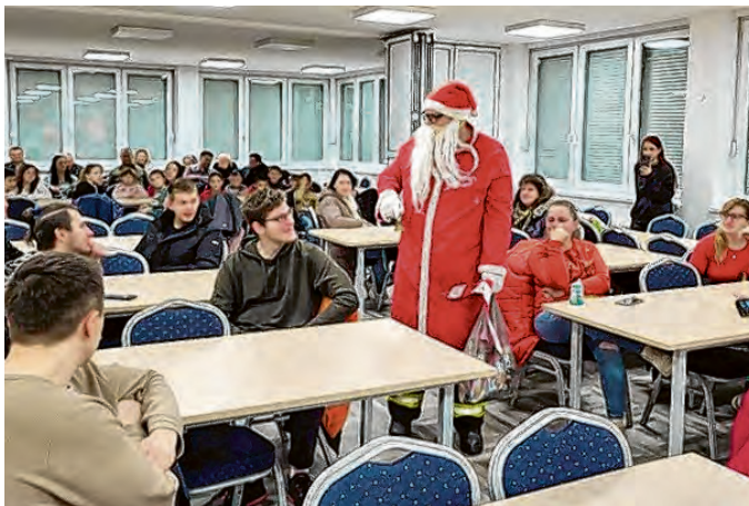
Blagdanski domjenak DVD-a Belišće