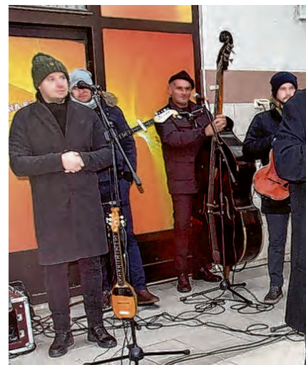
Blagdansku čestitku okupljenima uputio