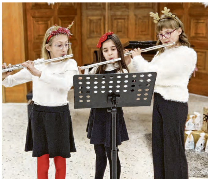
Svečani javni sat puhačkog odjela

U predbožićnom duhu 12. prosinca održan je svečani javni sat puhačkog odjela u Paleju Belišće. Taj je glazbeni događaj bio kao dar u blagdanskoj atmosferi, gdje su mladi glazbenici Glazbene škole Valpovo i Belišće, koja djeluje pri Osnovnoj školi Matije Petra Katančića Valpovo, svojim izvedbama donijeli radost i veselje svima. Uz božićne melodije i raznolike skladbe, učenici puhačkog odjela pokazali su vidljivi napredak i predanost, a publika im je pružila podršku pljeskom. Bio je to savršen način da se započne predblagdansko razdoblje - glazbom koja