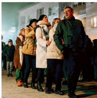
Belišćani su plesom ispratili staru i dočekali novu godinu