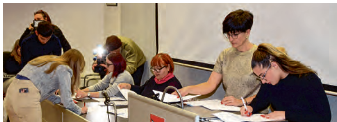
Svečanost potpisivanja ugovora sa studentima