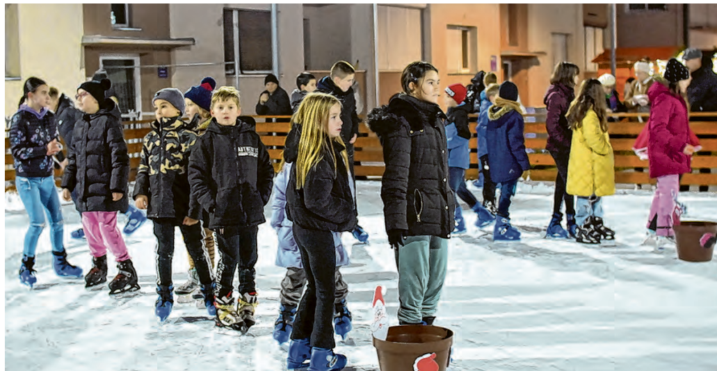
Klizalište je bilo omiljena lokacija ovog Adventa