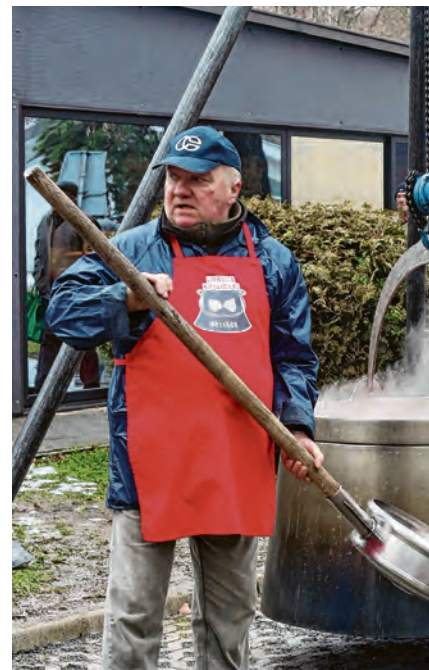
Besplatni fiš za građane spremao se u 6