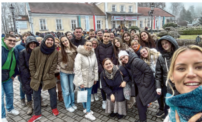
„Mirovci“ su posjetili i mnoge znamenitosti Krakova

U ozračju zajedništva i radosti, prekrasnim božićnim skladbama članovi CPD-a MIR Belišće i ove su godine sa svojim brojnim sugrađanima podijelili duh Božića na svom tradicionalnom Božićnom koncertu u belišćanskoj župnoj crkvi u petak, 27. prosinca 2024. Vrhunskim glazbenim izvedbama „mirovci“ su proslavili Isusovo rođenje, a u tome su im se pridružili i posebni gosti: Zbor Preslavnoga Imena Marijina Osijek.