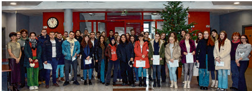
Grad Belišće osigurao je stipendije za ukupno 74 studenta

Kako je ovom prigodom u obraćanju okupljenima naglasila zamjenica gradonačelnika Ljerka Vučković, Grad Belišće nastavlja podržavati obrazovanje i budućnost svojih mladih sugrađana, osiguravši stipendi-