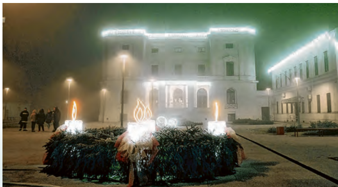
Čarobni blagdanski ugođaj u našem gradu