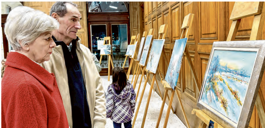
Izložba Boje zime u Paleju Belišće