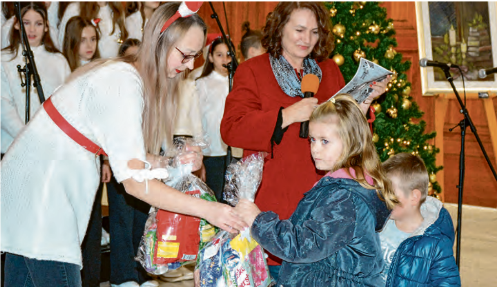
Podjela nagrada najboljim tragačima za blagom