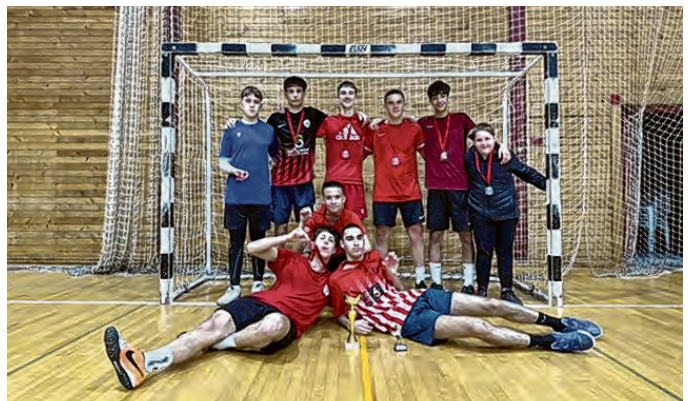
Prvaci Baraber Cupa su ekipa Crvenih golubova