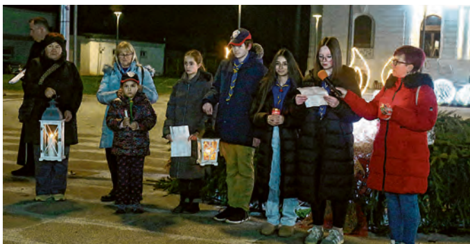
Betlehemsko svjetlo u Belišće su donijeli izviđači