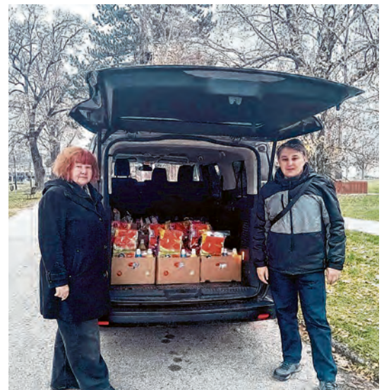
Paketima je obradovano 13 obitelji u potrebi