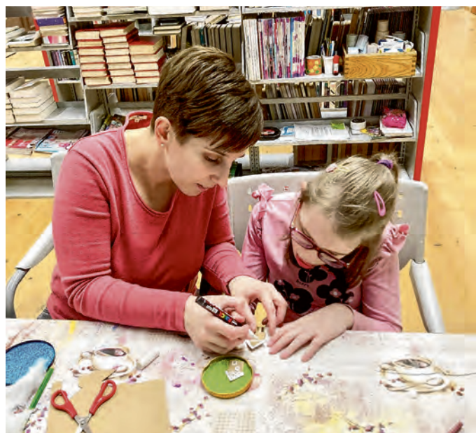
Božićna kreativna radionica