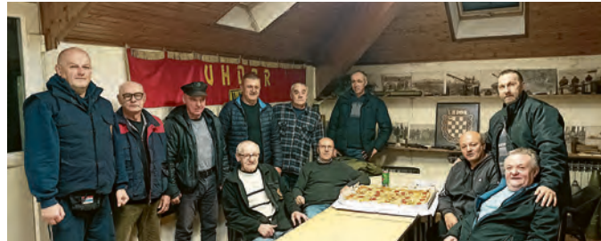
Božićni domjenak UHDDR-a Belišće

Na skupštini je izraženo zadovoljstvo dosadašnjim aktivnostima Udruge te je članstvu detaljno prezentirano financijsko izvješće za 2023. Godinu, kao i aktiv-