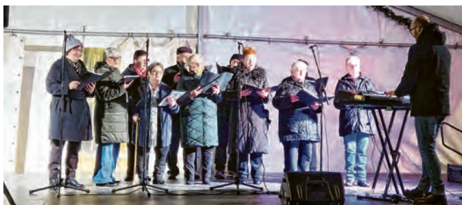
Nastup Zbora Matice na Adventu u Belišću