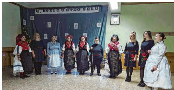
Božić u etno selu održan je 6. put