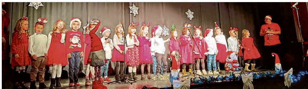
Božićni program belišćanskih vrtićaraca

Zadarski glumac i performer Enio Meštrović gostovao u Belišću