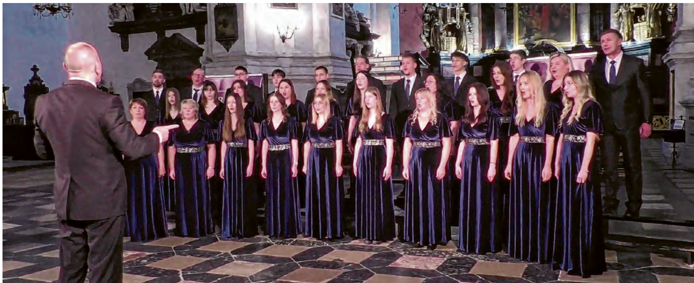
Nastup CPD-a MIR Belišće na 13. Advent&Christmas Choir Festivalu