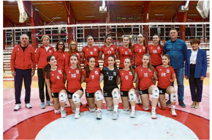
Belišćanske odbojkašice ponos su svoga grada