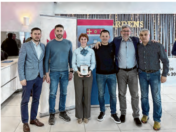
Baraberima je dodijeljena nagrada za promociju