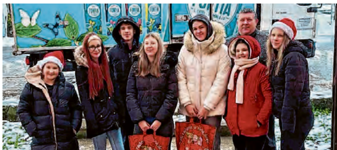
Općina Bizovac pomogla je članovima udruge "Plavci" iz Habjanovaca u darivanju sumještana

zovcu, za što je već ishođena građevinska dozvola.