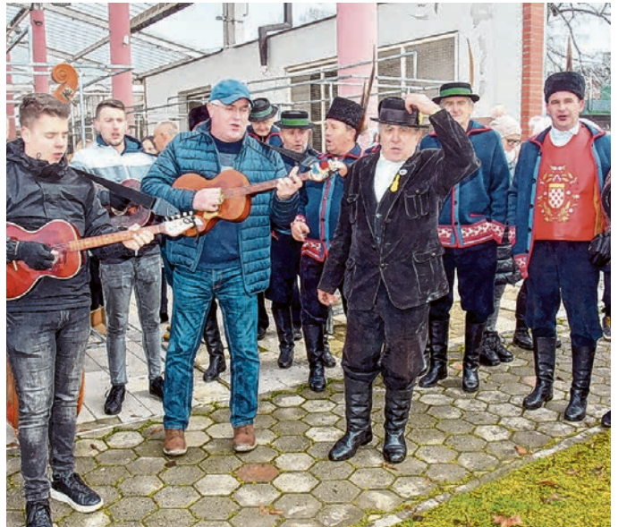
Podršku jahačima dali su i glazbenici