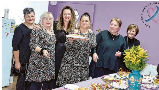
Proslava 1. rođendana Lige protiv raka Valpovštine

- U ožujku, listopadu i studenome obilježile smo Dan nar-