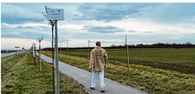
Duž biciklističke staze Kitišanci - Gat posađena su mlada stabla