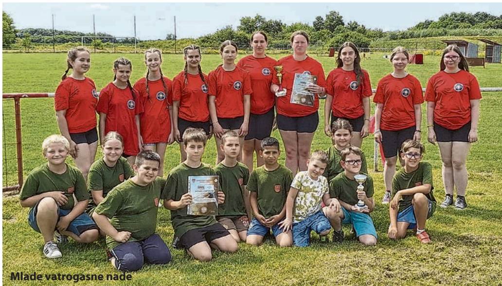
Mlade vatrogasne nade

Svoje aktivnosti nastavili su i nogometaši jer je stigao proljetni dio sezone 2023./24.,