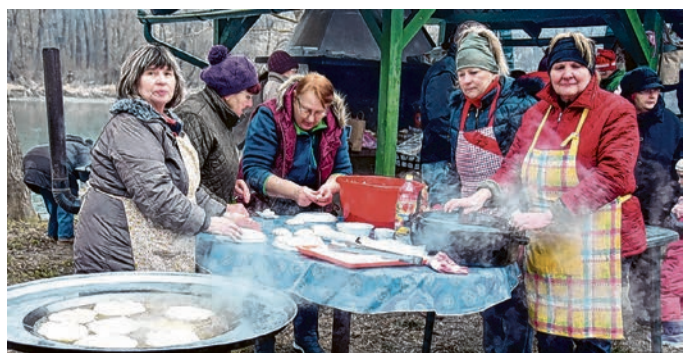
Babuške su se brinule za odličnu gastronomsku ponudu