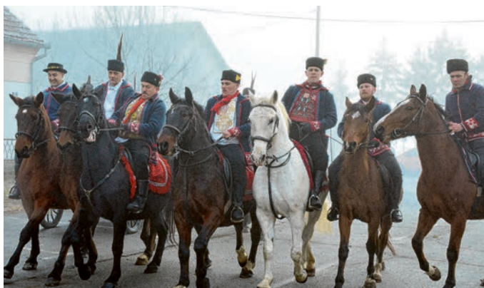
Okupljanje sudionika bilo je u Bistrincima