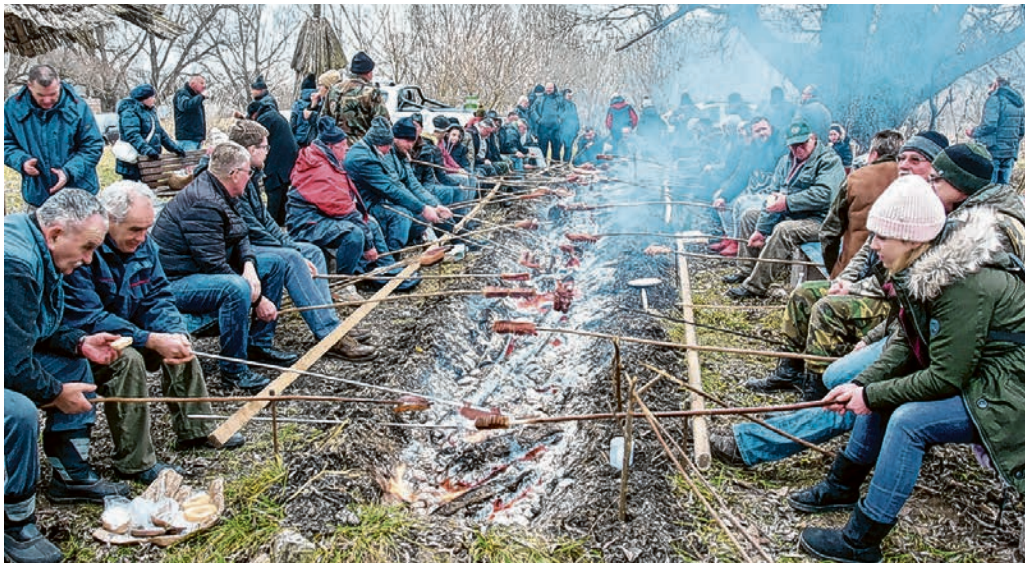
Na Slaninijadi je sudjelovalo 40 natjecatelja iz Slavonije i Baranje te Mađarske