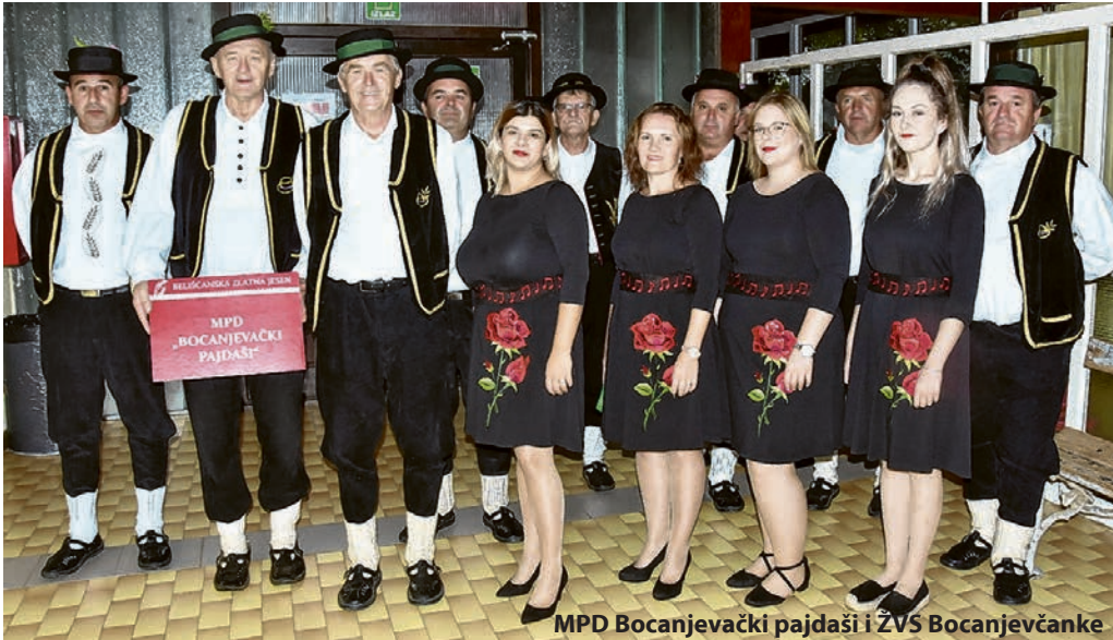
MPD Bocanjevački pajdaši i ŽVS Bocanjevčanke