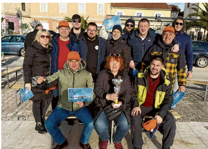
Gosti iz Belišća na proslavi Dana grada Biograda na Moru