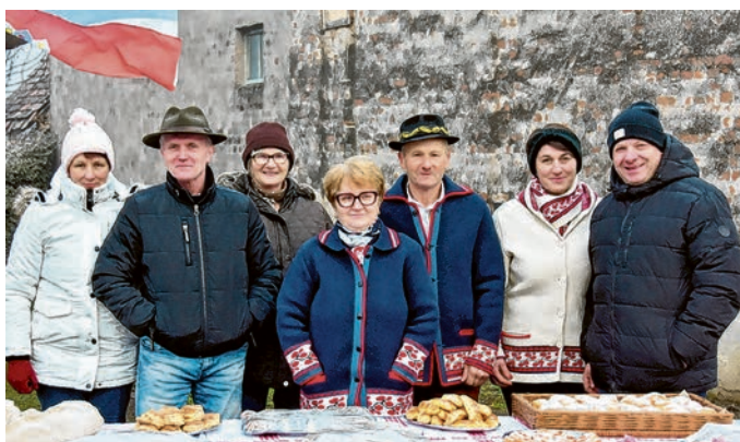
Odličnim domaćinima pokazala se i bistrinačka obitelj Majerić