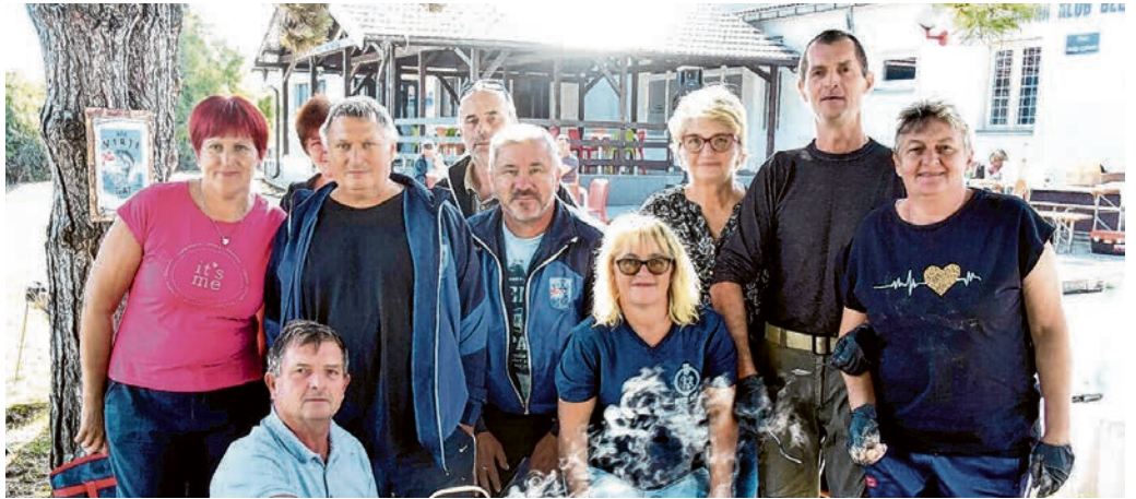
Članovi UŠR-a Virje Gat na obilježavanju Međunarodnog dana rijeke Drave

su ponudili i pečene kucine. Prošla je godina za njih bila važna i zbog obilježavanja 30. obljetnice postojanja udruge, na kojoj se posebno zahvalilo utemeljiteljima UŠR Virje, svim članovima i onima koji na bilo koji način pomažu rad gatskih ribiča. Posljednji prošlogodišnji mjeseci bili su po-