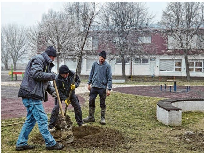
Ozelenjen je i prostor oko Dječjeg vrtića