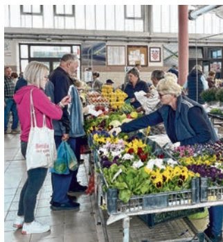
Problemi s krovom koje prokišnjava odlaze u prošlost

Prema informacijama iz tvrtke Kombel d.o.o., trenutčno je zamijenjen polikarbonatni dio krova i napravljena je nova hidroizolacija betonskog dijela krovišta. Radovi su privremeno zaustavljeni radi isušivanja zidova i stropa nakon zaustavljanja prodora vode kao i testiranja izdržljivosti novoizvedenih komponenti. Realiziranost projekta trenutačno iznosi oko 80 %, a na ljeto bi trebalo početi saniranje vertikala za odvod vode i relativno sitniji popravci izolacije ravnog dijela betonskog krovišta kao i polikarbonatnog krova ako se za to ukaže potreba. - Nositelj cijelog ovog projekta je Dom Upraviteljstvo d.o.o., izvođač radova je KMD servis d.o.o. Belišće, a ugovorena cijena radova je 206.000,00 eura s PDV-om, s tim da se od nekih radova tijekom izvođenja odustalo, jer nisu bili potrebni zato što oštećenja nisu bila toliko ve-