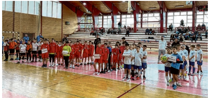
Turniri su okupili mnoge male zaljubljenike u nogomet