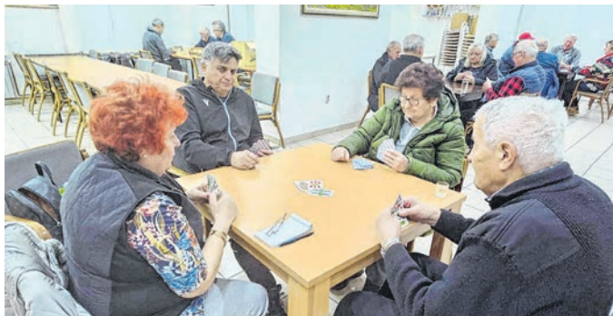
Odmjeravanje snaga u turnirima

D ruženje nas održava radosnijima i zdravijima, uzrečica je to osobito draga i bliska članovima Matice umirovljenika grada Belišća, koji su u subotu, 18. siječnja, počeli i 2025. godinu svojim tradicionalnim turnirom u pikadu, šahu i belotu. Četrdesetak umirovljenika provelo je subotnje poslijepod-