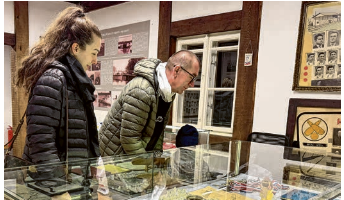
Svaka lokacija na svoj je način bila atraktivna

Belišćanska muzejska noć ove godine obogaćena novom atraktivnom lokacijom