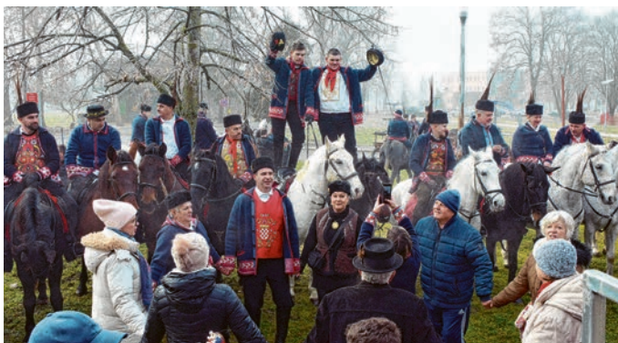
Pjesma i ples kod belišćanskog tržnog centra