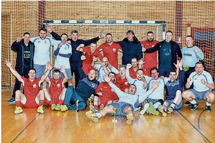
Pobjednici Veteranskog turnira ekipa NK Belišće s veteranima Omiša