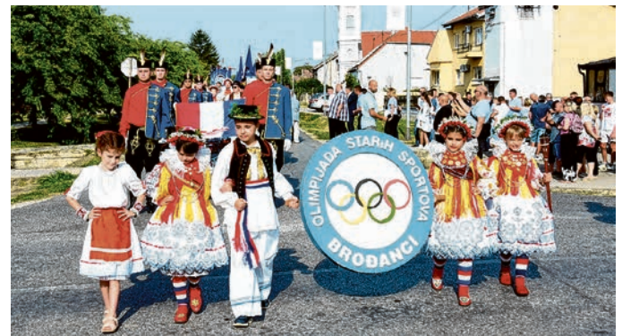
Olimpijada starih sportova atraktivna je i nakon pola stoljeća