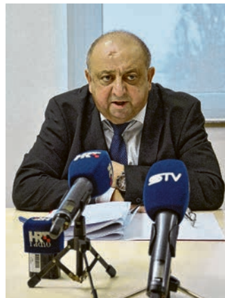
Gradonačelnik je najavio kandidaturu za četvrti mandat

Također, u posljednjih je nekoliko mjeseci prema navedenim preporukama na području Belišća posađeno 866 novih stabala, a uz to će se posaditi i tzv. zelene bari-