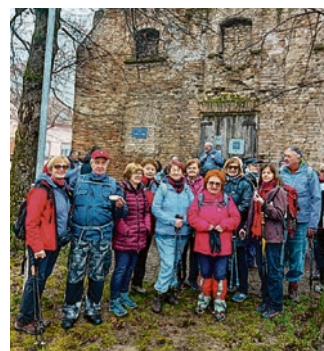
Beliščanski planinari na izletu

Nage. Ekipa je imala pravu zimsku idilu, a hodali su šumskim putem pa uz brdo planinarskom stazom dolje gore i dobro gazili po snijegu prešavši 17 km. Treći izlet bio je na domaćem terenu. Petnaest planinara se okupilo kod Lidla i krenuli su na hodanje prema Metlincima - Marjančaci - Salaš Cveniće. Domaćin je svoje planinare dočekao s punim stolom hrane, a povratak je bio preko Zvjerinja-