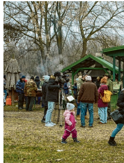
Unatoč hladnoći, posjetitelji su i ove godine