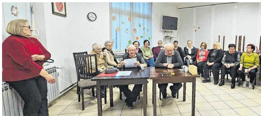
Belišćanski umirovljenici raduju se druženju