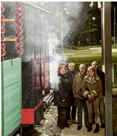
Guco uvijek probudi lijepa sjećanja