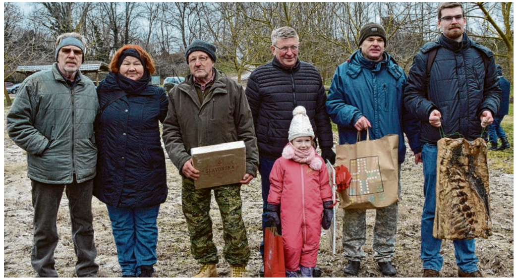
Najbolji majstori slanine primili su nagrade