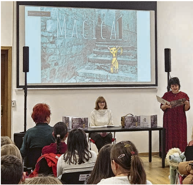
Predstavljanje slikovnice Mačica