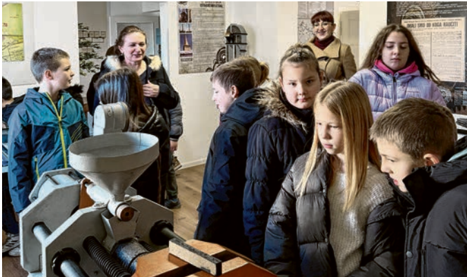
Matineju su otvorili učenici trećih razreda