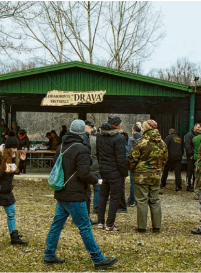
Slanine u velikom broju stigly na Slaninijadu