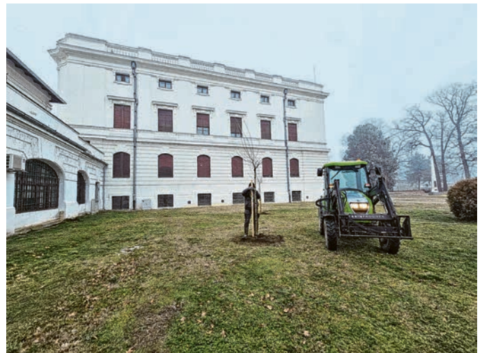
Stabla su posađena u parku iza Palače Gutmann