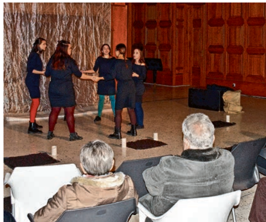
Antigona u Palači Gutmann