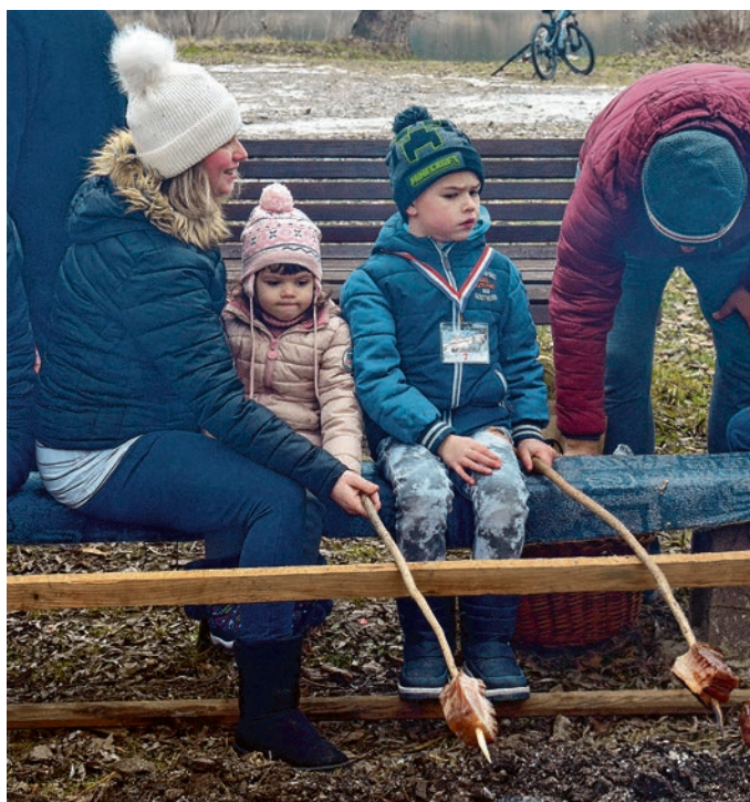
Pečenje slanine uči se od najranije dobi