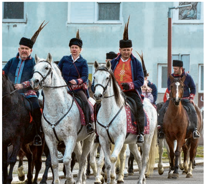
Jahači su stigli iz svih dijelova Slavonije i Baranje