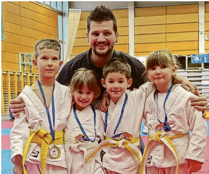
Mali borci beliščanskog Sankaku kluba s trenerom