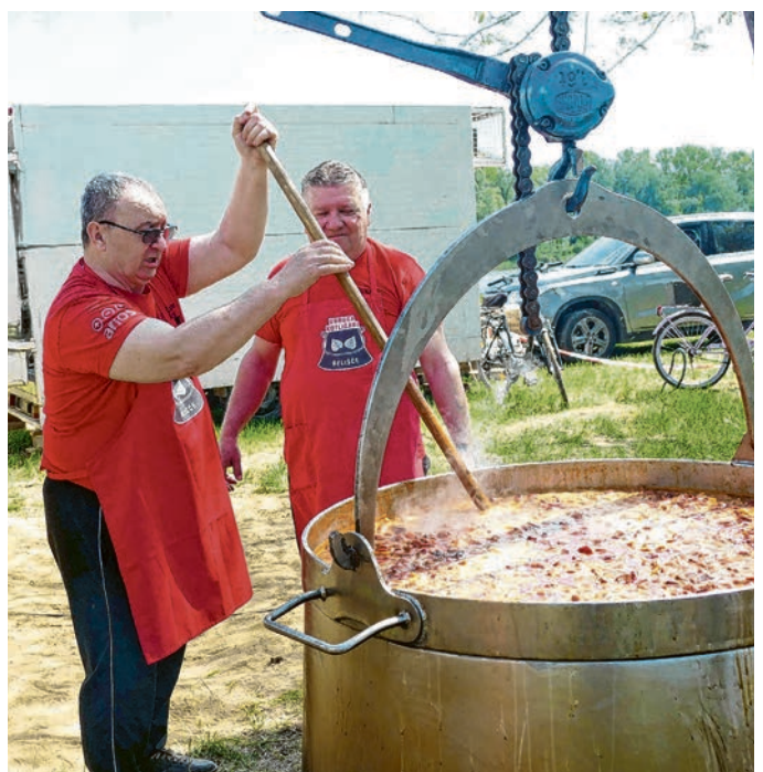
Kotličari su nezaobilazni dio promocije tradicijske gastroponude