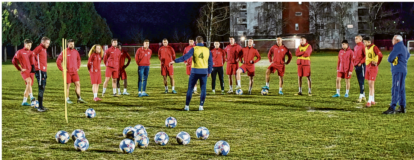
S puno optimizma belišćanski nogometaši kreću u nastavak prvenstva

Šimić - Jelić u svom izvješću ističe i Grad Belišće, odnosno gradski projekt izgradnje pomoćnog nogometnog terena s umjetnom travom, vrijedan 388.000 eura, a koji će biti na korist svim belišćanskim sportašima, posebno onima u NK Belišće. Zahvalnost Gradu Belišću je tim veća jer će se ovim projektom osigurati bolji uvjeti za rad i trening svih selekcija, u svim vremenskim uvjetima što posljedično doprinosi i većoj mogućnosti razvoja mladih talenata, ali i organizacija turnira i natjecanja tijekom cijele godine.