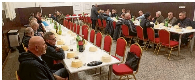
Skupština UUPBV-a u Tiborjancima