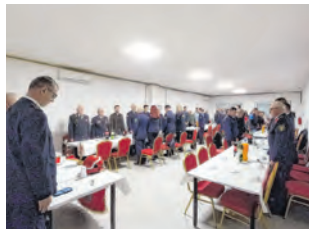
U obnovljenom domu vatrogasci DVD-a Vinogradci dobili su bolje uvjete rada

zirala VZG Belišće. Zahvalio je Nogometnom klubu koji im je ustupio prostorije za rad tijekom 2024. godine, jer se objekt Društvenog doma u sklopu kojeg je vatrogasni dom renovirao. Sada je objekt