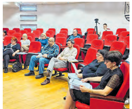
U 45 mjeseci belišćansko se Gradsko vijeće sastalo 50 puta