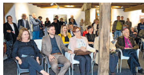
Publika je uživala u izložbi i koncertu

N akon što je u listopadu 2022. godine prvi put svoja djela izlagao u Belišću, ugledni likovni umjetnik svjetskog glasa Peter Pierre Weisz u petak, 14. ožujka ponovo se predstavio belišćanskoj publici, no ovaj put u obnovljenom galerijskom prostoru zgrade Starog mlina.