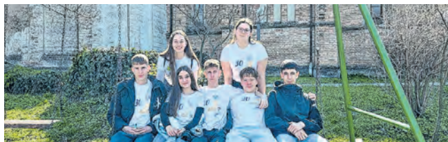
Belišćanski framaši na duhovnom kapitolu

Framaši na XVII. Područnom duhovnom kapitolu