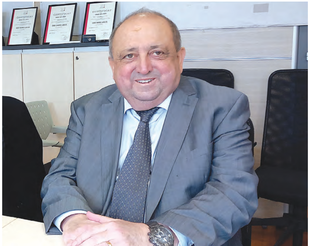
Gradonačelnik Dinko Burić izrazio je zadovoljstvo rezultatima prošle godine