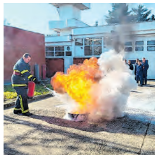
Kandidati su obavili i praktičnu obuku

va VZG Belišće, a na temelju Pravilnika o programu osposobljavanja i usavršavanja vatrogasnih kadrova, kandidati su uz teorijski dio obavili praktičnu obuku u rukovanju i uporabi vatrogasnih aparata za početno gašenje, a potom korištenje i način rada s izolacijskim aparatima u potencijalnom prostoru ugroženim od požara i obavili obuku pravilnog penjanja na ljestvama.