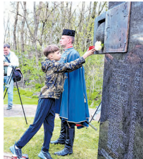
Ruže na spomenik položili su članovi obitelji poginulih branitelja