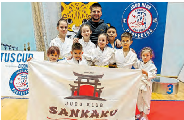
Članovi Judo kluba Sankaku Belišće nastavljaju odlične rezultate