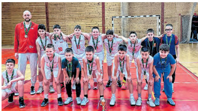
Dječaci U13 zabilježili su treći uzastopni naslov prvaka

Još jednom titulom prvaka možemo se pohvaliti u ovoj sezoni. Nakon što su se seniori