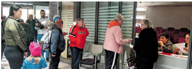
Umirovljenici su po uskrsnice stigli u Gradsku upravu u Belišću