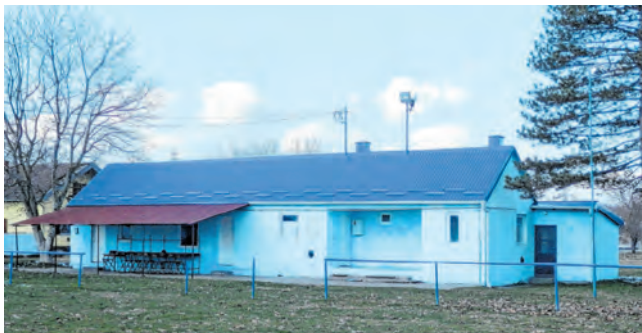
U prvoj fazi uložiti će se 26.000 eura