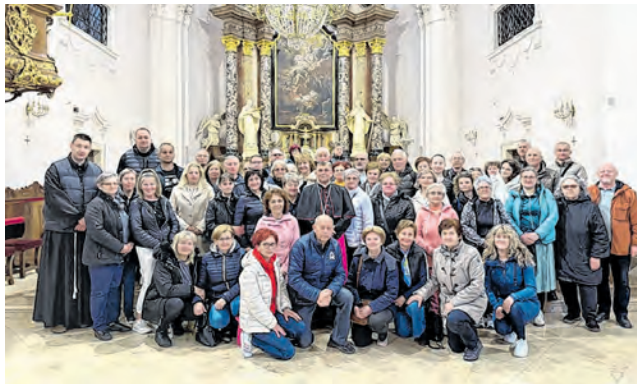
Hodočašće u Pleternicu i Požegu