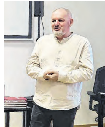
Predstavljanje Misala kneza Anža Frankopana