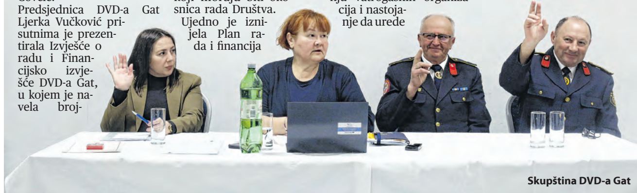
Skupština DVD-a Gat