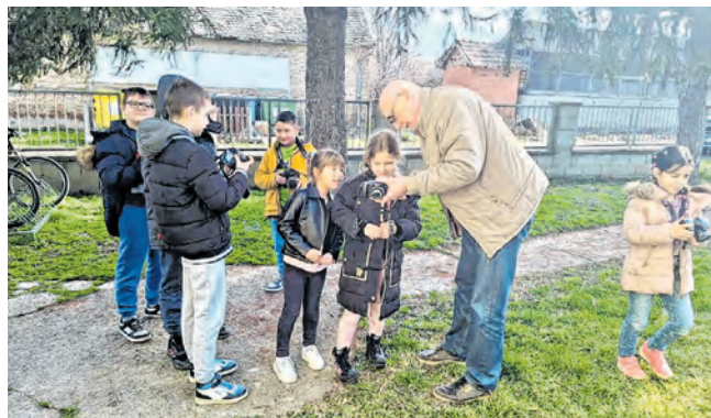
Radionica fotografije u Bocanjevima