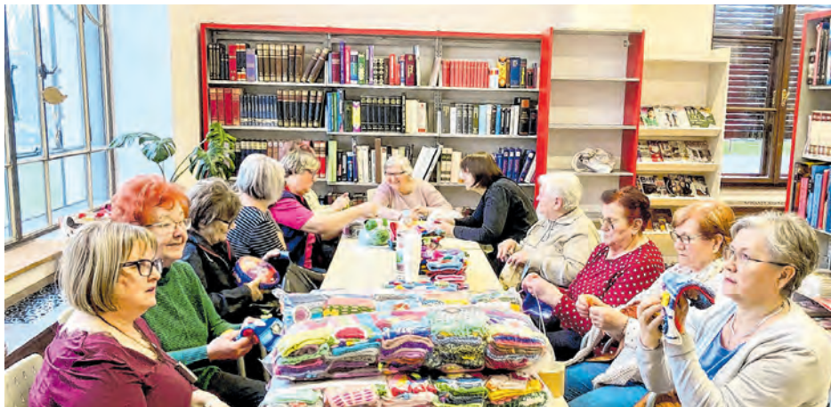
Na Štrikeraj čitaonici uvijek je veselo