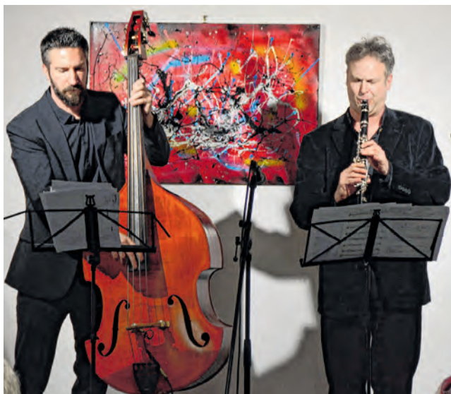
Zagreb Klezmer Trio ovaj je put nastupio kao duo

polovine 20. stoljeća. Sudjelovao je na više od 200 samostalnih i skupnih izložbi diljem svijeta i Hrvatske, a njegovi radovi dobili su priznanja i recenzije uglednih likovnih kritičara. Djela mu se nalaze u muzejima diljem svijeta. Osim umjetničkog djelovanja te humanitarnih aktivnosti Weisz je dao veliki doprinos uspostavljanju diplomatskih i političkih odnosa između Izraela i Republike Hrvatske.