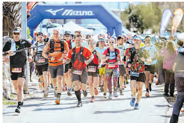
Baraberi su i u ožujku zabilježili niz aktivnosti