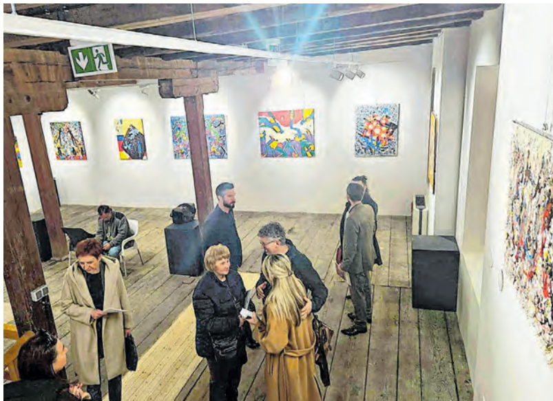
Stari mlin pokazao se kao idealna lokacija za izložbu