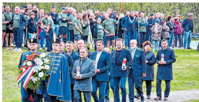
Poginulim herojima poklonile su se i delegacije gradova i općina Valpovštine, Donjomiholjštine i Baranje