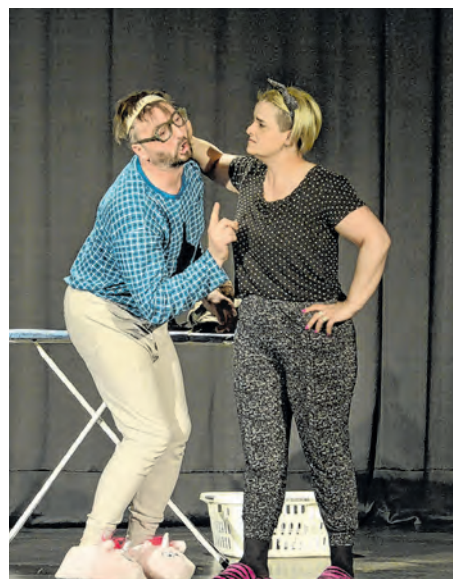
"Gola istina" do suza je nasmijala publiku