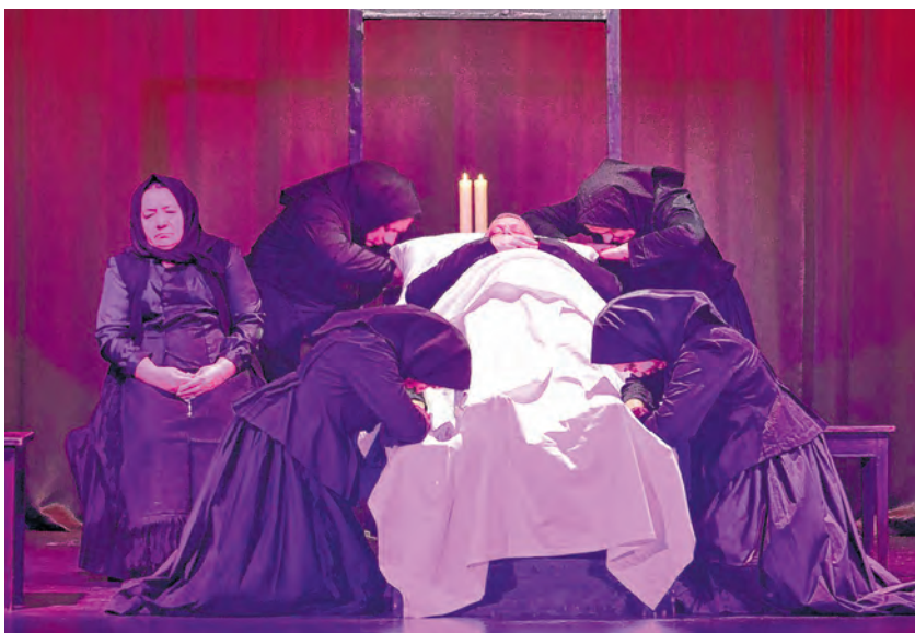
Predstava "Narikače" moderna je ljubavna priča kroz tradicionalni običaj