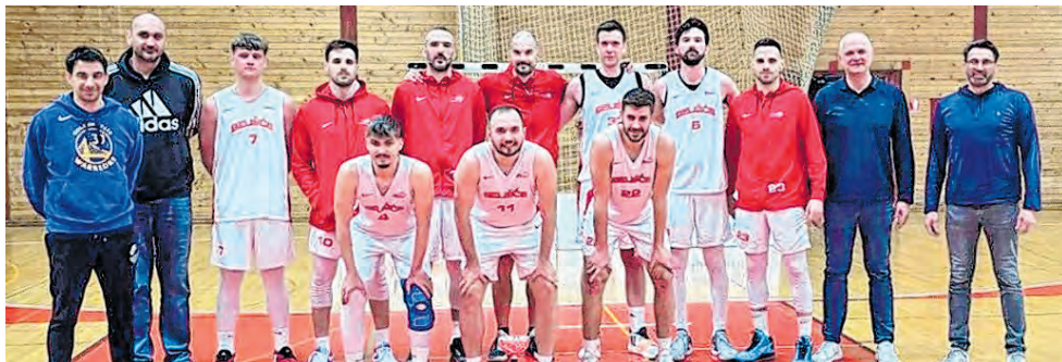
Seniori KK Belišće prvaci su Druge lige Istok