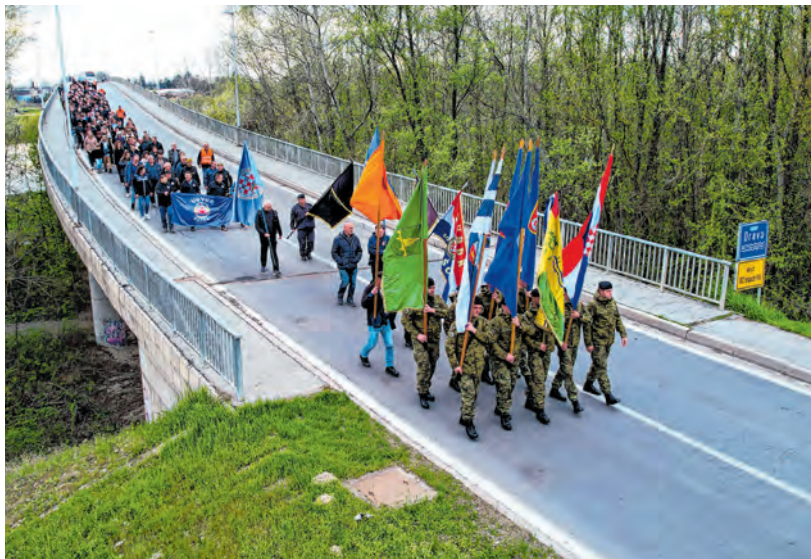
Svečani mimohod od mosta do spomenika u Baranji