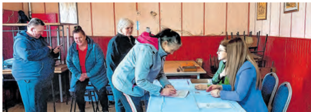
Podjela uskrsnica u Veliškovcima