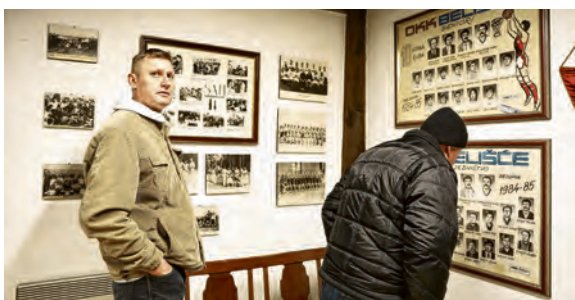
Stare fotografije uvijek pobude zanimanje