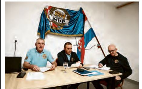
Skupština UUPB-a Valpovštine