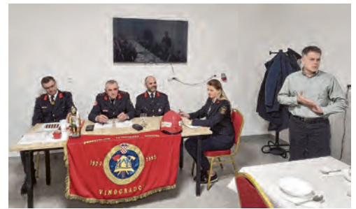
Skupština DVD Bistrinci