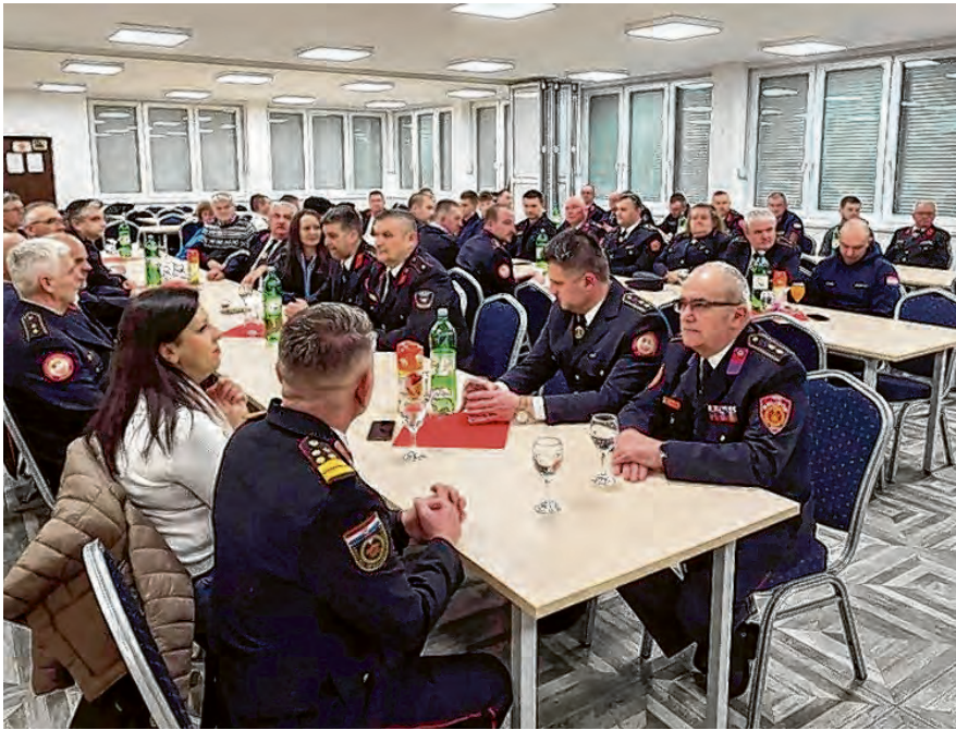
Skupština DVD Belišće