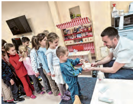
Upoznavanje sa zanimanjem farmaceuta

Nakon što su u bizovačkom vrtiću u sklopu obilježavanja Dana bolesnika (11. veljače) formirali nove centre aktivnosti - Dom zdravlja i Ljekarnu - u srijedu, 18. veljače