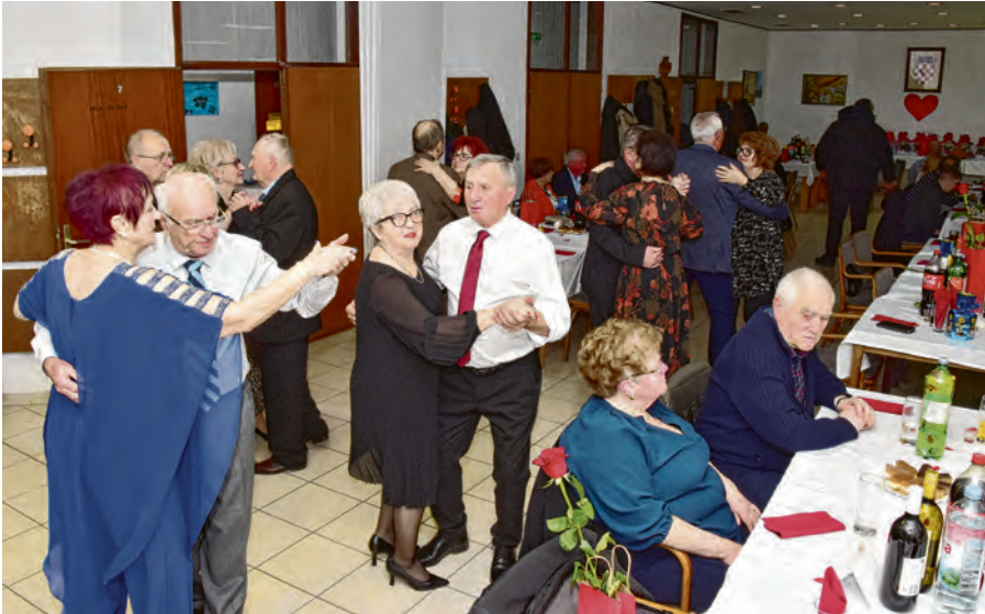
Proslava uz pjesmu i ples