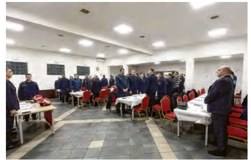
Skupština DVD Vinogradci