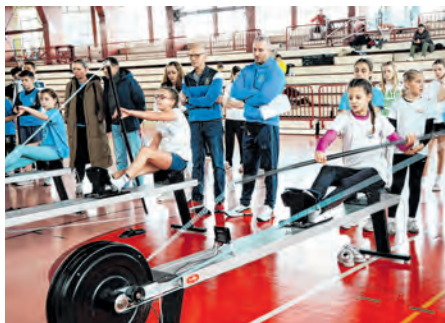
Kajakaši su potvrdili da su u odličnoj formi

G radsko-sportska dvorana u Belišću bila je u sobotu, 14. veljače 2026. godine domaćin natjecanja na kajakaškim i kanuističkim ergometrima. Riječ je o pilot-projektu te ukupno drugom ovakvom kupu u Hrvatskoj, što ovom događaju daje posebno značenje u razvoju kajakaškog sporta u našoj zemlji. Natjecanje je okupilo oko 60 sportaša iz više klubova: Kajak klub Marsonia, Kajak klub Olimpik, Kajak klub Aljmaš, Kajak klub Rab '83, natjecatelji iz SVU-a Đakovo te domaćini iz Belišća. Svi natjecatelji veslali su utrke na dionici od 500 metara, a publika je imala priliku uživati u dinamičnim i neizvjesnim nastupima u različitim dobnim kategorijama. Ovakva natjecanja iznimno su važna za kontinuitet trenažnog i natjecateljskog procesa, osobito tijekom zimskih mjese-