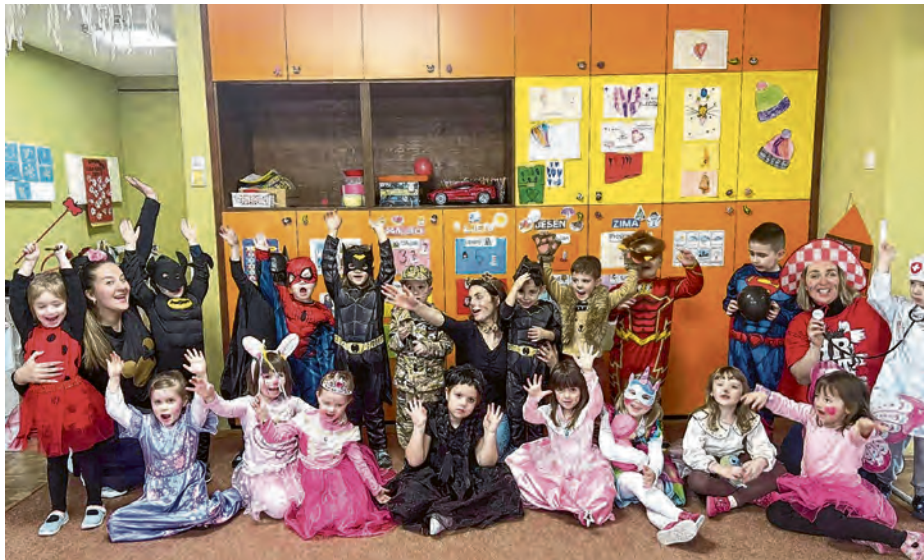
Maskenbal u bizovačkom vrtiću