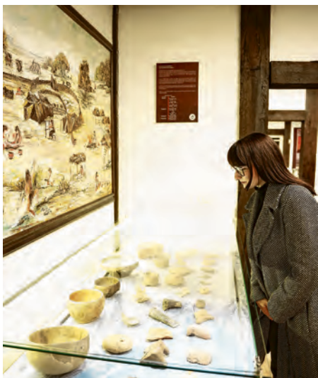
Svaka lokacija na svoj je način zanimljiva