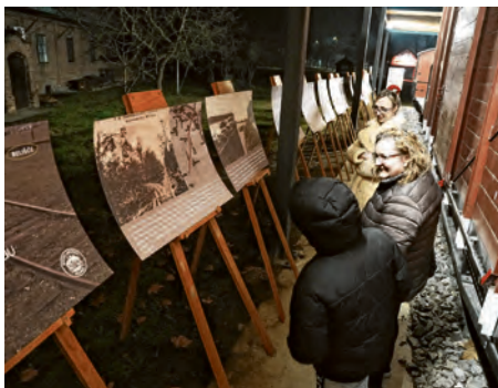
Spomen-vlak nudio je izložbu i film

I ove godine posljednjeg petka u siječnju od 18 do 22 sata Muzej Belišće postao je središte susreta kulture i umjetnosti u manifestaciji pod nazivom Belišćanska muzejska noć, kojom se i Muzej Belišće na simboličan način pridružuje velikom broju muzeja u Hrvatskoj u kojima se održava Noć muzeja. Belišćanska muzejska noć, manifestacija je koja svake godine okuplja ljubitelje umjetnosti, povijesti i kulture, a ova posebna večer bila je prilika da i naši muzeji postanu mjesta susreta, dijaloga i otkrivanja - otvoreni svima, u drukčijem svjetlu i iz nove perspektive. U Muzeju Belišće su ovogodišnjim programom željeli pripremiti nešto novo za svoje posjetitelje, nešto što će ostaviti dojam i razlog za priču i razgovor nakon ove večeri, poručila je ravnateljica Muzeja Belišće, Nada Milas Bosanac.