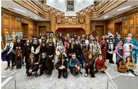
Koncert pod maskama