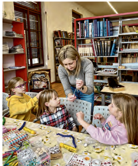
Mali Belišćani stvarali su svoje heroje