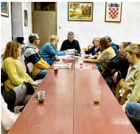
Bel-artovci stvaraju i dalje