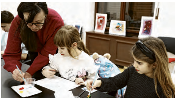
Radionica "Infrared Art"