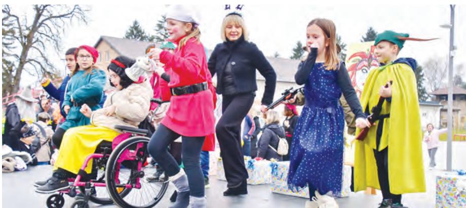
Najboljom skupnom maskom proglašen je 2.d razred