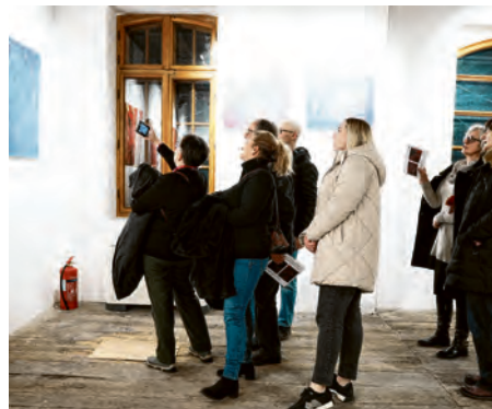
Stari mlin posebno je atraktivan izložbeni prostor