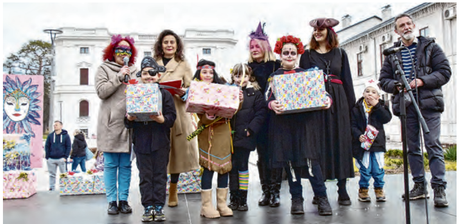
Najbolje pojedinačne maske posebno su nagrađene