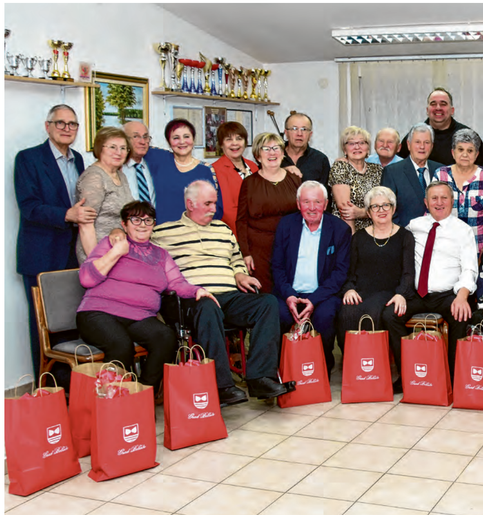
Svoje bračne jubileje proslavilo je 17 parova