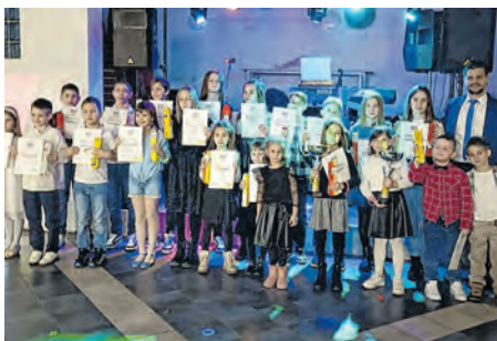
Judo klub Sankaku bilježi uspješnu godinu