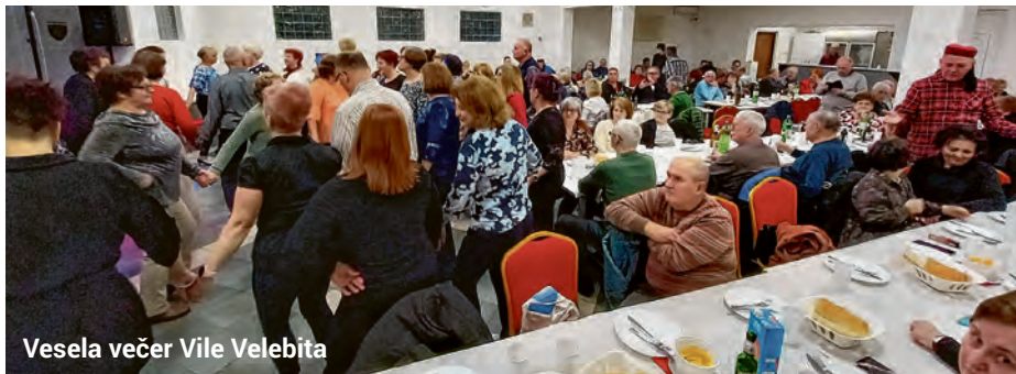
Vesela večer Vile Velebita

Na skupštini je istaknuta suradnja s Gradom Belišćem i Turističkom zajednicom grada Belišća te kuhanje na brojnim gradskim događanjima poput Pokladnog jahanja, proslave Dana grada, Dana hrvatskih