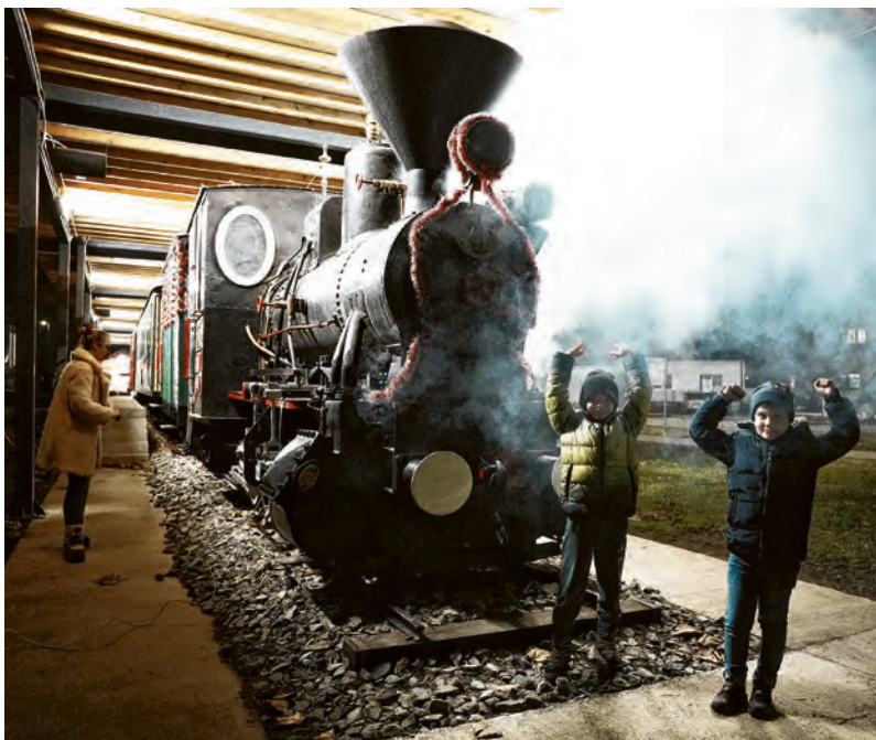
Belišćanska muzejska noć odvijala se na pet lokacija