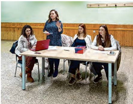
Skupština KUD-a Šokadija Bocanjevci

privlačenje novih i zadržavanje sadašnjih članova.