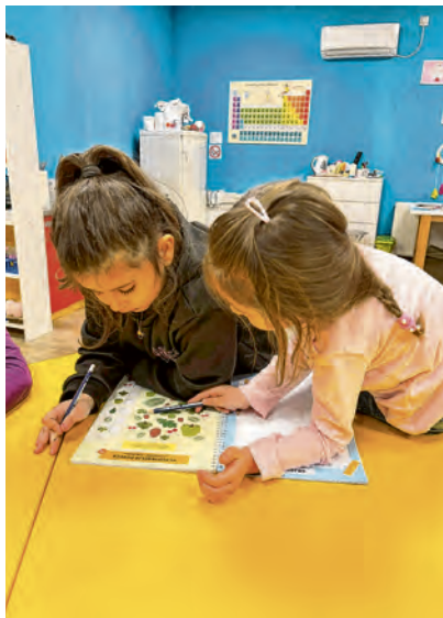
Tinker labs škola