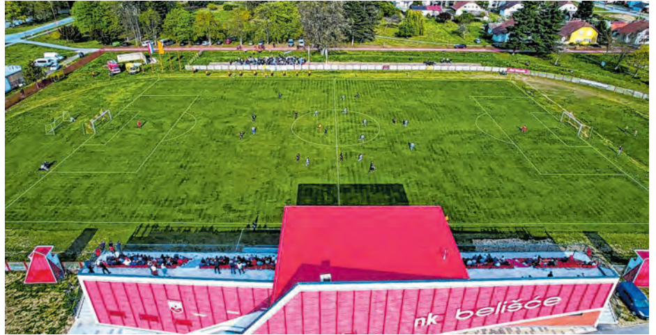
Gradskim stadionom u Belišću koristit će se i ŽNK LIO Osijek