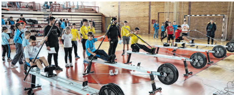
Na Kupu se okupilo oko 60 sportaša