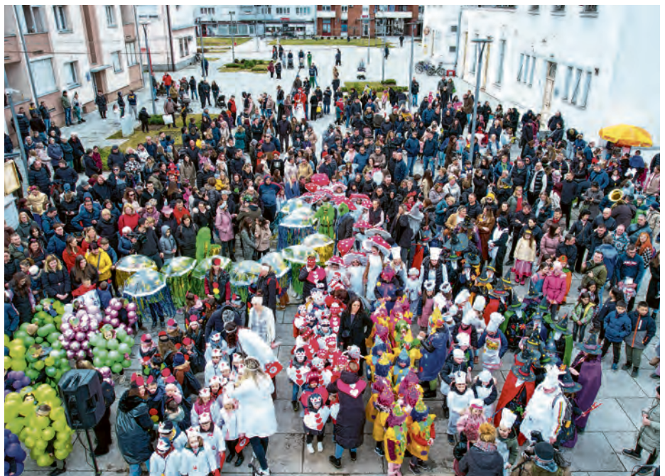
Velik broj građana stigao je na maskenbal