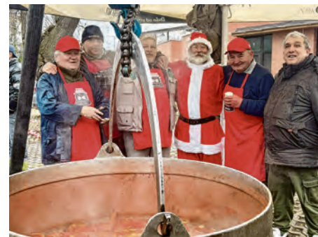
Kotličari kuhaju na brojnim gradskim događanjima

branitelja, Jesenskog festivala i tradicionalnog zajedničkog ručka na Badnjak. Udruga je organizirala i vlastite aktivnosti, među kojima se ističe devet. škola kuhanja s oko 70 sudionika te cjelodnevno druženje članova. Tijekom godine nastavili su jačati svoju prepoznatljivost kao važan promotor tradicijske gastroponude Belišća i okolice. Plan rada za 2026. godinu uključuje nastavak sudjelovanja na natjecanjima i manifestacijama, organizaciju škole kuhanja i kreativnih radionica, jačanje suradnje s lokalnim udrugama te dodatnu promociju udruge i tradicijskih jela iz kotlića u Belišću i diljem Hrvatske. Monika Đogaš