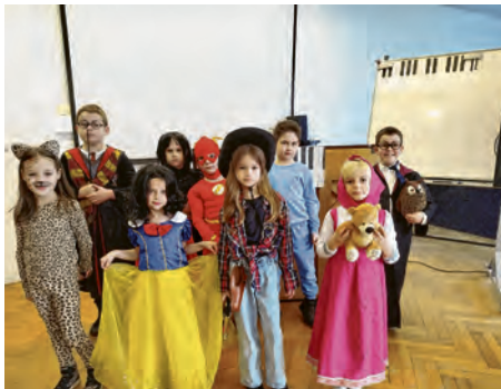
Maskirani polaznici glazbene igraonice

GLAZBENA ŠKOLA VALPOVO I BELIŠĆE UKLJUČILA SE U KARNEVALSKE SVEČANOSTI