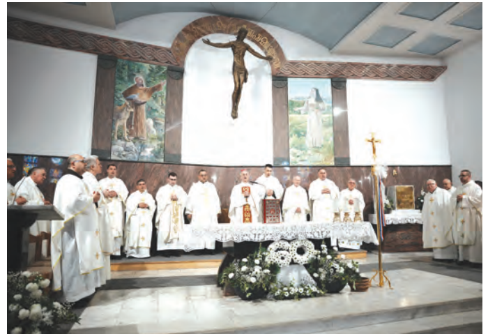
Svečano misno slavlje predvodio je mons. Ivan Ćurić