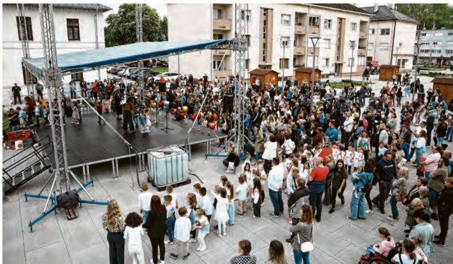
Program je pratio veliki broj građana

ZVUCI KOJI SPAJAJU – KONCERT PRETVORILI BELIŠĆE