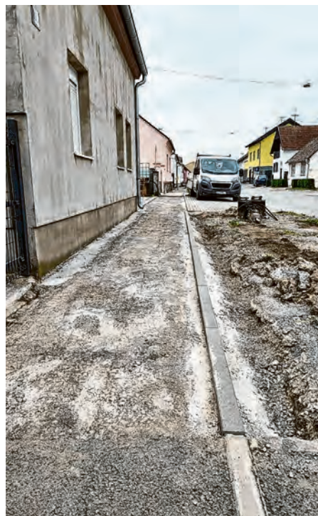
Rekonstrukcija pješačkih staza

U isto vrijeme Grad Valpovo krenuo je u rekonstrukciju pješačkih staza u Zrinsko-frankopanskoj i Kolodvorskoj ulici, za što su osigurana sredstva u gradskom proračunu.