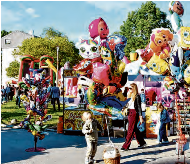
Šarenilu kirvaja bilo je teško odoljeti