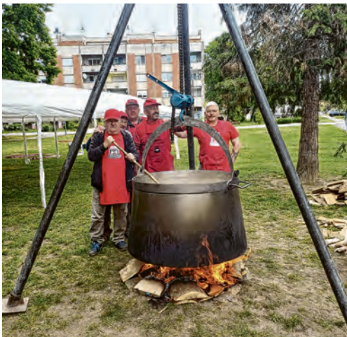
Grah su kuhali Kotličari u 600-litrenom kotliću