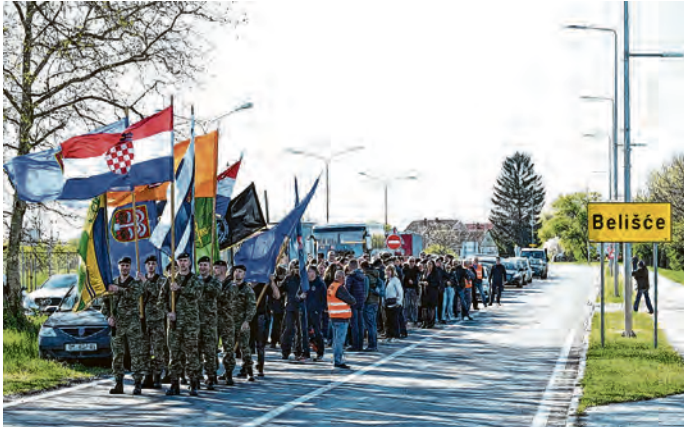
Mimohod je krenuo od belišćanskog mosta