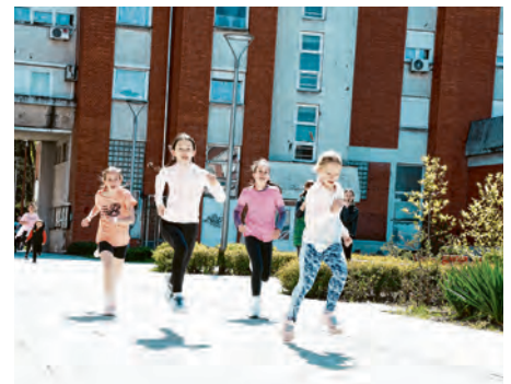
Utrka „Život za život“