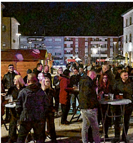
Prva svibanjska večer u Belišću uz glazbu