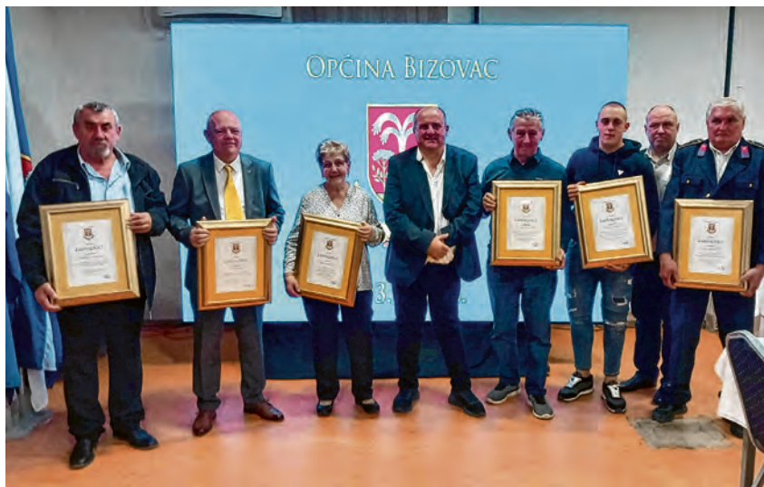
Dobitnici javnih priznanja

Prigodom 33. obljetnice osnutka načelnik Vuković posebnu je zahvalu izrekao odgojno-obrazovnim ustanovama - osnovnoj školi i dječjem vrtiću - kao i svim nositeljima društvenog života, aktivnim pojedincima i entuzijastima u sportskim i kulturnim udrugama, vatrogascima, čuvarima tradicijske baštine, medijima te hrvatskim braniteljima, a i ovom prigodom s pijetetom se prisjetio neuduznih žrtava raketiranja Bizovca 7. studenog 1991. Svim stanovnicima bizovačke općine uputio je srdačne čestitke u povodu Dana općine, među kojima posebno mjesto pripada dobitnicima javnih priznanja.