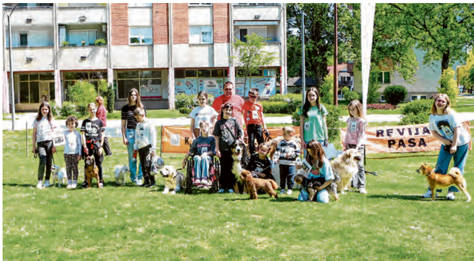
Sretna dječja lica na Reviji Dijete i pas