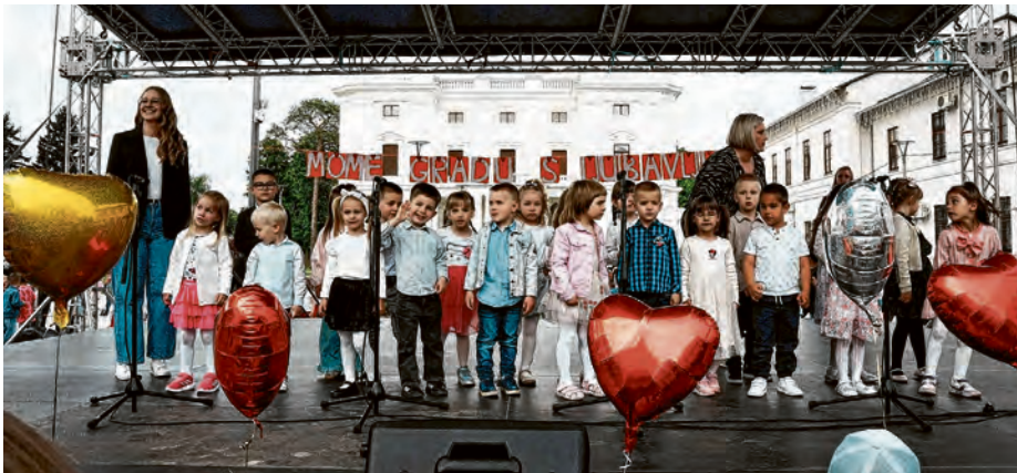
Najljepše čestitke gradu uputili su vrtičarci

Program obilježavanja Dana grada nastavlja se i u danima koji slijede, stoga ne propustite biti dio slavljeničkog ugođaja i pridružite se događanjima u čast našeg Belišća.