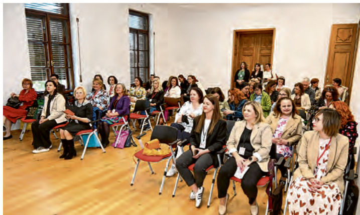
Stručni skup knjižničara u Belišću