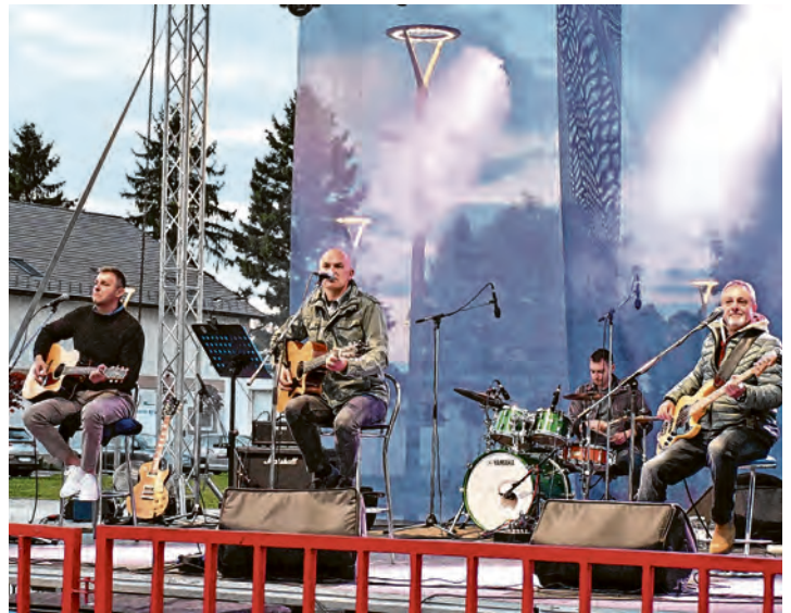
Nastup Glazbenog odgoja