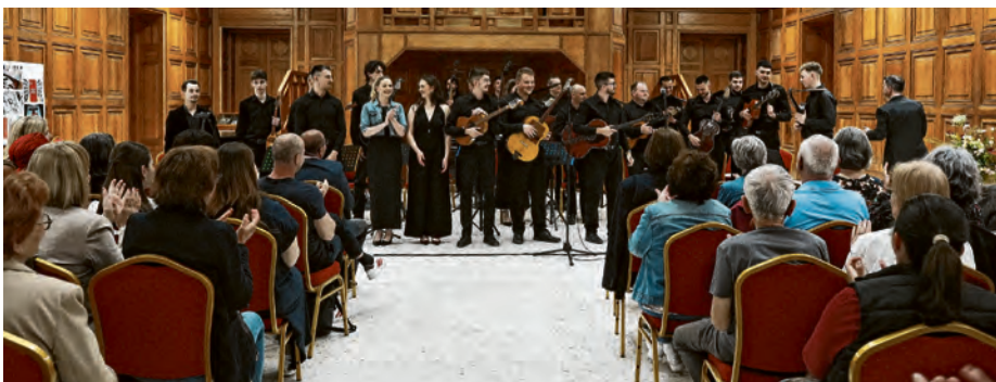
Publika je uživala u izvedbama