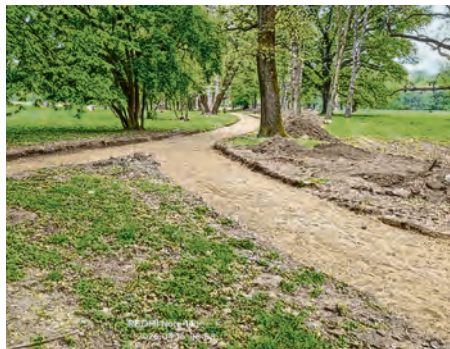
Obnova staza i šetnica u parku

„Pilot projekt razvoja zelene infrastrukture i/ili kružnog gospodarenja prostorom i zgradama Grada Valpova“ u cijelosti se financira nepovratnim sredstvima iz Nacionalnog plana oporavka i otpornosti 2021. - 2026. (NPOO).