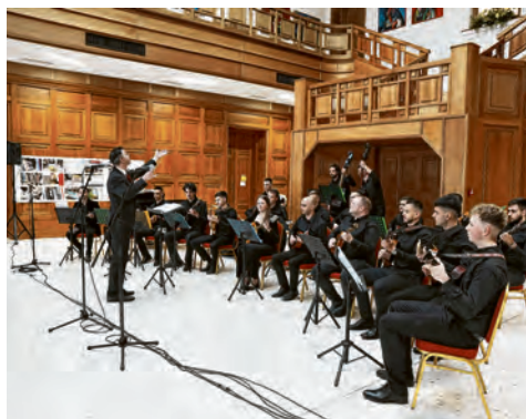
Tamburaški orkestar napravio je odličan ugođaj