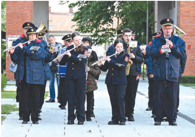
Budnica ulicama Belišća