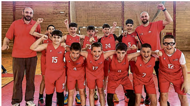
Belišćani sedmi u Hrvatskoj