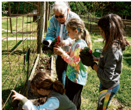
Djeca i mladi uživali su u programu