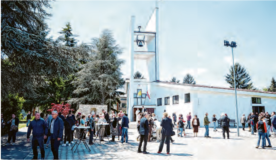
Brojni vjernici stigli su na proslavu jubileja