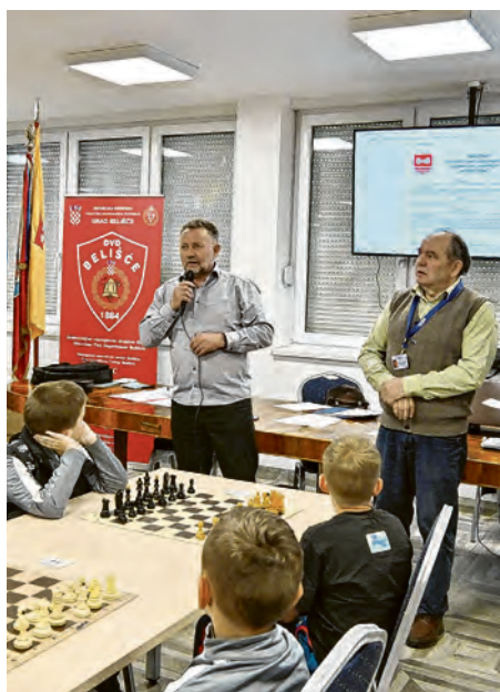
Turnir je okupio najbolje mlade šahiste

OTVORENI KADETSKI ŠAHOVSKI TURNIR ZA DAN GRADA BELIŠĆA