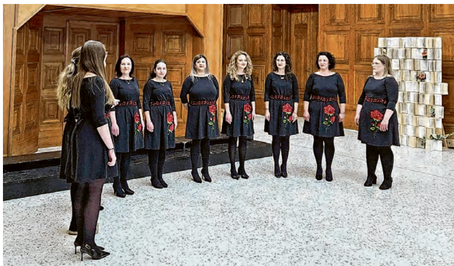
Svoj doprinos koncertu dale su i Bocanjevčanke