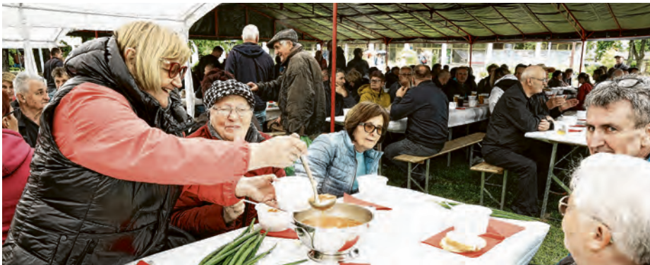
Belišćani su uživali u ručku i druženju