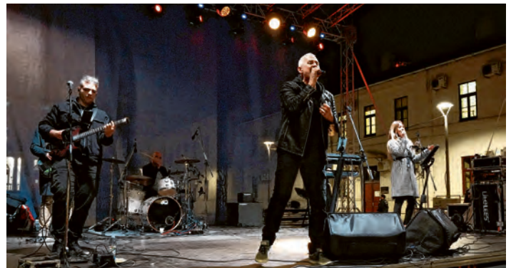
Svevremenski hitovi Giuliana odzvanjali su gradom