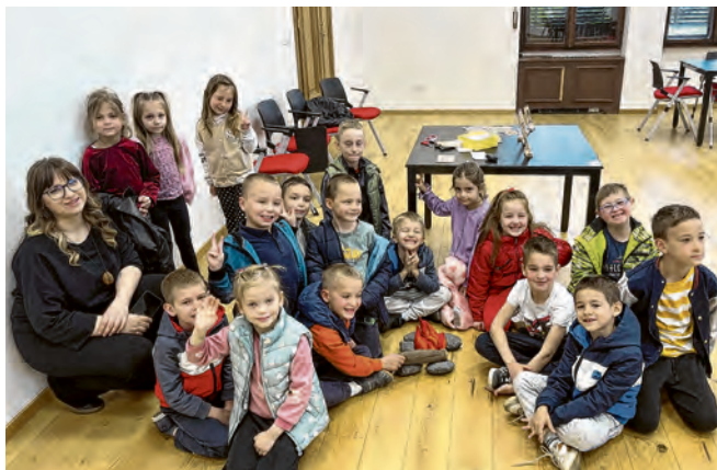
Radionica u projektu "Od igre do znanja"