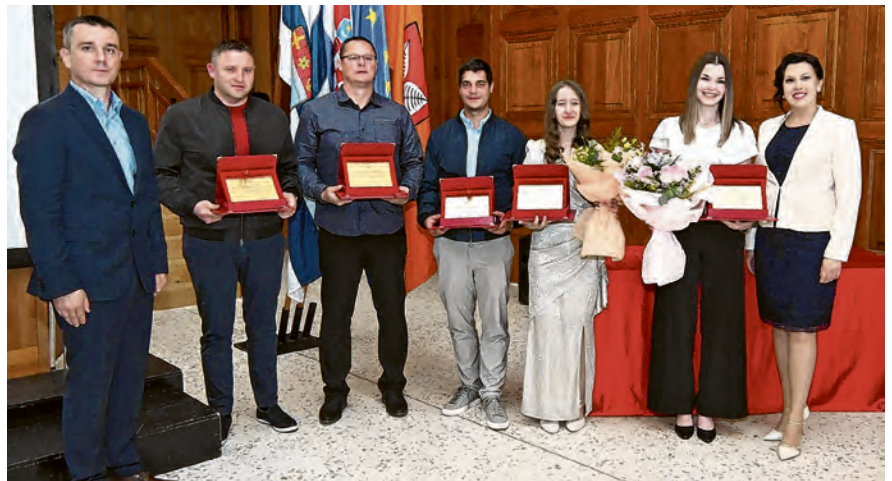
Dobitnici javnih priznanja