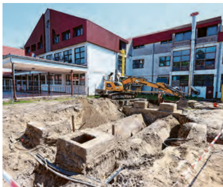
Rekonstrukcija i dogradnja škole

- Ovo je jedno od najvećih ulaganja Osječko-baranjske županije u dogradnju osnovnih škola. Vrijednost je projekta 8,8 milijuna eura, od čega je iz županijskog proračuna osigurano gotovo 2,8 milijuna eura, a uz potporu Vlade RH i fondova EU-a preostali iznos od 6 milijuna eura. Uz dogradnju škole, kako bismo osigurali jednosmjensku nastavu, obnovit ćemo i postojeću zgradu škole, te preurediti potkrovlje kako bi se osigurali kapaciteti za nove učionice i zaista moderne i kvalitetne uvjete za svu djecu u ovoj školi, koju pohađa više od 500 učenika. Nakon rekonstrukcije i dogradnje škola će imati ukupno 29 učionica -