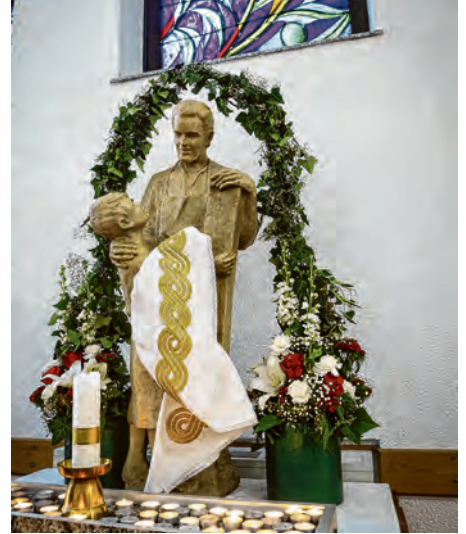
Sveti Josip Radnik – zaštitnik župe