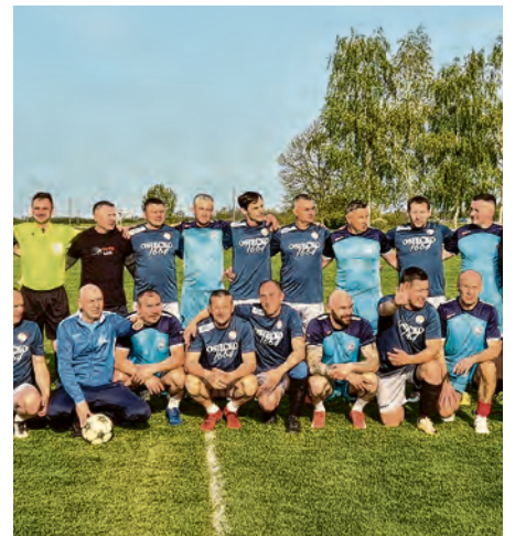
Nogometaši BSK i Policije

● Povodom Dana općine Bizovac 2026., a u sklopu programskih događanja obilježavanja stote obljetnice Nogometnog kluba „BSK“ Bizovac, u srijedu 15. travnja, u bizovačkom sportskom centru odigrana je tradicionalna prijateljska nogometna utakmica između veteranske momčadi BSK-a i najboljih nogometaša Policijske uprave Osječko-baranjske županije. Susret je završio rezultatom 5:4 u korist domaćina - veterana BSK-a. Lidija Aničić