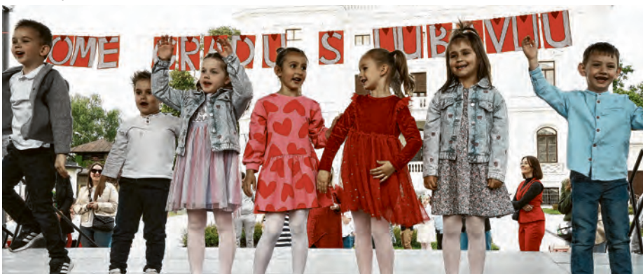
Pjesme najmlađih ispunile su središte grada