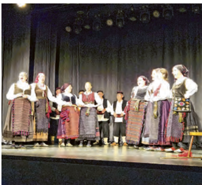
Program Lika u Belišću