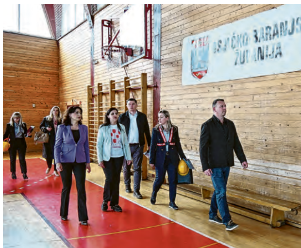
Županica, gradonačelnica i ravnatelj u školskoj dvorani

Riječ je najvećem investicijskom ciklusu u obrazovanje u našoj županiji, kojim se dugoročno podiže standard obrazovanja i stvara temelj za kvalitetniju budućnost mladih generacija. - Nastavljamo s ovakvim ulaganjima, kako bismo osigurali jednake uvjete za svu djecu na području OBŽ-a - poručili su iz Županije.