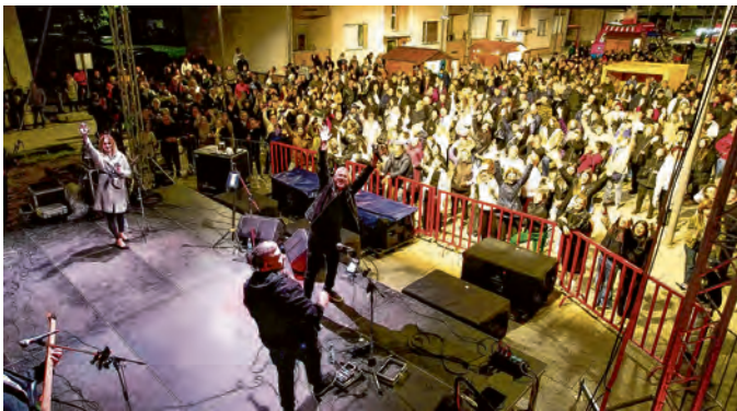
Koncert Guliana rasplesao je brojnu publiku