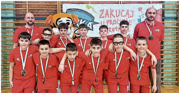
Prvaci turnira u Virovitici (ako ne stanu obje slike)