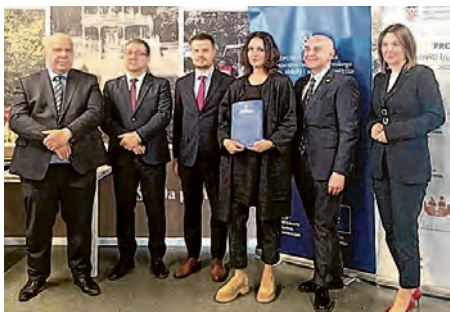
Svečanost potpisivanja ugovora

UDRUGA INKLUZIVNA KUĆA ZVONO ZAPOČINJE PROVEDBU NOVOG PROJEKTA