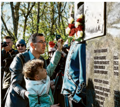
Ruže za muževe, očeve i djedove