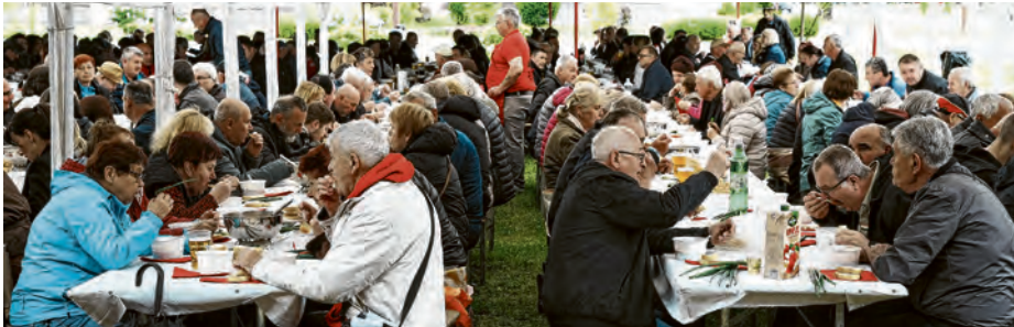
Ručak s građanima