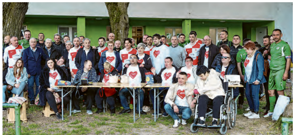
Brojna publika uživala je u sportskom nadmetanju

„Valpovka ove godine slavi stotinu godina postojanja. To je stoljeće zajedništva, emocija, pobjeda i poraza, ali prije svega - ljudi. Ljudi koji su kroz generacije gradili naš klub i time ga utkali u identitet grada. Valpovka će stogodišnjicu postojanja proslaviti nizom aktivnosti tijekom godine kako bi sve generacije bile uključene u proslavu. Prvi u nizu događaja je humanitarna utakmica Humanih zvijezda Hrvatske i veterana Valpovke. Tom humanitarnom utakmicom i donatorskom večerom pokazali smo da no-