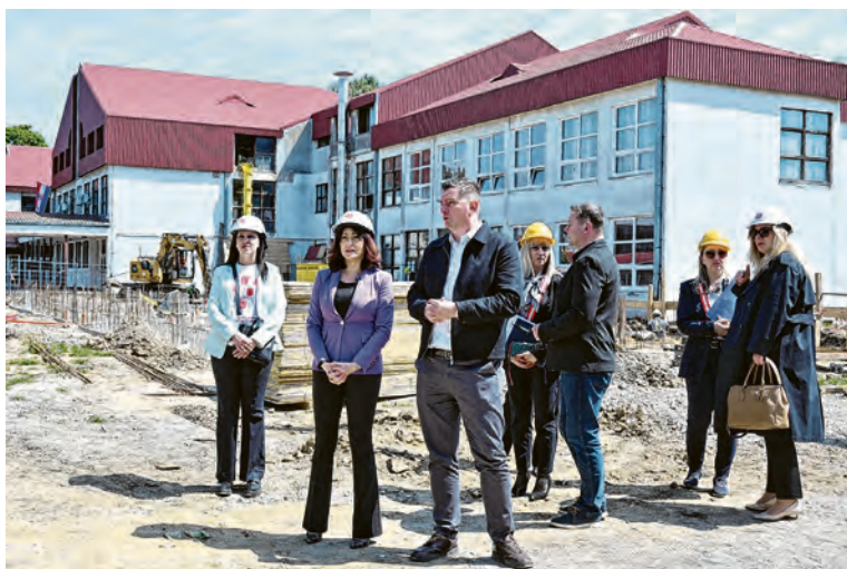
Obilazak gradilišta u Belišću