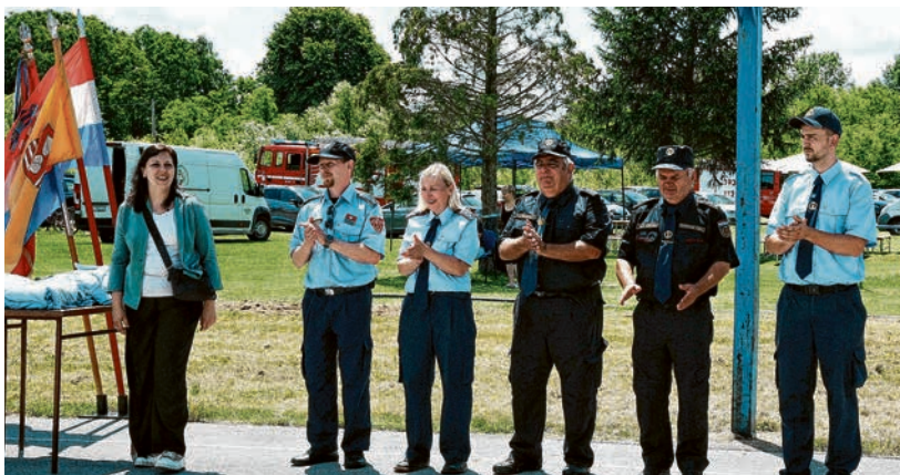
Sudionike Gradskog vatrogasnog natjecanja u Gatu pozdravila je i gradonačelnica