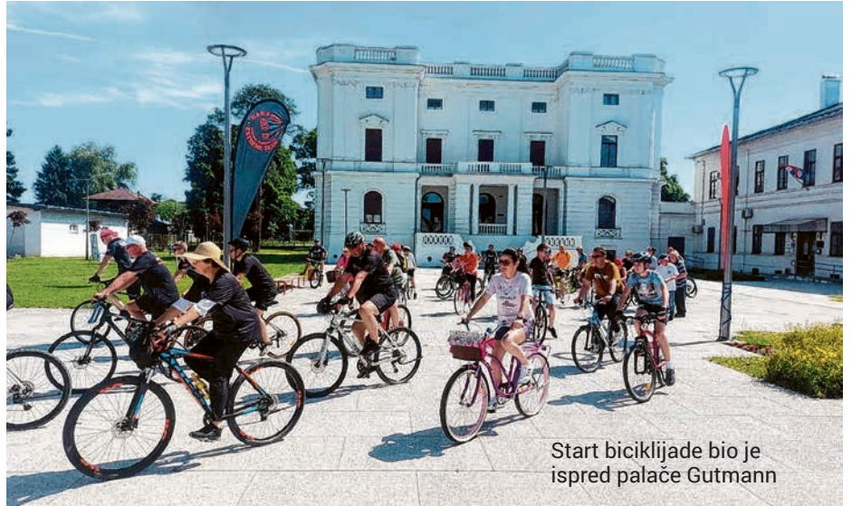
Start biciklijade bio je ispred palače Gutmann