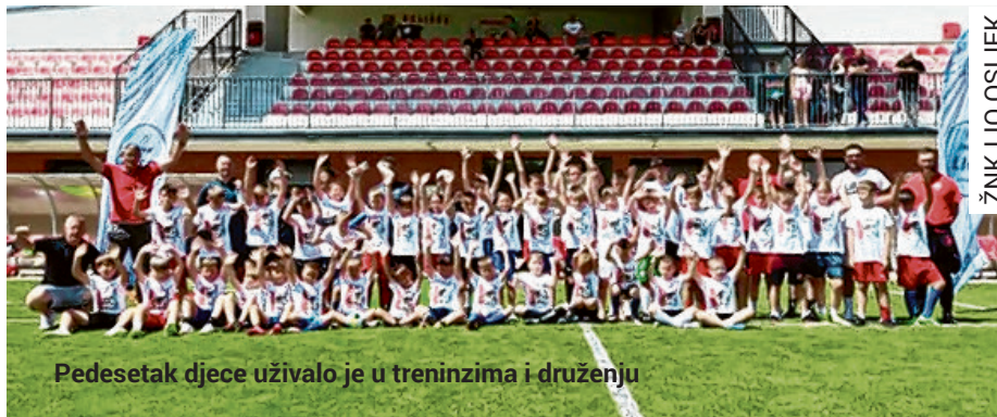
Pedesetak djece uživalo je u treninzima i druženju