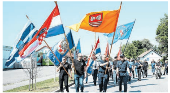
Mimohod do gradskog groblja