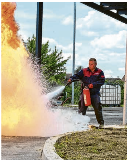
Požar u blizini pogona za pročišćavanje otpadnih voda