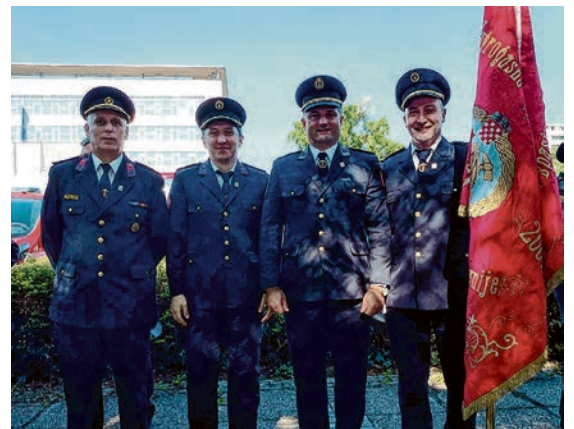
Belišćanski vatrogasci na proslavi 150 godina HVZ-a