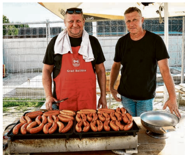
Bogata je bila i gastronomska ponuda