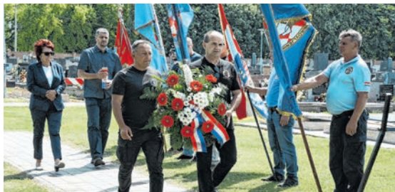
Odavanje počasti poginulima