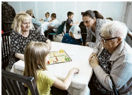
Čovječe ne ljuti se za one malo mlađe