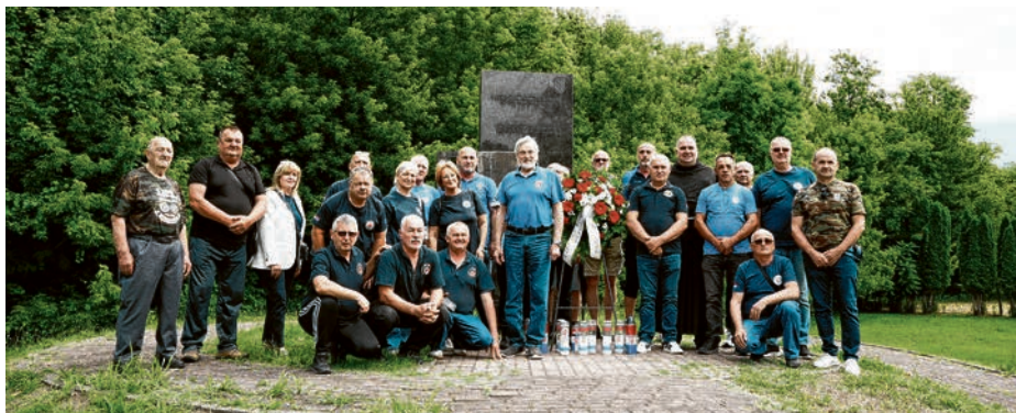
Počast braniteljima kod spomenika 107. brigade