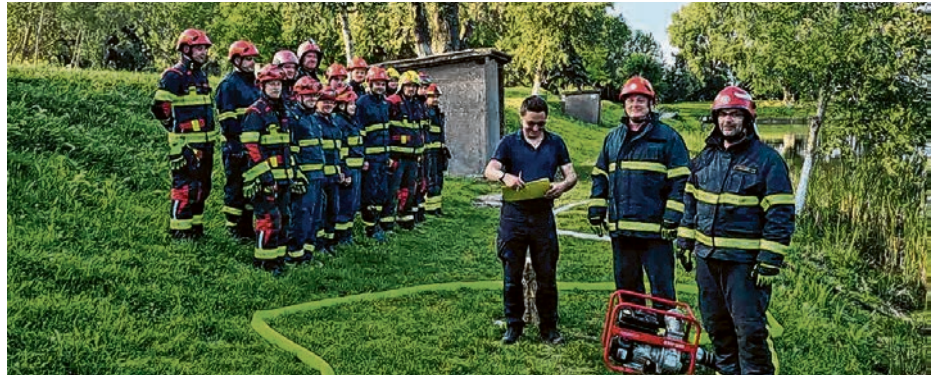
Vatrogasci na osposobljavanju

Pripadnici belišćanske vatrogasne postrojbe bili su važan dio sustava i prilikom održavanja vježbe civilne zaštite "Olujno nevrijeme 2026.", a sudjelovali su i na osposobljavanju za različite specijalnosti, započeto u travnju. Članovi dobrovoljnih vatrogasnih društava s područja Vatrogasne zajednice grada Belišća izrazili su velik interes za osposobljavanje za vatrogasne specijalnosti te su ga do sada brojni kandidati uspješno završili. Sva nova znanja, a posebno novi osposobljeni vatrogasci, čine veliki napredak u radu i razvoju svakog dobrovoljnog vatrogasnog društva.