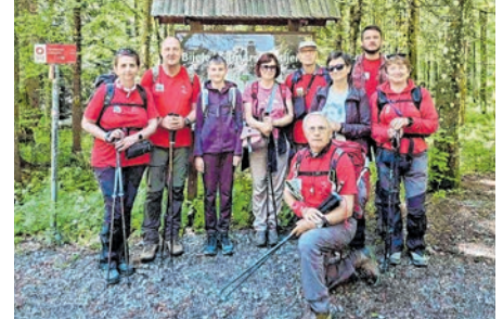
Belišćanski planinari u Gorskom kotaru