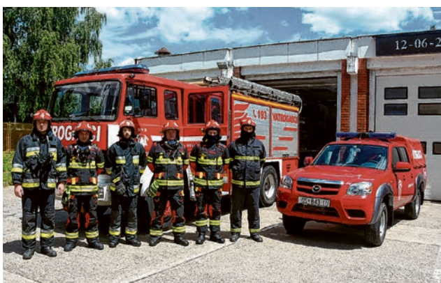
U vježbi je sudjelovalo 9 vatrogasaca s 2 vozila