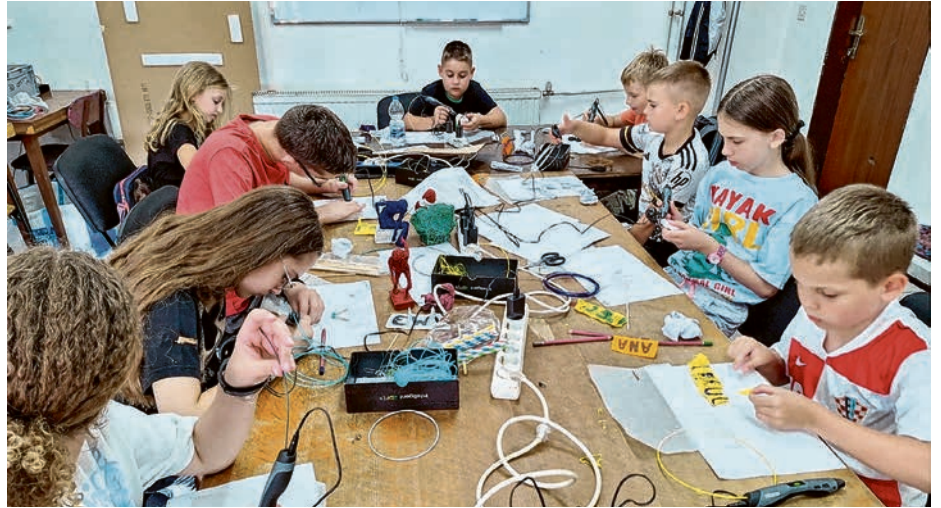
Djeca su uživala na prošlogodišnjim radionicama

U ZTK-u VALPOVO-BELIŠĆE POČINJE 16. „LJETO U TEHNICI“