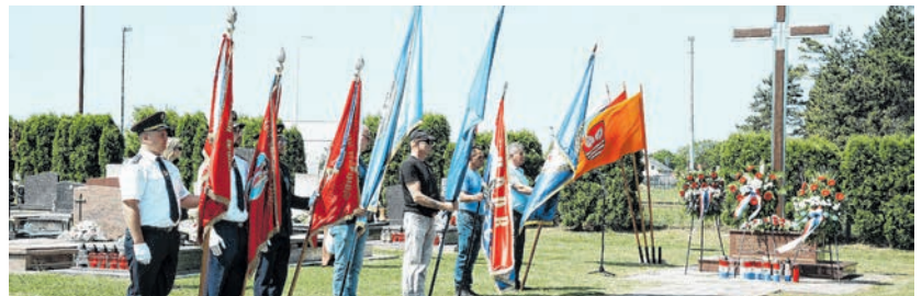
Svečanost molitve i polaganja vijenaca