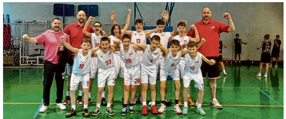
Mladi belišćanski košarkaši okitili su se srebrom