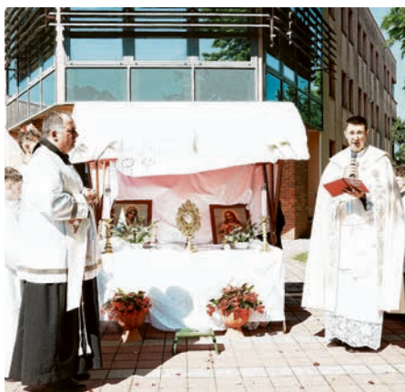
Molitva i služba riječi kod postaja

vjere u trajnu prisutnost Krista pod prilikama posvećenog kruha, a na ovaj je način - izvan župnog dvorišta - u Belišću održana osmu godinu zaredom. Dvije su poruke proslave ove svetkovine. Prva je Božja poruka čovjeku: Ja sam kruh živi koji je s neba sišao! To su Isusove riječi. Druga poruka je naša: Vjerujemo da je u tom posvećenom kruhu prisutan Isus Krist, Uskrsli, Onaj kojega blagujemo da bismo imali život vječni i da bismo po njemu bili slika ljubavi u svijetu za svakog čovjeka. Pokojni papa Benedikt XVI. to je definirao riječima: „S kruhom vječnog života nebo silazi na zemlju. Božje sutra uključuje se u sadašnjost, a vrijeme je kao zakriljeno božanskom vječnošću.“