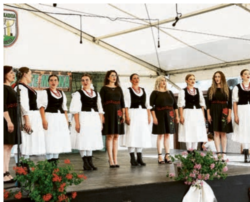
Domaći izvođači uvijek iznova oduševljavaju