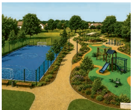
Igralište u Učkoj ulici