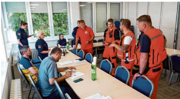
Stožerno-zapovjedna baza bila je u DVD-u Belišće