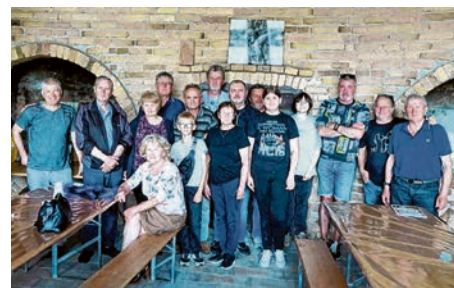
Sudionici kolonije u Kotlini

Kolonija je okupila 25 slikara, članova belišćanske Likovne udruge Bel-art te gostujućih umjetnika iz Baranje i Čepina. Okupljeni slikari radili su na platnima dimenzija 50 x 70 cm, u tehnici akrila i ulja, a organizatori su sudionicima ponudili tri motiva - stare zanate, konje i pejzaže belišćanskih prigradskih naselja. Na početku kolonije okupljenim umjetnicima prigodnim su se riječima obratili ravnateljica Muzeja Nada Milas Bosanac i predsjednik Bel-art Ivan Vajda. Svi nastali radovi bit će predstavljeni javnosti na izložbi koja je planirana za početak srpnja. U organizaciji Demokratske zajednice Mađara Hrvatske - Udruge Kotlina, u subotu, 13. lipnja, održana je likovna kolonija koja je okupila dvadesetak slikara i