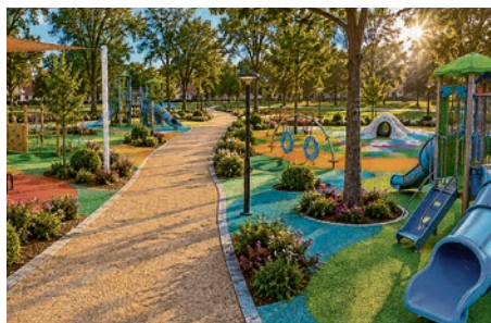
Igralište u Naselju Ljudevita Gaja 1

Završetkom ovoga projekta i sva gradska parkirališta bit će obnovljena, a dobit ćemo i 114 novih od kojih ističem parkiralište iza gradske sportske dvorane i parkiralište kod Dječjeg vrtića Maza za kojima se, u posljednje vrijeme, pokazala prijevremena potreba. S nestrpljenjem čekamo potpis ugovora, početak radova te naravno i sam završetak radova“, rekao je gradonačelnik Matko Šutalo prilikom obračuna javnosti. Izvor: Grad Valpovo