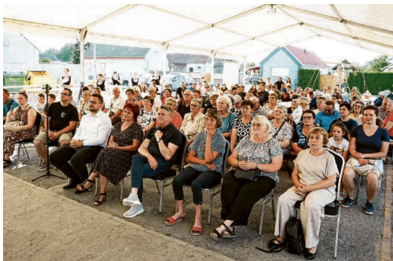
Posjetitelji su uživali u programu