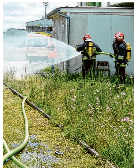
Uspostavljanje vodenog zastora