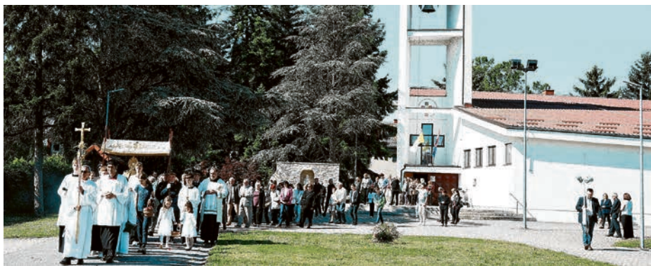
Procesija je krenula od župne crkve

Tijelovska procesija javno je očitovanje