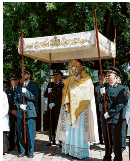
Vatrogasci su tradicionalno nosili baldahin