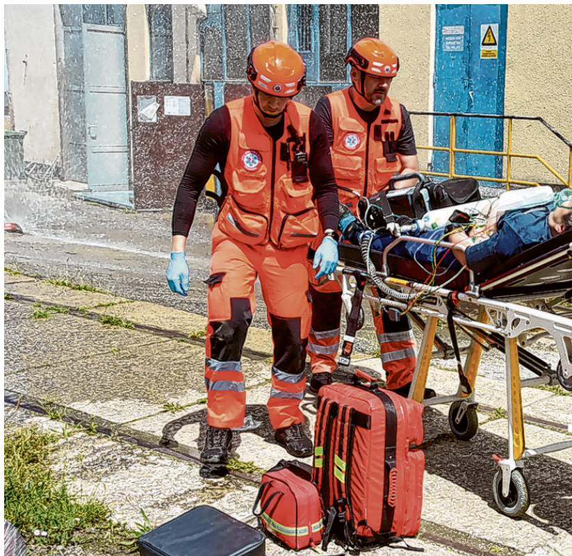
Ozlijeđenog su evakuirali djelatnici hitne medicinske pomoći