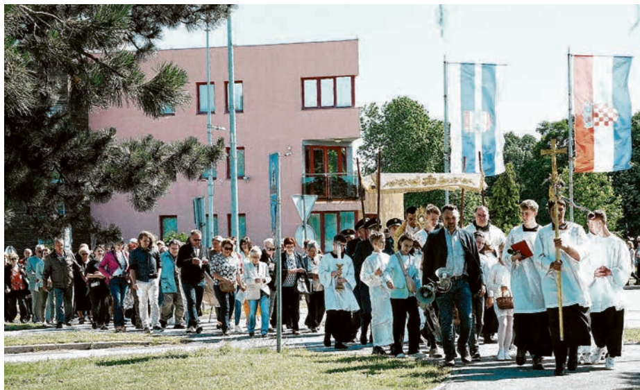
Lijepa tradicija tijelovske procesije u Belišću traje osam godina