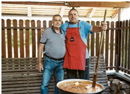
Ni gastronomskih užitaka nije nedostajalo