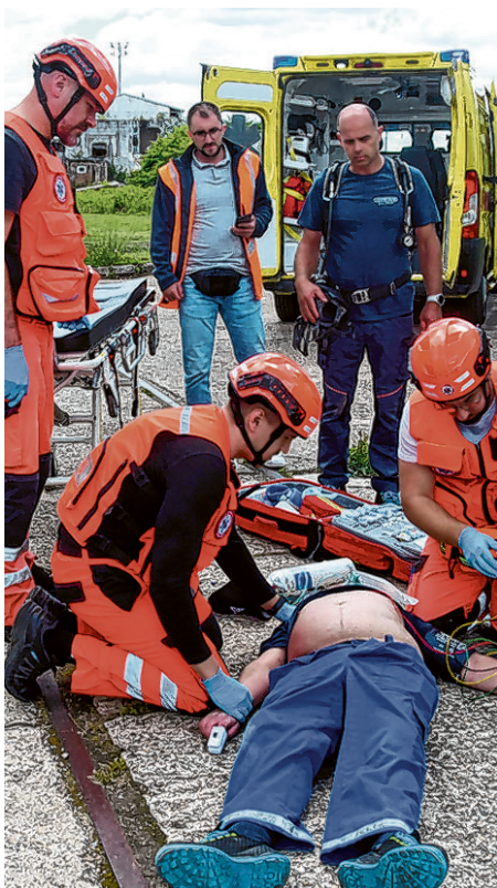
Trebalo je pružiti pomoć i ozlijeđenoj osobi