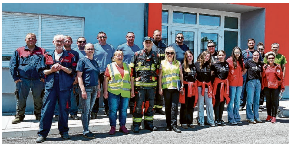
Sudionici vježbe "Olujno nevrijeme 2026."

ja, uspostavili su zaštitni vodeni zastor ispred skladišta kloro kako bi spriječili širenje opasne tvari. Ozlijeđena osoba prethodno je evakuirana iz objekta te zbrinuta od djelatnika hitne medicinske pomoći. Vatrogasci su potom postavili dodatni raspršeni mlaz radi uspostavljanja sigurnih uvjeta za rad i sprječavanja širenja oblaka kloro. Nakon uspješno provedene intervencije slijedilo je spremanje opreme i povratak u bazu.