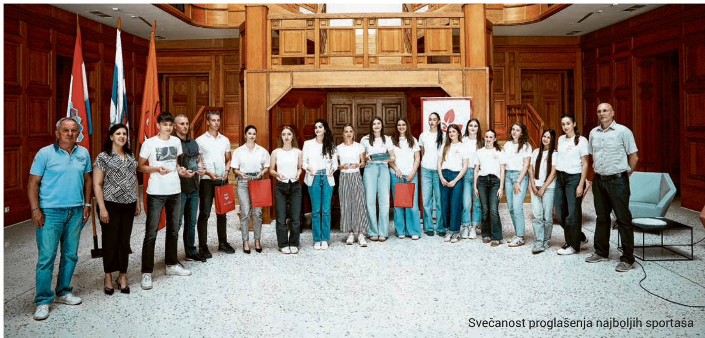
Svečanost proglašenja najboljih sportaša