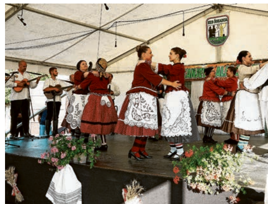
Sadržajne i zanimljive izvedbe KUD-ova