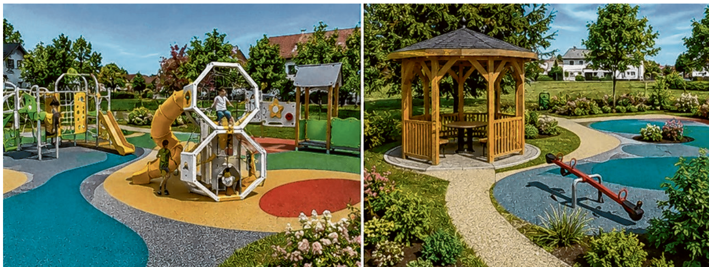
Igralište u Naselju Josipa Kozarca