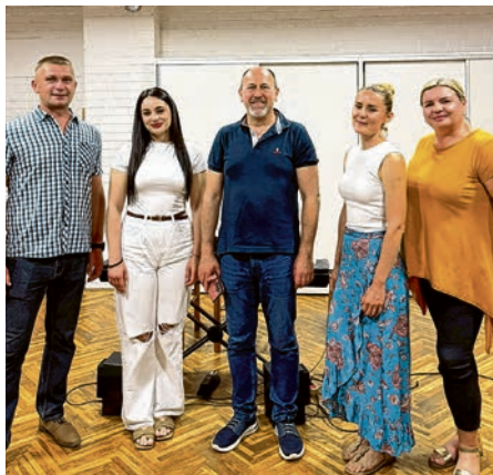
Novo vodstvo CPD-a MIR Belišće

Nakon završetka službenog dijela skupštine članovi zbora okreću se novim obvezama i izazovima. Pred njima su nove probe, nastupi i zajednički projekti, kojima se raduju s jednakim entuzijazmom kao i dosad.