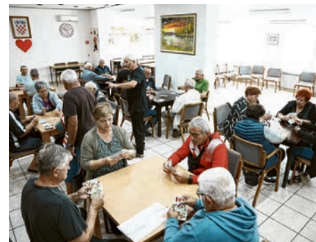
Turnir u belu okupio je brojne sudionike